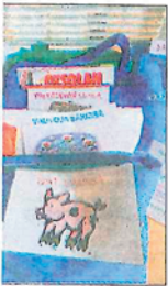
itä sillejä on monen-