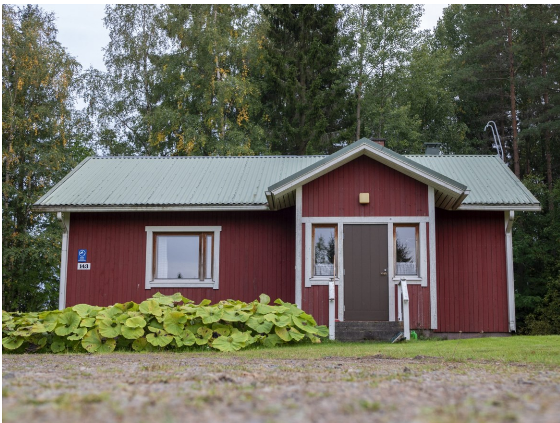
KUVA 1. Kuusiratin kylätalo.

Vihannin kunta yhdistyi Raahen kaupunkiin vuonna 2013. Kuntaliitoksen jälkimainingeissa Raahen kaupunki laittoi omistukseensa siirtyneen Kuusiratin kylätalon myyntiin. Kuusiratin asukkaat eivät halunneet luopua kyläläisten aikanaan talkootyönä rakentamasta kylätalosta, joten kylätoimikunta rekisteröitiin yhdistykseksi huhtikuussa 2014, jotta kaupungille voitiin tehdä tarjous kylätalon ostamisesta. Kaupat tehtiin ja kylätalon omistus siirtyi tuoreelle Kuusiratiset ry:lle. (Kuusiratiset ry 2015.)