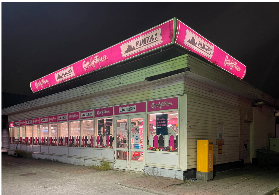
KUVA 3. Viimeisiä viikkoja videovuokrausta harjoittava liike iltahämärässä. (Timo Vasara, 2023)

oli tuleva päätökseensä. Lokakuussa 2023 uutisoitiin yhtiön lopettavan elokuvien vuokraamisen viimeisissäkin pääkaupunkiseudulla jäljellä olevissa liikkeissään ja keskittyvän kokonaan irtokarkkien myyntiin. Nurmisen mukaan videovuokraus on kattanut enää vain muutaman prosentin Filmtownin liikevaihdosta. (Oksa 2023.) Alla olevassa kuvassa Helsingin viimeiseksi jäänyt Filmtownin myymälä.