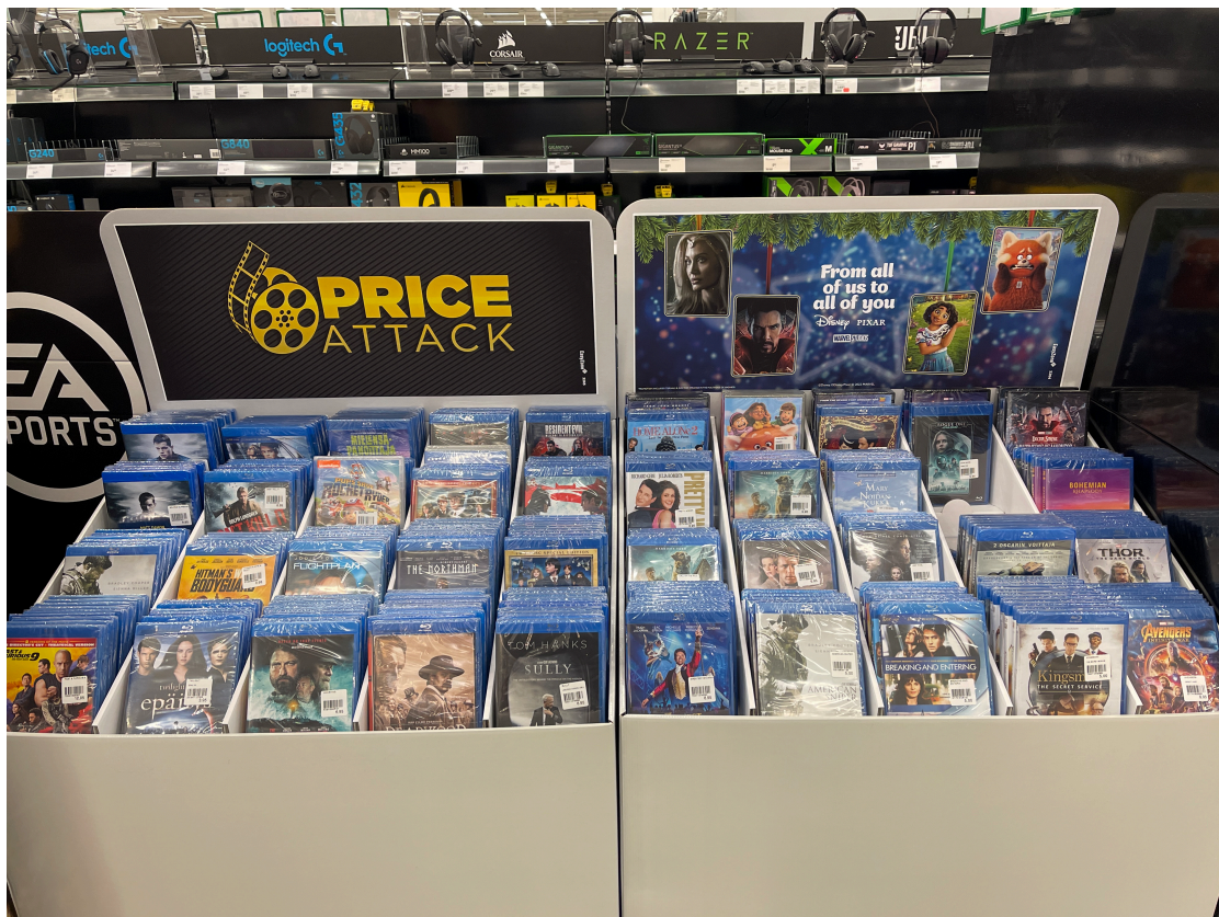
KUVA 4. Elokuvia myytävänä. (Timo Vasara, 2023)

myös asiakkaiden kiinnostus? Kuvassa suomalaisen hypermarketin tyypillinen elokuvaosasto vuonna 2023.