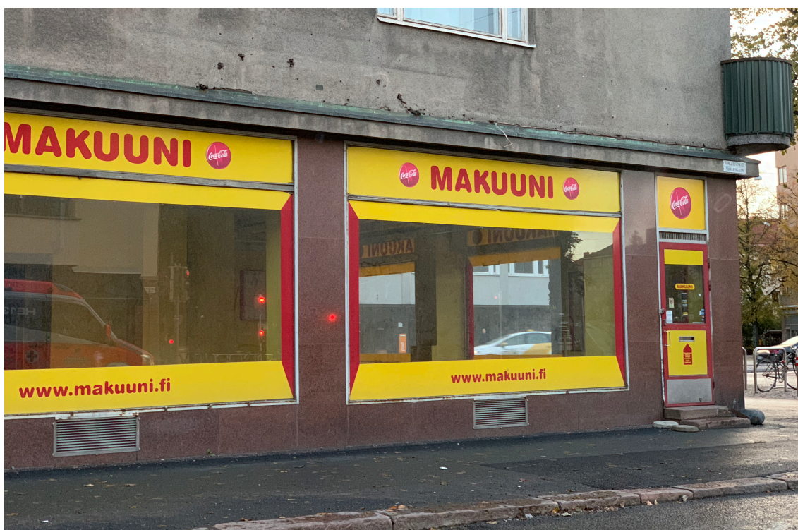
KUVA 2. Videovuokraamot katoavat katumaisemasta.