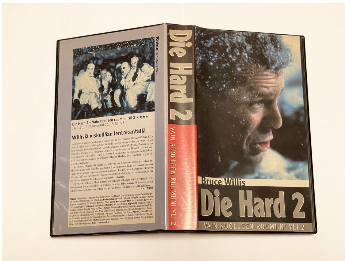
KUVA 1. Renny Harlinin jatko-osa toimintaklassikolle sai videokannen numero 1 071. (Timo Vasara, 2024)

Tekijänoikeuden tiedotus- ja valvontakeskuksen mukaan ”vuokratut, kaupasta ostetut ja TV:stä tallennetut elokuvat ovat tarkoitettu lähtökohtaisesti yksityiskäyttöön”. (Tekijänoikeus.fi n.d.) Suomen laissa linjataan, että ”julkistetusta teoksesta saa jokainen valmistaa muutaman kappaleen yksityistä käyttöönsä varten. Siten valmistettua kappaletta ei ole lupa käyttää muuhun tarkoitukseen” (Tekijänoikeuslaki). Videonauhureiden suosion hiivuttua tilalle tulivat digiboksit, joihin kuluttajat pystyivät ajastamaan suosikkisisältöään gigatavuittain.