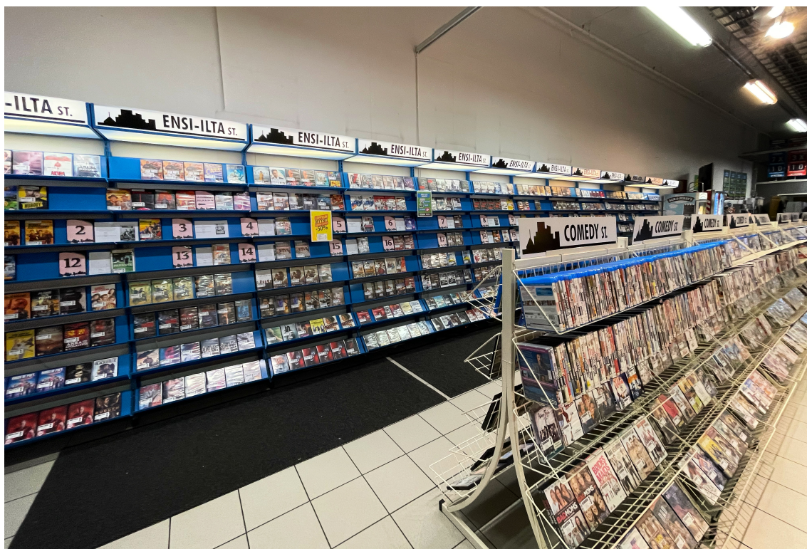
KUVA 6. Hyllyissä on monen eri levittäjän elokuvia.

Tarjonnan pirstaloituminen moneen eri palveluun ja digitaaliseen vuokraamoon on johtanut siihen, että katsojille on tehty nettisivuja kuten Justwatch, jolta voi etukäteen selvittää, mistä mikäkin elokuva löytyy. Kivijalkavuokraamoiden aikaan oli tavallaan helpompaa, sillä kaikkien studioiden elokuvat löytyivät samasta paikasta. Mikäli ei tilaa useampaa suoratoistopalvelua, joutuu kuluttaja tyytymään vain niihin elokuviin, joita hänen omasta palvelustaan löytyy. Kyynisesti voisikin todeta, ettei peruskatsoja enää voi valita tiettyä leffaa, vaan jonkun leffan. Kuvassa videovuokraamon tarjontaa.