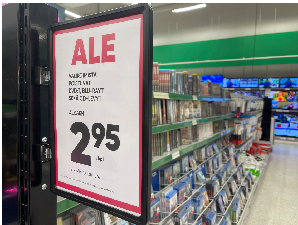
KUVA 5. Kauppojen valikoimat pienentyvät.

kertoivat lokakuussa 2023 MTV Uutisille, ettei kummallakaan ketjulla ole tallennemyynnin laskusuunnasta huolimatta suunnitteilla lopettaa kokonaan fyysisen median myyntiä (Aarnio 2023). S-ryhmän myyntipäällikkö Petrus Lesonen täsmentää, että vaikka elokuvien perusvalikoima pienenee, jäävät myymälöihin tarjolle uutuuselokuvat. Sen sijaan ketjun verkkokaupan laajaa elokuvavalikoimaa ei ole tarkoitus supistaa. ” Fyysisten tallenteiden kysyntä on vähentynyt merkittävästi, eikä sellaista näkymää ole, että tähän olisi tulossa muutosta ”, Lesonen summaa, mutta toteaa lisäksi, että elokuvaharrastajat haluavat yhä fyysisen tallenteen, joka myös tarjoaa parhaan kuvan- ja äänenlaadun. (Lesonen 2023.) Selvää kuitenkin lienee, että levitysyhtiöt eri puolilla maailmaa punnitsevat tarkasti fyysisten julkaisujen kannattavuutta. Kuvassa tamperelaisen Prisman tallenneosaston loppuunmyynti-ilmoitus tammikuussa 2024.