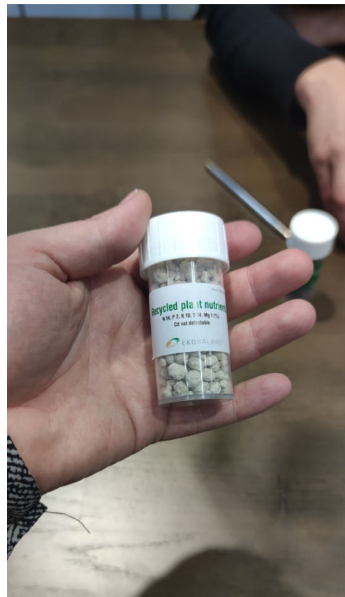
Bilder tagna från mässans utställning (t.v.) och efter diskussion med Emma Dalväg och Tobias Jansson kring deras bok 'Symbios', och exempel på växtnäring skapat från restflöden (t.h.)