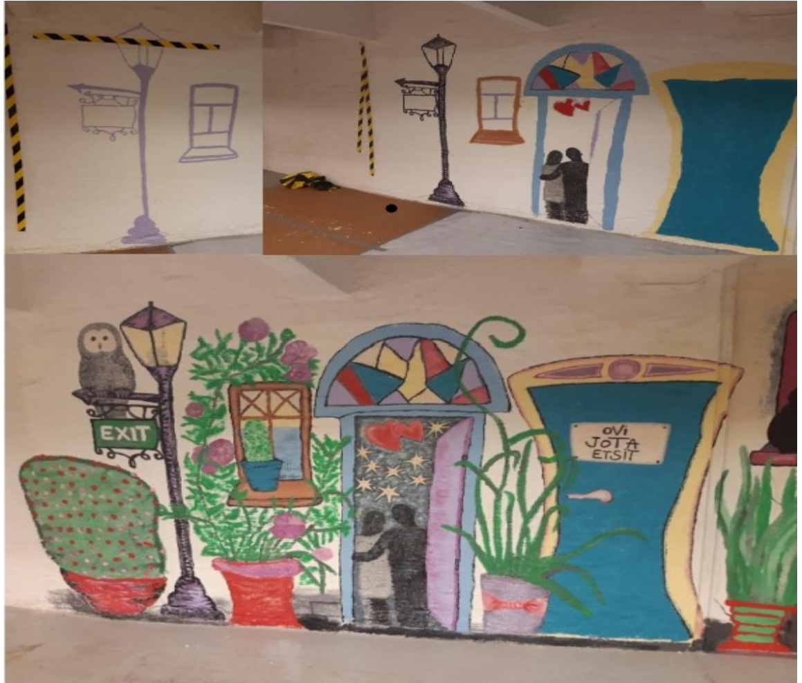
Kuva 10 Kuva teoksen tekemisen eri vaiheista

Seinään heijastettujen kuvien ääriviivat vahvistettiin maalaamalla. Ääriviivojen maalaamisen jälkeen kuvien työstäminen jatkui monivaiheisesti osallistujan haluamalla tavalla lisäämällä värejä, muotoja ja yksityiskohtia. Loppuaiheessa maalattiin kuvan etuosaan tulevat asiat kuten kukkaruukut ja kasvit. Kuvassa 10 näkyy teoksen tekemisen eri vaiheita.