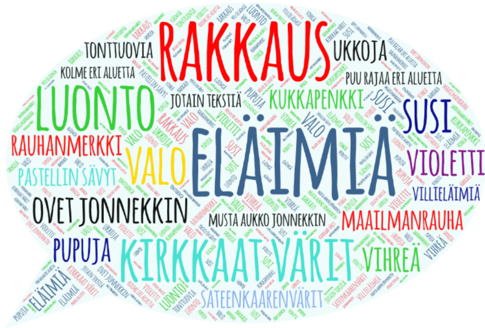
Kuva 7 Keskustelujen kautta kerätyt sanat teoksen kuvan suunnitteluun

Muita kirjaamiani sanoja ovat: ”rauhanmerkki”, ”maailmanrauha”, ”rakkaus”, ”valo”, ”luonto”, ”kukkapenkki”, ”tonttuovia”, ”ukkoja”. Jotkut vastaukset olivat luonteeltaan abstraktisimpia: aiheita oli kuvattu sanoilla ”musta aukko jonnekin...”, ”puu rajaa eri alueita”, ”Ovet jonnekin”, ”jotain tekstiä”, ”kolme eri aluetta”. Viimeinen sana ”kolme eri aluetta” liittyi keskustelussa laajempaan pohdintaan ihmisen elämästä ja elämänsäkulusta. ”Ovet jonnekin” ajatus oli myös osa laajempaa ja syvällisempää keskustelua elämänsäkulusta. ”Ovet jonnekin” keskusteluun liittyi myös tunnettu sanonta ”kun yksi ovi sulkeutuu, niin toinen avautuu”.