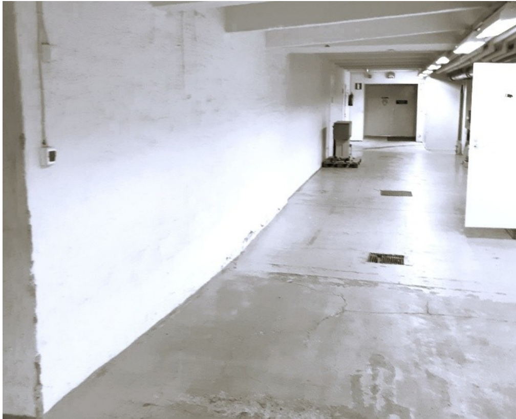
Kuva 4 Kuva käytävän seinästä johon teos tehdään

Alkuseveltelyjen, lupien ja reunaehtojen määrittelyjen jälkeen prosessin eteneminen tapahtui tutkivaan ja kehittävään toimintaan syventyen aiheeseen. Perehdyin tietoon taiteen vaikutuksista hyvinvointiin sekä kohdeyleisön tarpeisiin sekä yhteisötaiteen käsitteisiin ja tarkoitusperiin. Aineistoon perehtymisen yhteydessä kävin keskusteluja toimeksiantajan ja yhteisön kanssa aiheesta, jotta tutkimuskysymyksen määrittely ja toiminnan suunnittelu olisi tarkoituksenmukaista. Tein opinnäytetyösuunnitelman ja aineistohallintasuunnitelman sekä eettiset toimintaperiaatteet. Hyvän tutkimuskäytännön mukaisesti eettistä toimintaa tulee tarkastella koko toiminnan aikana. Toiminnan dokumentaation kerääminen havainnoimalla ja keskustellen osoittautui hyväksi dokumentoitavaksi. Kerätyn aineiston analysointia ja reflektioiva tarkastelu on yksi tutkimustyön keskeisimpiä tehtäviä. Keskustelemalla yhdessä yhteisön kanssa suunniteltiin seinämaalauksen aihe ja havaintokuvat muodostuivat suunnittelun aikana. Maalaustoiminnan esivalmistelut ja tarvikehankinnat seinämaalaustyöskentelyyn määrittyivät vasta, kun olin hakenut kiinteistön omistajalta lahjoittamat maalit. Saimme Entsingitä lahjoituksena toimintaan suojamateriaalia maalaustyön tekemisen ajaksi. Esivalmistelujen ja tarvikehankintoja tehtiin yhdessä yhteisön jäsenten kanssa ja samalla kävin keskusteluja tulevasta maalausprosessista.