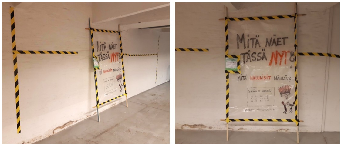
Kuva 5 Seinä, jonka vierellä keskustelimme yhteisötaideaiheesta

Kysymyksen tarkoitus oli saada ideoita ja ajatuksia siitä, mitä seinälle lähdetään maalaamaan. Tämän kysymyksen tehdessä yleensä vein keskustelukumppanin seinän viereen katsomaan seinää kohdasta, johon taidetta oli suunnitteilla tehdä. Kuvassa 5 on kohta, jossa kävimme keskustelua aiheesta.