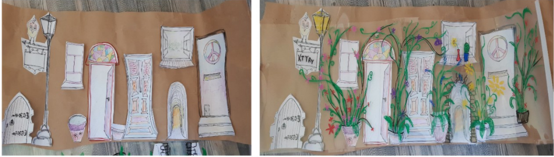
Kuva 8 Mallikuvat prosessin kerroksellisuuden havainnointiin