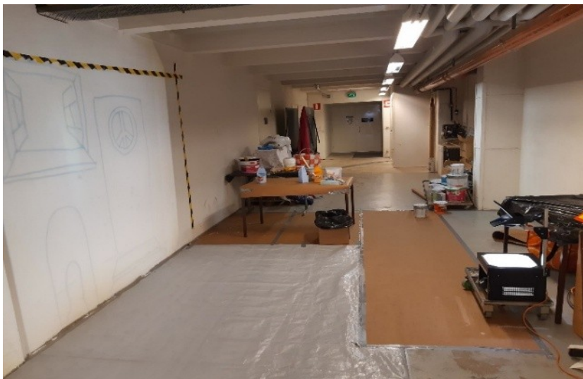
Kuva 9 Piirtoheittimen avulla kuvan ääriviivat hahmotuivat seinään

Teoksen tekeminen alkoi kuvaan liittyvien rajojien hahmottamisella seinään. Hahmotus tehtiin piirtoheittimen avulla heijastamalla kuvan rajat ja maalaamalla ääriviivat seinään. Kuvassa 9 näkyy kuvan hahmottelemisen vaihe. Ääriviivojen jälkeen vahvistettiin rajojia ja maalattiin pohjavärit. Jokaisessa vaiheessa oli mahdollisuus vaikuttaa lopputulokseen tuomalla omia ideoita ja ajatuksia teoksen etenemisen yhteydessä. Vaikuttamismahdollisuuksia oli myös kuvan elementtien järjestyksen valikoituessa sekä värien ja maalaustekniikan valinnoissa.