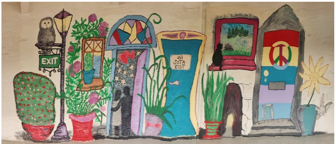
Kuva 11 Kuva valmiista yhteisötaideteoksesta

Yhteisötaideteos maalattiin kolmen päivän aikana. Kuvassa 11 näkyy valmis taideteos. Olin itse maalausprosessin aikana aina paikalla. Yhteisötaiteen teoksen maalaamiseen osallistui kolmen päivän aikana yhteensä 19 eri henkilöä. Samoja henkilöitä osallistui useampana päivänä ja useaan eri kertaan. Osallistujia prosessiin oli tekohetkellä paljon enemmän, jos prosessin osallistujiksi lasketaan myös ne, jotka eivät osallistuneet varsinaiseen maalaamiseen, mutta jotka keskustelivat maalaajien kanssa teoksen tekohetken yhteydessä. Vaikka he eivät konkreettisesti osallistuneet tekemiseen, he olivat kuitenkin yhteisön jäseniä yhdessäolon kautta. Näistä henkilöistä, jotka eivät osallistuneet konkreettisesti maalaamiseen en pitänyt tarkkaa kirjausta mutta arvioisin osallistujamäärän kasvavan noin 6–8 osallistujalla.