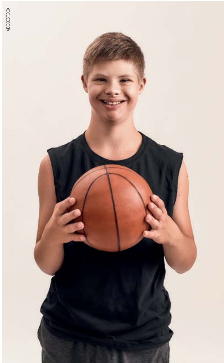
Osallistuminen itselle merkityksellisiin toimintoihin kuuluu lasten perusoikeuksiin.

Aikuisten vastauksissa nousi esiin lapsen toimintakyvyn rajoitteiden huomioiminen, harrastamiseen soveltuvat tilat ja välineet sekä sopiva aikataulu, tiivis ja informatiivinen yhteistyö eri toimijoiden välillä, ohjauk-