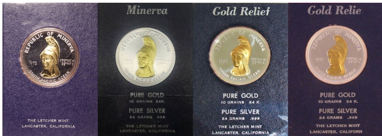
Kuva 5. Rahalevyn tekstiversioita. Vasemmalla ostamani ”perusversio”, siitä oikealla mustapohjainen Minerva-versio, Gold relief-versio ja oikealla Gold Relie-painovirheversio. Kuvien yhdistely ja muokkaus: Jorma Imppola, SeAMK.

rahalevystä. Pohjalevyjen eri versioihin on painettu otsikko rahan yläpuolelle ja tarkemmat tekniset tiedot rahan alapuolelle. Kuvan 4 perusversiossa on rahalevyn alaosassa vain valmistajan tiedot, eli teksti THE LETCHER MINT LANCASTER, CALIFORNIA. Muissa versioissa on rahalevyyn painettu rahan alapuolelle lisäksi rahan arvo puolellakin kerrotut tiedot rahan sisältämistä metalleista. Pohjalevyjen versioista kolme on tummansinisellä pohjalla ja yksi mustalla. Kaikkien versioiden rahalevyjen toinen puoli on ilman painatusta.