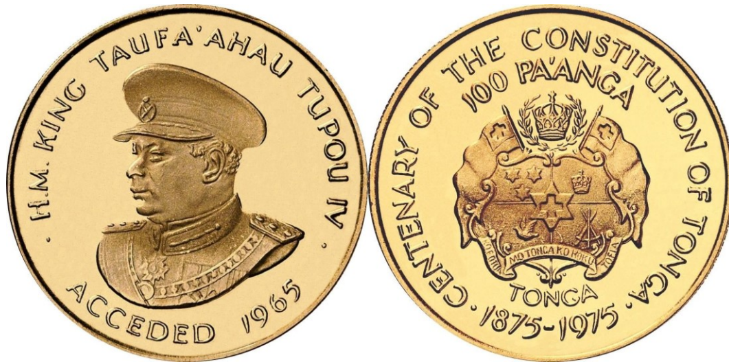
Kuva 3. Kuningas Taufa'ahau Tupou IV kuvattuna vuoden 1975 100 pa'angan kultarahassa.

Kuningas saattoi näin luottaa alueelliseen tukeen muilta valtionpäämiehiltä, koska myös he pelkäsivät, että mikä tahansa onnistunut libertaarinen kolonisaatio avaisi kymmeniä Lounais-Tyynenmeren riuottoja ja atolleja omistusvaatimuksille. Kysymys ulottui selvästi yhden kansan rajojen ulkopuolelle. Oseanian dekolonisoinnin edetessä kysymyksiä saariston alueellisista oikeuksista valtameren – joita ei koskaan käsitelty riittävästi varhaisissa YK:n merta koskevissa konferensseissa – nousi esiin, ja ne johtivat 1970-luvun aikana useiden saaristomääräysten kirjoittamiseen, jotka hyväksyttiin vuoden 1982 merioikeuskonferenssissa.