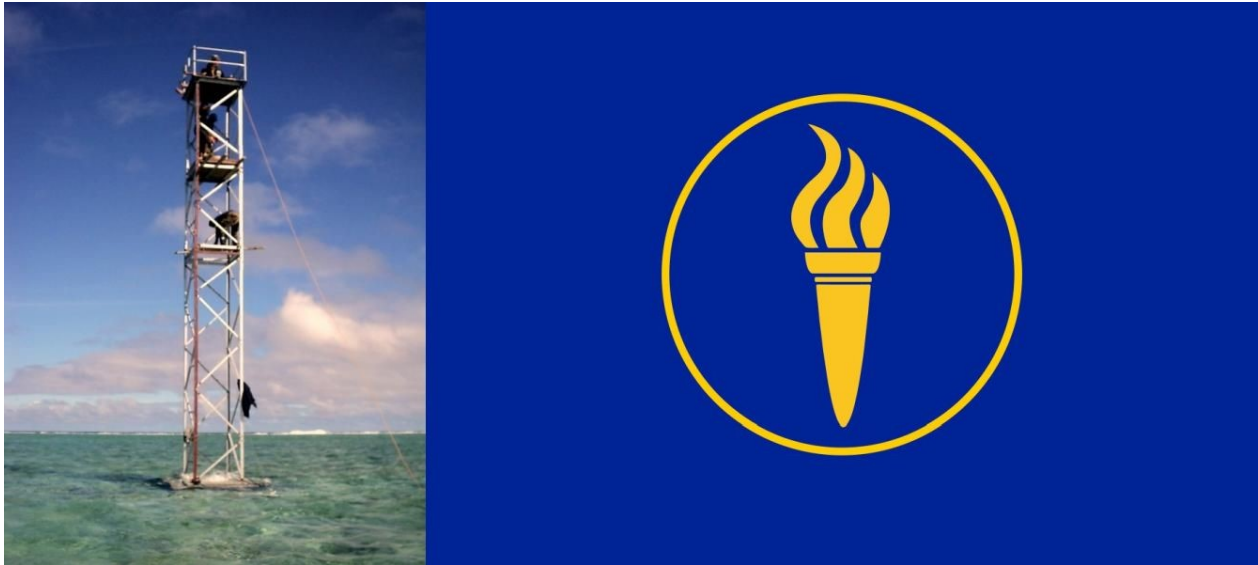
Kuva 2. Minervan tasavallan ainoa ”rakennus” eli 7-metrinen torni ja tasavallan lippu.

Tammikuun 19. päivänä 1972 Oliver julisti Minervan tasavallan itsenäiseksi valtioksi ja lupasi: ”Ihmiset saavat tehdä mitä haluavat. Mikään ei ole laitonta niin kauan kuin se ei loukkaa muiden oikeuksia. Jos kansalainen haluaa avata tavernan, perustaa uhkapelejä tai tehdä pornografisia elokuvia, hallitus ei puutu asiaan.” Valtion väliaikaiseksi presidentiksi nimettiin Morris. S. Davis ja sille määriteltiin oma lippu, kansallishymni, motto ja valuutta.