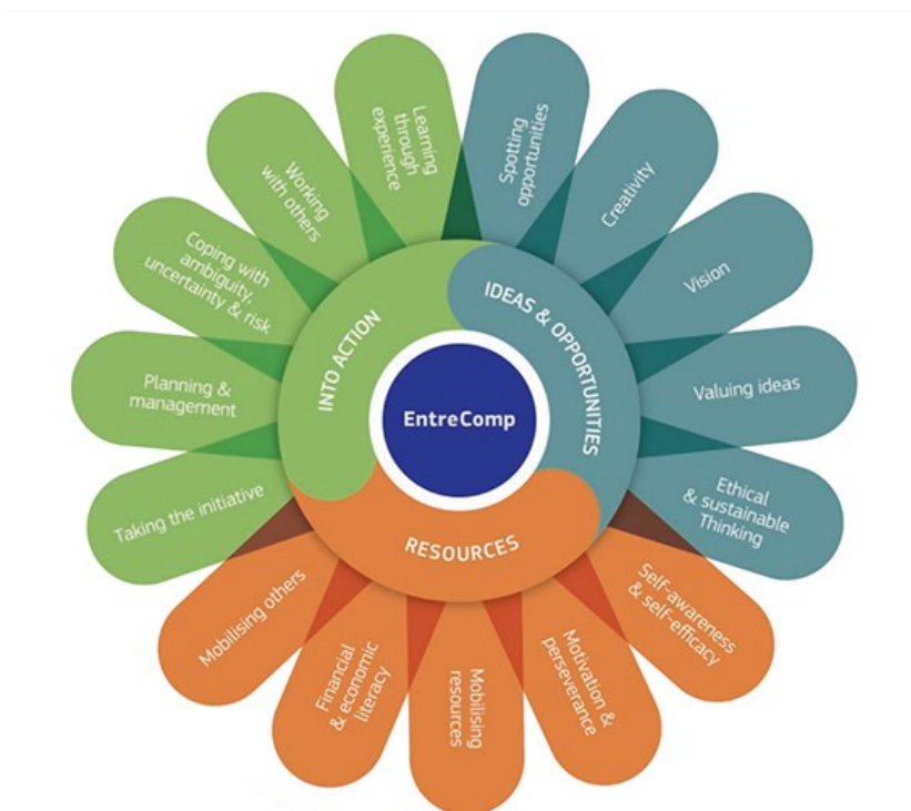
Kuva 1. EntreComp -mallin kolme osaamisaluetta ja niistä muodostuvat taidot (Vlaio 2020).

Euroopan komissio on kehittänyt EntreComp-viitekehysten (Entrepreneurship Competence Framework) yrittäjämäisen ajattelutavan selittämiseen. Työkalu kuvaa kattavasti tietoja, taitoja ja asenteita, joita yrittäjinä toimivat ihmiset tarvitsevat luodakseen taloudellista, kulttuurista tai sosiaalista arvoa ympärilleen. (European Commission 2018, 3.) EntreComp-viitekehysten luomisen keskeinen tavoite on ollut kehittää yhteinen käsite ja lähestymistapa, joka tukee yrittäjyyskasvatusta, -osaamisen sekä -ajattelutavan kehittämistä eri koulutusasteilla koko Euroopan laajuisesti (Bacigalupo ym. 2016, 5).