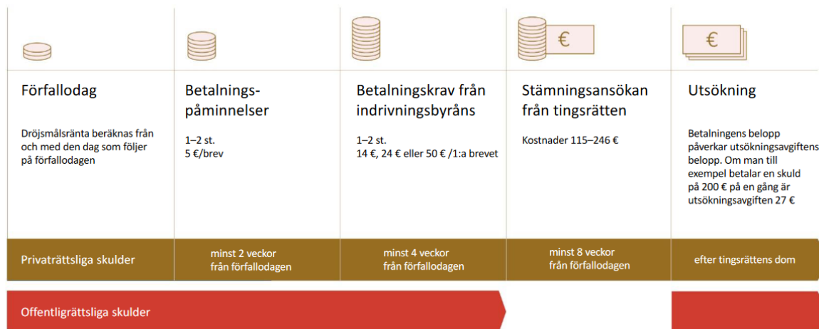
Figur 2. Indrivningsprocessen i Finland. (Indrivningsprocessen, 2022).

I nedanstående bild framkommer indrivningsprocess skeden samt de kostnader som uppstår i de olika indrivningsskeden.