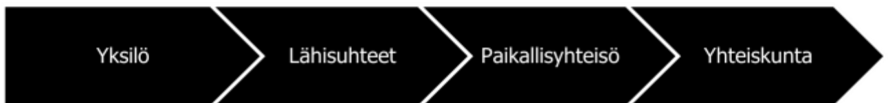
Kuva 2 Suojaavien tekijöiden muodostumista voidaan tarkastella neljän eri toimintatason kautta (Stakes 2006, 28-32).

toteuttaminen jatkuu myös alueellisella ja kunnallisella tasolla, joilla on vastuu ehkäisevän työn toteuttamisesta. Alueellinen ja kunnallinen politiikka toimii päihdehaittojen ehkäisyä tukena ja päättäjillä on mahdollisuus vaikuttaa myös ehkäisevän työn toteuttamiseen. (mt.,29.) Yhteiskunnallisella tasolla myös kansainvälisillä päätöksillä on vaikutusta Suomessa tapahtuvaan päihdehaittojen ehkäisytyöhön. Kansainväliset laillisten päihteiden asemaa ja kauppaa tai huumausaineiden kontrollia koskevat sopimukset vaikuttavat sääntelyyn myös Suomessa (mt., 28).