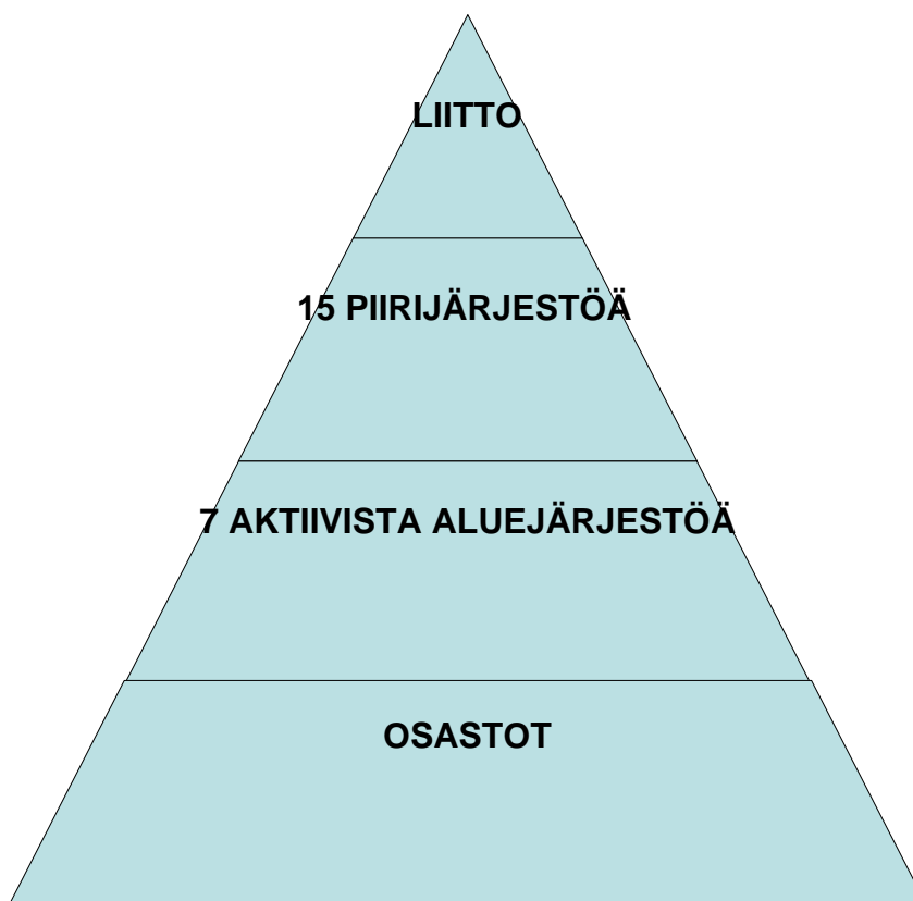
Kaavio 1. Nuorten Kotkien organisaatio

Lähimpänä ihmisiä, toimintaan osallistuvia lapsia ja heidän vanhempiaan Nuorissa Kotkissa ovat paikallisosastot, kuten Eurajoen Nuoret Kotkat, joka toimii Eurajoen kunnassa. (Kaavio 1) Osastojen pääasiallista toimintaa ovat kerhot, joita järjestetään lapsille ja nuorille ilta-aikaan. Kerhoilla saattaa olla tietty teema, mutta pääasiassa kerhot ovat harrastekerhoja, joissa askarrellaan, pelataan pelejä, leikitään ja puuhataan ryhmässä. Riippuen osaston koosta ja jäsenmäärästä osasto saattaa järjestää myös päivän kestäviä retkiä kylpylöihin tai kulttuuritapahtumiin sekä viikonloppuleirejä. Paikallisosaston on useimmissa tapauksissa perustanut SDP:n puolueosasto, mutta nykypäivänä puolueen osallistuminen osaston perustamiseen ei enää ole välttämätöntä.