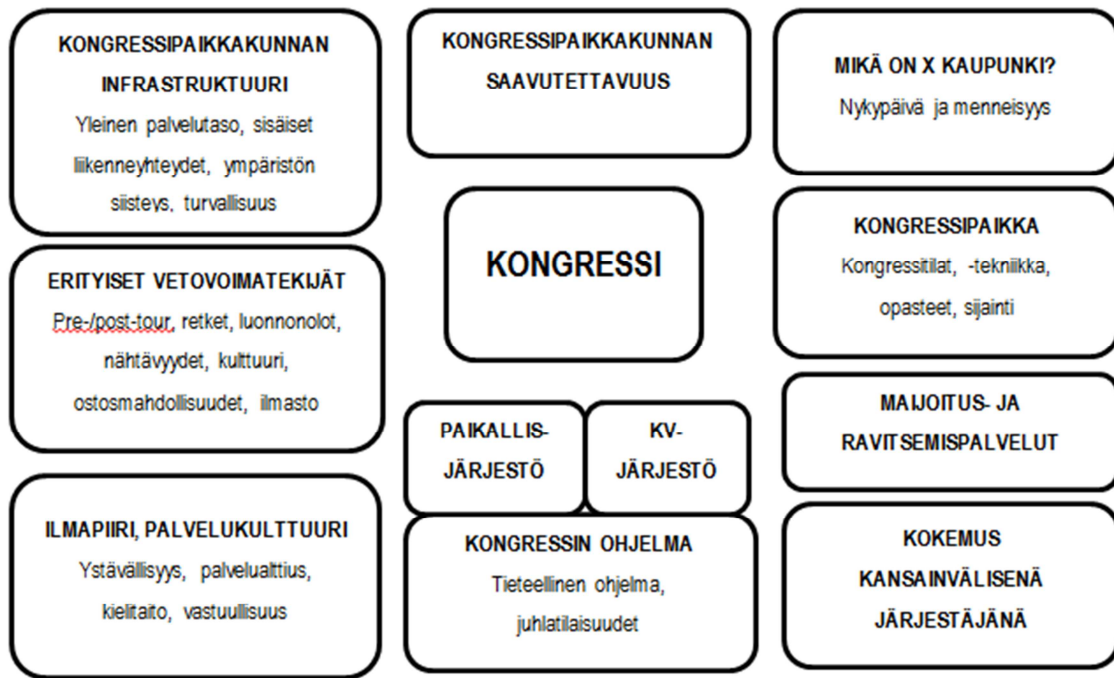
KUVIO 1 Kongressin onnistumiseen vaikuttavia tekijöitä (Rautiainen & Siiskonen 2013, 108)

Kansainväliset järjestökongressit pidetään vuorotellen eri jäsenmaissa ja niiden pitopaikka varmistetaan yleensä 1-4 vuotta ennen kongressia. Suuret maailmankongressit voidaan päättää jopa 10 vuotta etukäteen. Ajankohta kongressille on mietittävä tarkkaan jo kutsuvaiheessa kansainvälisten järjestöjen perinteiset kokousajat huomioiden. Sopivanlaiset kongressi-, näyttely- ja majoitustilat tulee varmistaa jo kutsuvaiheessa alustavilla varauksilla. (Rautiainen & Siiskonen 2013, 109.)