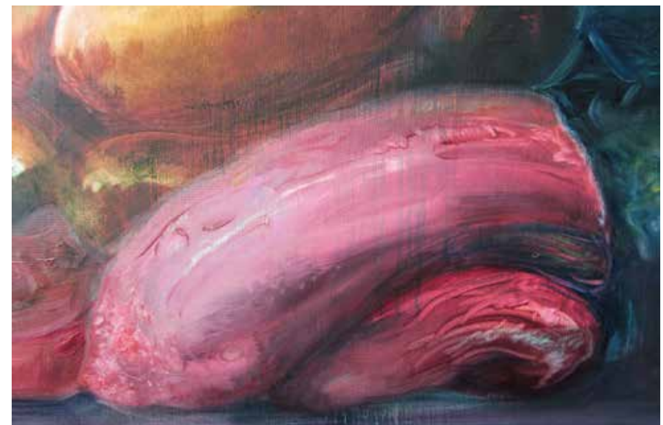
Kuva: Anne Alalantela ,Yksityiskohta teoksestani ”Paratiisi” 2013