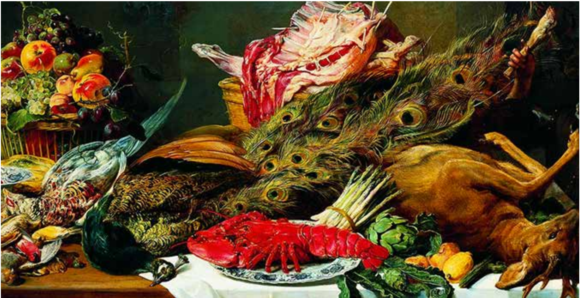
Kuva: Frans Snyders”Still - life with flesh” 1640

Lajin tunnistus on ainoa merkki yksilöllisyydestä, joka kuolleella eläimellä on vielä jäljellä. Se on jonkin eläinlajin edustaja – se on valkohäntäpeura, uros – tai riikinkukkouros. Se on pienikokoinen jänis osittaisessa talviturkissaan tai mustavalkolaikullinen porsas. Kun nämä lajityypilliset piirteet riisutaan, jäljelle jää liha - mysteeri.