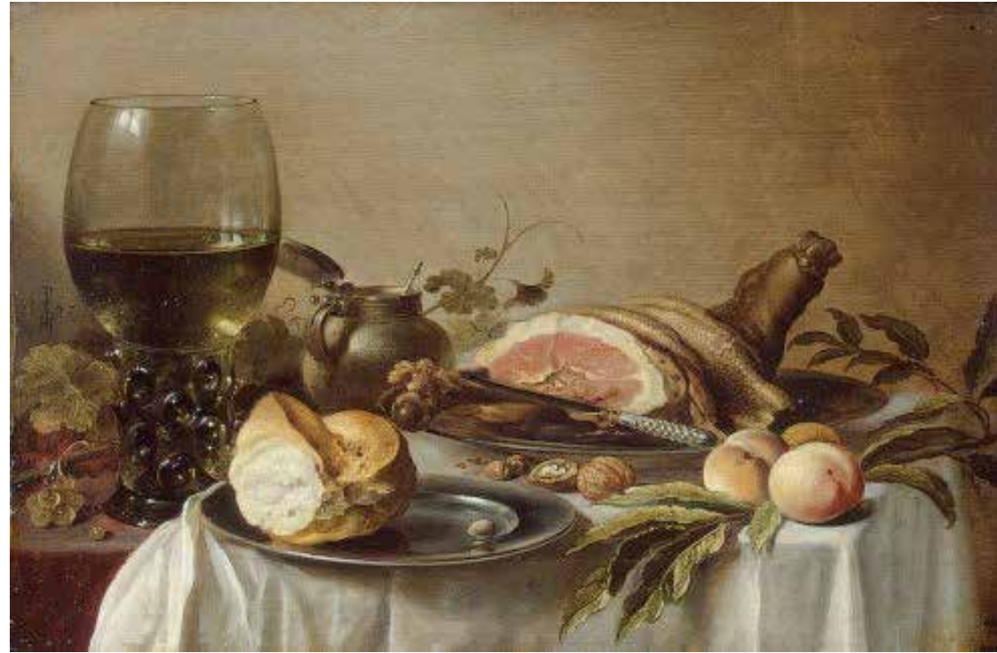
Kuva: Pieter Claetz, Breakfast with ham 1647

Myös sotien ja nälänhätien aikana taiteilija saattoi maalata kuin lohdutukseksi allegorian ruuasta, vaikkapa joesta täynnä kaloja ja joen jumalia – kun todellisuudessa joki oli ehtynyt.