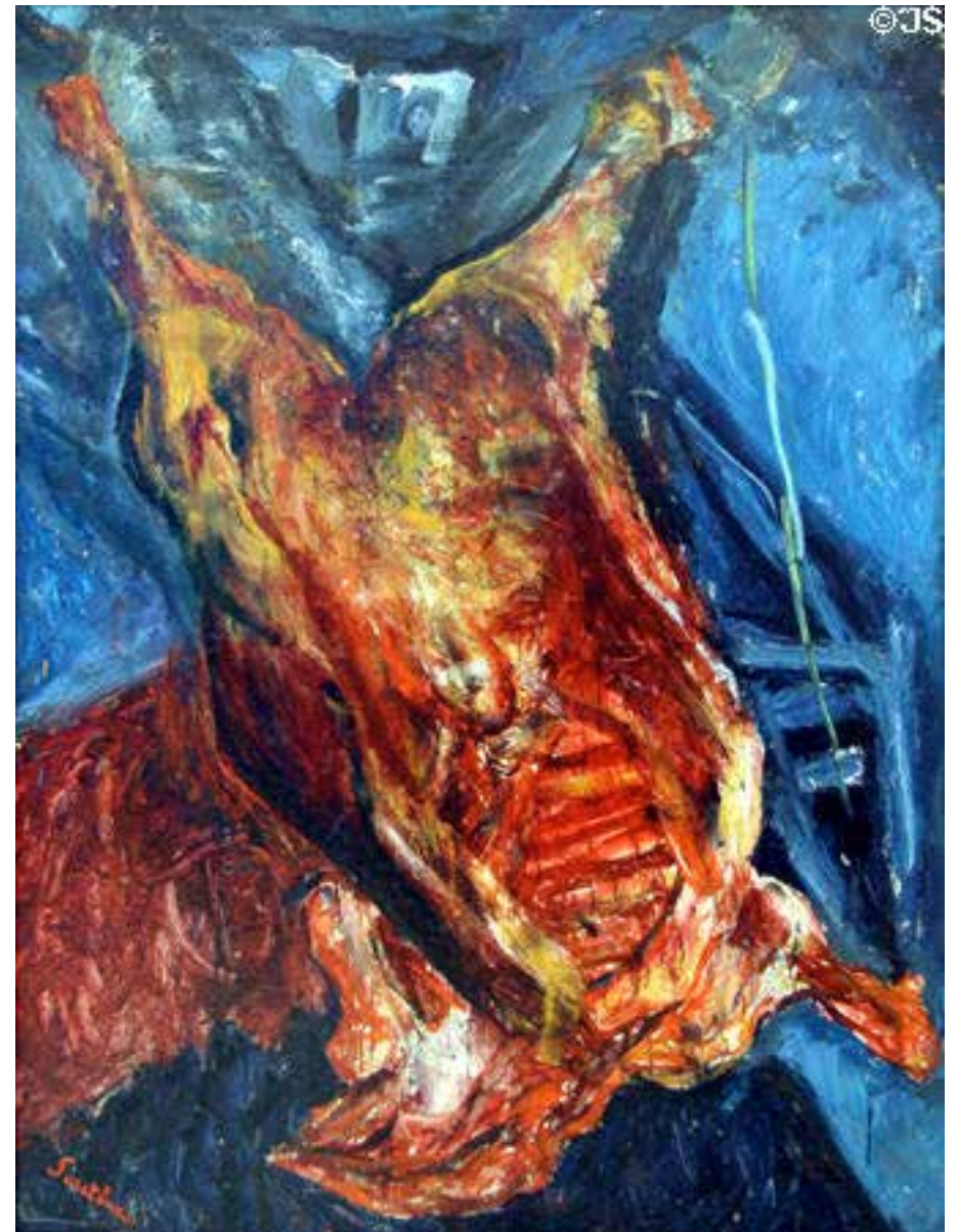
Kuva: Chaim Soutine "Carcass of beef" 1924