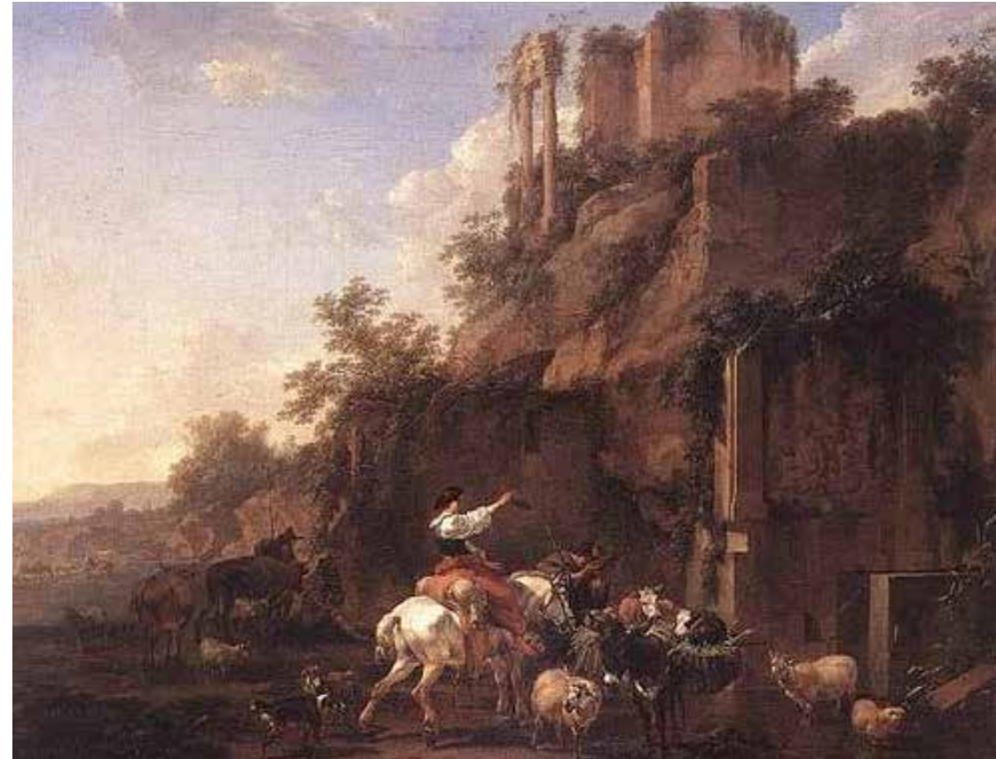
Kuva: Nicolas Berchem, Landscape with ancient ruins, 1657

ihmiset alkoivat nähdä kuvaukset maaseudusta ihanteellisena yhteytenä luontoon. Myös nykyihmisellä on tämä kaipuu. Sen voi havaita, vain muutamia esimerkkejä mainitakseni, lukuisista metsästys –mökkeily ja kalastusharrastuksista, lemmikkieläinten lisääntyneestä määrästä, luontovalokuvauksen suosiosta, ja ekologisten ja luonnonmukaisten tuotteiden kysynnästä. Suurin osa ihmisistä ei kuitenkaan kasvata tai metsästä ruokaansa itse, ja vieraantuu ruuan alkuperästä. Nykyaikana voi hyvinkin kaivata vanhojen maalausten luomaa ihannetta. Tieto eläinten oloista on lisääntynyt, ja monia perhetiloja mielessään visualisoinneelle kansalaisella tehdastuotanto-olosuhteet ovat hämmentäviä.