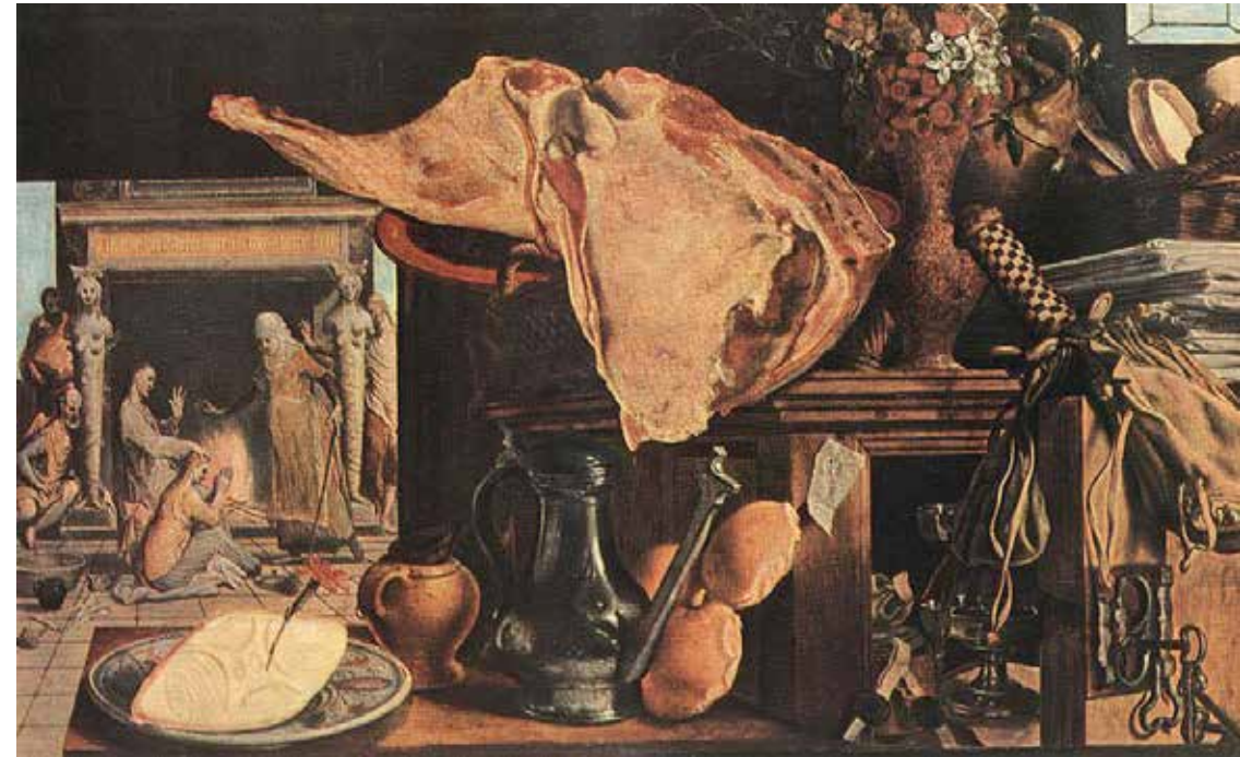
Kuva: Christ with Maria and Martha, Pieter Aertsen 1552

Ruuaksi tarkoitettuja eläimiä kuvattiin yleensä laumoissa tai osana ihmisen arkista toimintaa niiden kanssa; laidunnusta, ruhon nylkemistä, markkinoita ja ruuanlaittoa. Liha tai kala saattoi olla kuvassa myös korostamassa henkilön ammattia. Lemmikkieläimet kuvattiin enemmän yksilöinä omistajiensa vierellä. Lihaa ja metsästyssaaliita esittävässä asetelmissa kissat, koirat ja apinat ovat läsnä elävinä katsomassa kuolleita saaliseläimiä. Eläimet on jaoteltu samaan tapaan lemmikki – ja ruokaeläimiin, kuten nykyäänkin.