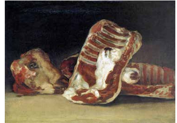
Goyan ”Butcher’s Counter” 1811-1812 on maalattu Madridin suuren nälänhädän vuonna. Maalaus on allegorinen ylistys ruualle, josta on puutetta. Tässä kuvassa eläin on puolitiessä matkallaan lihaksi, ja ruuaksi.

Frans Snyders maalasi riistaa 1500 – luvulla. Hän maalasi kokonaisia kauriita, joutsenia ja haukkoja - kaikkea millä oli kaunis turkki tai höyhenpuku. Pieter Aertsenin maalauksessa huomiota herättävin on irti leikattu naudan pää. Nykyajan asetelmamaalarille helpoin lihan hankintapaikka on valintamyymälä, tai suomalainen kauppahalli, jossa ”hurjin” eläimestä muistuttava osa on kieli, sorkka ja ehkä se pakastettu lampaan pää. Tietysti voisi soitella teurastamoihin ja maalata sitten kaikenlaisia osia, mitä heiltä olisi jäänyt ylitse. Opinnäytetyöni taiteellisessa osiossa se ei kuitenkaan ollut tarkoitukseni, vaan juuri vieraantuneisuuden korostaminen. Kaupunkilaisena voin syödä päivittäin lihaa, jonka kasvattamisesta ja eläimen olomuodosta on olemassa vain mielikuvia. Nämä mielikuvat luodaan ihmisille mainoksissa, aktivistien kampanjoissa ja muutamassa neutraalissa tietolähteessä, kuten tietokirjoissa tai youtube –videoissa, jotka on todennäköisesti tehty hälventämään kuluttajien epäilyksiä lihantuotannosta.