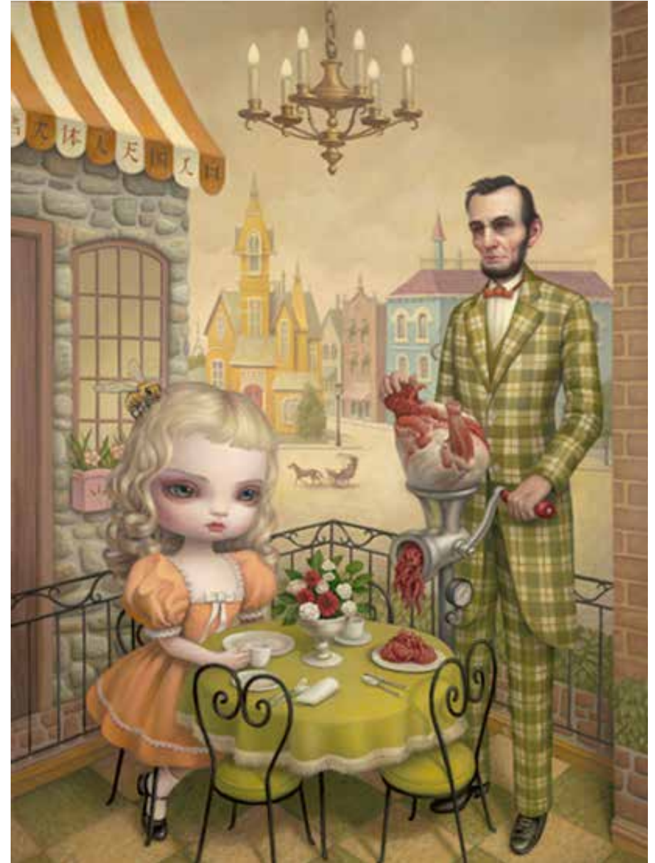
Kuva vasemmalla: Mark Ryden, The meat magi, 1997