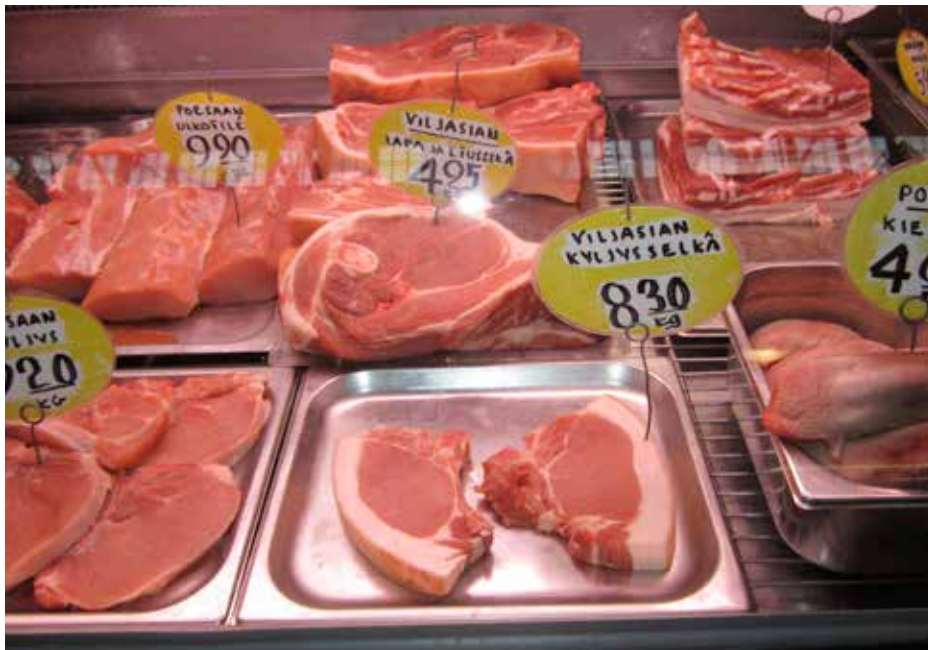
Kuva: Anne Alalantela/ Kauppahalli 2012

Osa lihan syömisen paradoksia on se että olemme ihmisinä itsekin lihaa. Juuri eläinten tappamisen hyväksyminen tuottaa ongelmia monille muutoin hyveisiin pyrkiville ihmisille. Siinä on moraalinen epäloogisuus, joka johdonmukaiselle ajattelijalle on kauhistus. Miten sellaista voi ratkaista? Riittääkö, että eläimen jonka syö, tietää eläneen hyvän elämän? Vai täytyykö eläinten syöminen lopettaa kokonaan? Opinnäytetyöni taiteellisen osan pääteoksessa "Paratiisi" näkyvillä on hyveellisen lihansyöjän paratiisi, jossa eläimiä ei tarvitse ajatella, koska eläimet on piilotettu. Ne on piilotettu samaan tapaan kuin klassisessa esimerkissä "virtahevosta olohuoneessa" eli kaikki tietävät jonkin asian olemassaolon, jonkin hieman vaikean, mutta juuri siksi että se on niin vaikea, siitä ei puhuta oikeilla nimillä, se piilotetaan kielessä, käytöksessä, kuvissa ja lihatskeillä.