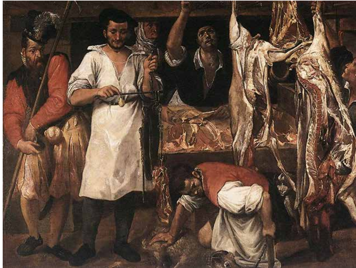
Kuva: Annibale carracci, "Butcher's shop" 1580

Artikkeli esittää erilaisia teorioita maalauksen merkityksestä ja symboliikasta. Taidehistorioitsijat ovat maalausta ja Carraccin elämäntarinaa tutkiessaan epäilleet että maalauksessa olevat teurastajat olisivat jopa hänen oman perheensä jäseniä, joiden työlle Annibale Carracci näin yrittäisi osoittaa kunnioitusta. Teurastajan ammatti oli ilmeisesti sen ajan Italiassa melko vähäarvoisena pidetty ammatti. Carraccin maalaukset olivat muutoin symboliikaltaan hyvin mietittyjä ja täynnä piilotettuja merkityksiä, sekä viittauksia kristilliseen kuvastoon. Esimerkiksi teurastajien vaatteet ovat puhtaan valkoiset, ja asennot arvokkaat, työhönsä keskittyneet. Artble:n artikkelin mukaan etualalle polvistunut teurastaja viittaisi asennollaan suoraan Raphaelin kaiverukseen "The sacrifice of Noah". Maalauksen irvailu kohdistuisi kirjoittajan mukaan taustalla liikkeessä asioiviin asiakkaisiin, herraan joka epäilevästi tuijottaa että liha punnitaan täsmälleen oikein, sekä vanhaan ahneesti katselemaan naiseen, joka sen ajan maalauksissa olisi yleisemminkin yhdistynyt assosiaatioihin kyltymättömydestä ja himosta.