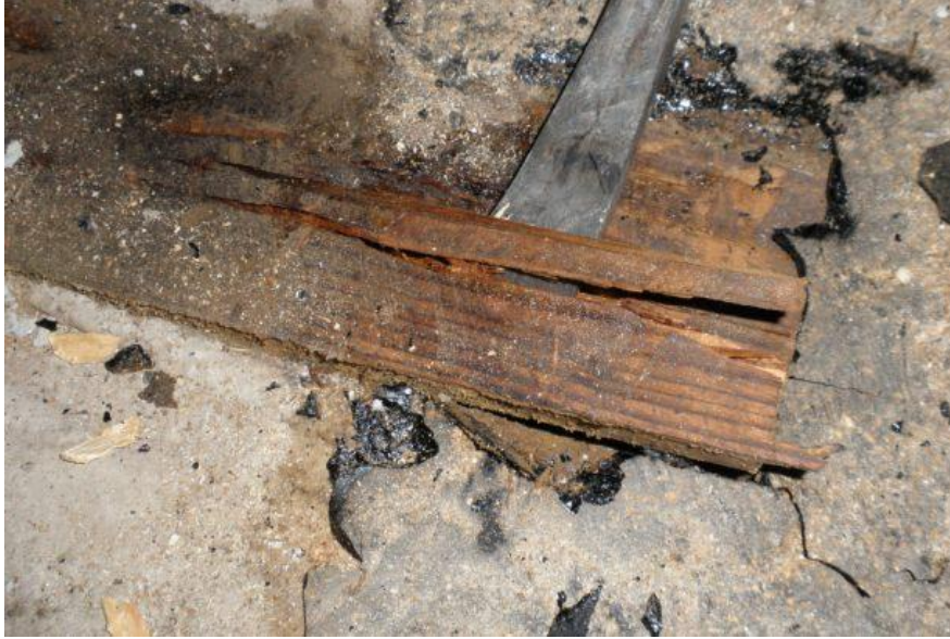
Kuva 5. Naulauspuut upotettu betonivaluun

Vesieristys oli tehty löytyneen rakennusselityksen mukaan alalaatan päälle bitumiliuossivelynä BIL 20/85b. Myös lattian pohjapuut oli käsitelty bitumisivelyllä. (6.) Lattian bitumi oli monin paikoin huonossa kunnossa. Puut olivat pahoin lahonneet alalaatan läpi maaperästä nousevan kosteuden takia. Seinärakenteet oli ajankohdalle tyypillisesti rakennettu lähtemään alalaatan päältä (kuva 6.). Rakennusratkaisuissa on toimittu sen ajan hyvän rakentamistavan mukaan ja noudatettu rakennusselityksessä (6.) ilmeneviä suunnitteluohjeita. Alalaatan bitumisivelyn tarkoitus oli katkaista kapillaarinen kosteuden nousu eristetilaan.