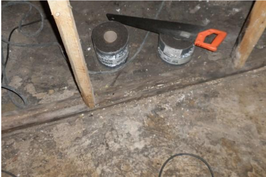
Kuva 6. Seinärakenne alkaa alalaatan päältä

Alasidepuut olivat lahoja, homeisia, aivan märkiä ja kellarin haju oli erittäin voimakas. Betonista valetut lattiaosuudet piikattiin kappaleiksi ja lohkat karrattiin betonijätteelle varatulle vaihtolavalle. Kaikki purkamisesta kertyneet jätteet lajiteltiin eri lavoille. Lattian purkutyön jälkeen suoritettiin huolellinen imurointi.