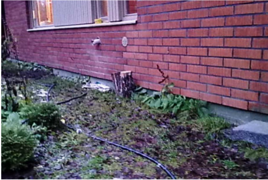
Kuva 2. Valesokkeliratkaisu ja kasvillisuutta perustusten vieressä

Ongelmat talossa alkoivat ilmetä loppukesällä 2011, kun asukkaiden huomio kiinnittyi WC-tilassa kuuluvaan suhisevaan ääneen. Tutkittaessa ilmeni, että kattilahuoneessa sijaitseva vesipumppu lähti aika-ajoin käyntiin vaikka veden kulutusta ei ollut päällä. Pumppu täytti painesäiliön aina, kun se oli tyhjentyt tarpeeksi. Johtopäätös oli, että kyseessä on rikkoutuneen vesijohdon aiheuttama vuoto. Äänilähde paikantui Itä-Suomen Rakennuskuivaus Oy:n kosteusmittausten jälkeen putkirikoksi WC:n alapohjan betonilaattojen välisessä eristetilassa. Kosteudenmittaaja ohjeisti avaamaan WC-tilan lattian, jonka jälkeen voitiin todeta kosteusvaurion aiheuttaja.