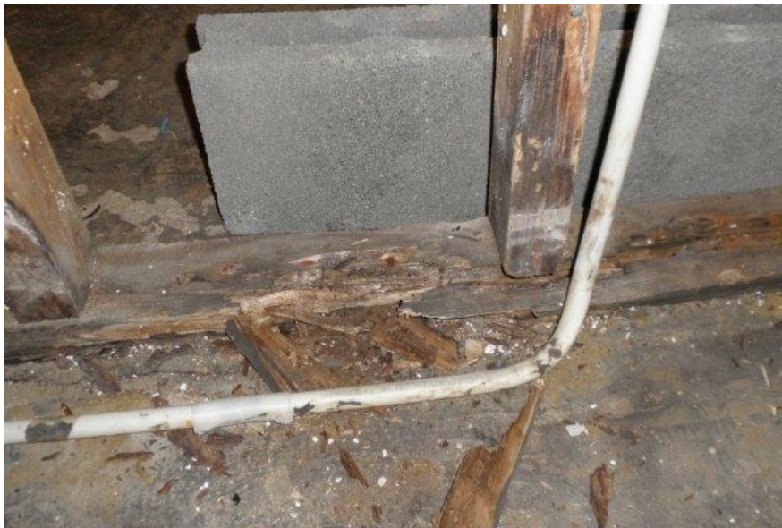
Kuva 4. Lahonnut alasidepuu ja seinärunko

Purkaminen aloitettiin makuuhuoneesta, jotta nähtiin alapohjan tilanne ja voitiin päättää, miten korjaus toteutetaan. Lattia avattiin, ja voitiin todeta, että ei ole mitään mahdollisuutta tehdä korjaustyötä, jos talossa asutaan. Lattian alta tuli niin voimakas kellarin haju, että asuminen talossa olisi jo terveyden kannalta vaarallista. Puretun lattian alalaatan päältä lähtevät väliseinät olivat lahonneet alasidepuun ja seinärungon alapään osalta (kuva 4.).