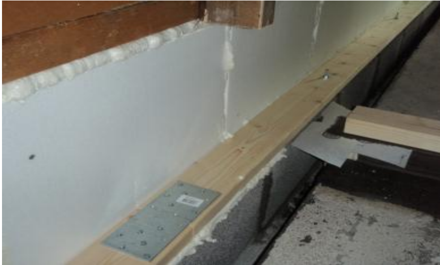
Kuva 8. Alaohjauspuun kiinnitys harkkoon

Sisäpuolen tiiliseinärakenne (kuva 9.), joka alkaa alalaatan tasosta, joudutaan avaamaan tulevan lattiapinnan tasoon ja tukemaan hyvin niin, että yläpuoliset tiilet holvaantuvat eivätkä sorru. Korjaustyössä voidaan soveltaa lamellointitekniikkaa, jossa puretaan kerralla vain esimerkiksi kahden harkon mittainen alue, joka korjataan ja korjauksen jälkeen voidaan tehdä sama toimenpide seuraavalle seinän osuudelle. Näin voidaan estää yläpuolisen tiilimuurauksen vaurioituminen. (15.)