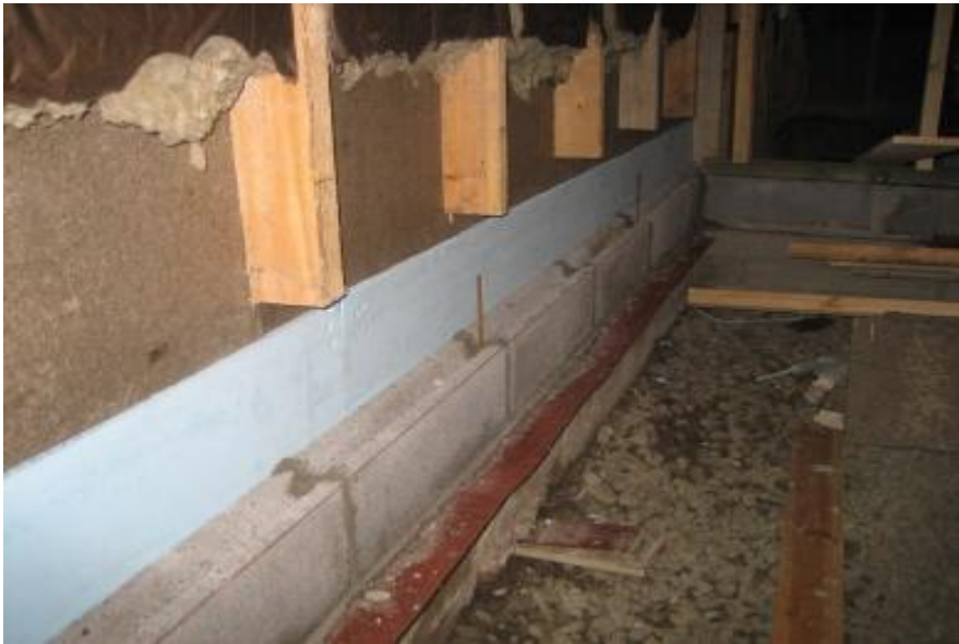
Kuva 7. Harkkojen väliin injektoidut kierretangot alasidepuun kiinnitystä varten

kermiä. Sokkeliin injektoidaan kemiallisella ankkurilla (esimerkiksi HILTI HIT-HY 150 tai vastaava) alasidepuun kiinnitystä varten 10 millimetrin vahvuiset kierretangot (kuva 7.), joiden mitoitus keskeltä keskelle on 1200 millimetriä. (14, 23–26.) Kierretangot mitoitetaan harkkojen saumaan. Kierretankojen pituuden tulee olla 20 millimetriä yli harkkojen päälle asennettavan alaohjauspuun yläpinnan.