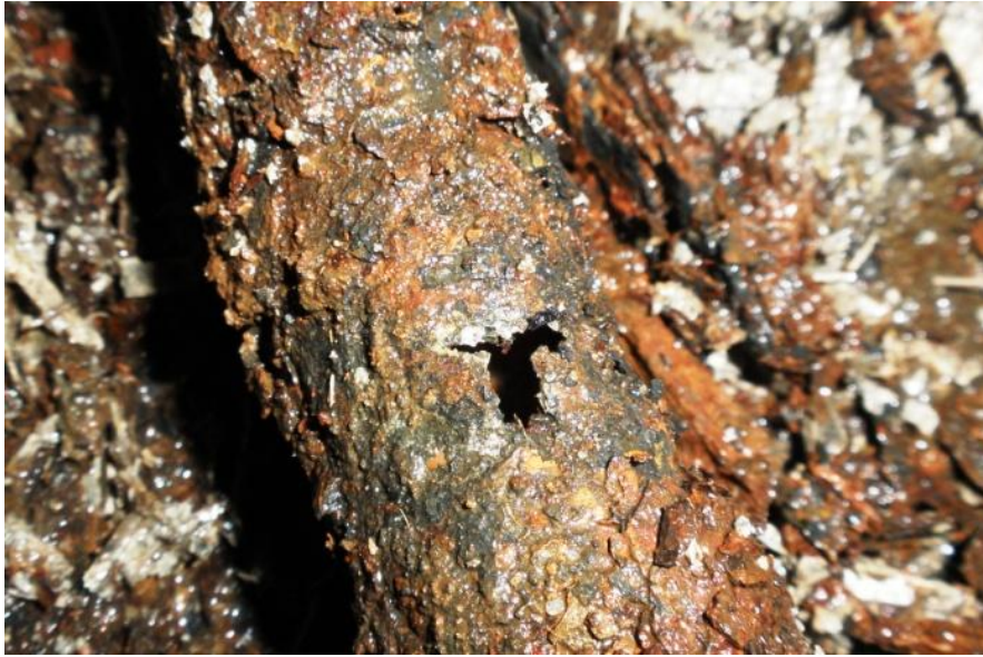
Kuva 3. Korroosion syövyttämä vesijohtoputki

Tässä työssä rajataan kosteusmittaukset ja mittaustulosten raportit sekä rakenteiden pintakäsittelyt pois. Työssä keskitytään rakennuksen vaurioihin ja rakenteiden korjausmenetelmiin.