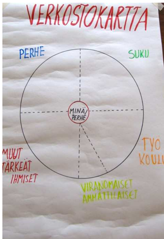
Kuva 5. Verkostokarttamalli ( Sosiaaliportti)

Harjoituksen idea oli saada ryhmäläiset kartoittamaan nykyhetken ihmissuhdeverkostoja, joiden kanssa ovat tekemisissä. Verkostokartan tarkoituksena oli tehdä näkyväksi sosiaalinen verkosto selkeällä ja helpolla tavalla.