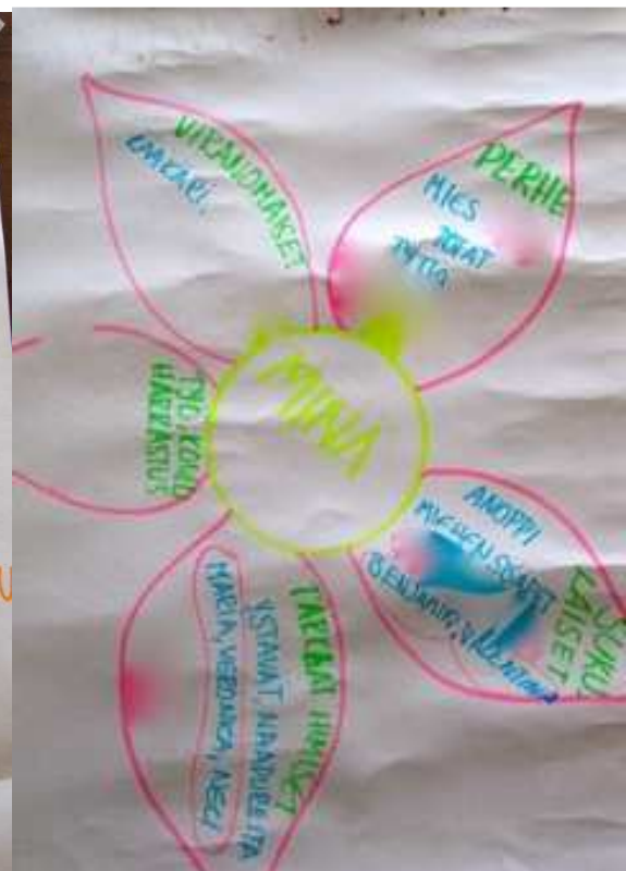
Kuva 6. Ryhmäläisen piirtämä oma verkostokartta