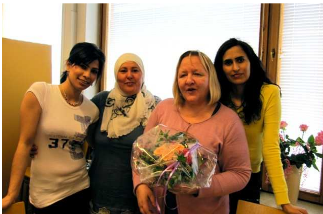
Kuva 8. Asukastalo Ankkurin toiminnanjohtaja, ryhmäläinen ja ryhmän ohjaajat