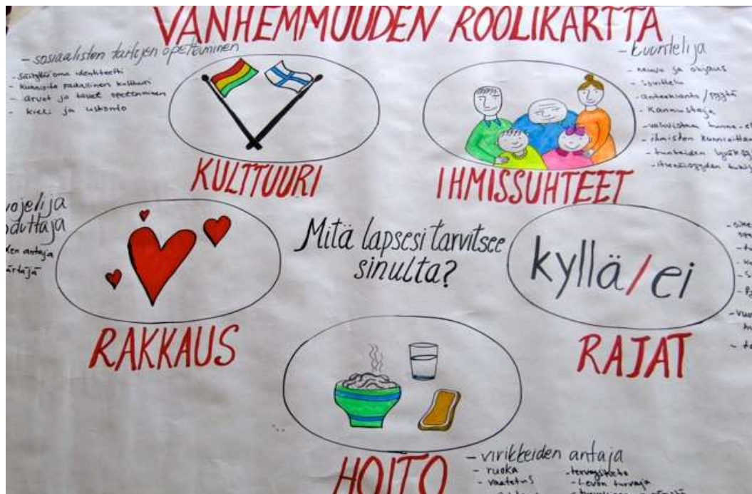
Kuva 3. Vanhemmuuden roolikartan selkoversio maahanmuuttajille

Tuokion tarkoitus oli saada ryhmäläiset pohtimaan erilaisissa vanhemmuuteen kuuluvia rooleja. Ryhmässä pohtiminen avulla saatiin erilaisia näkökulmia ja näkemyksiä aiheesta. Vanhemmuuden roolikartan käyttäminen aktiviteetissa antoi ryhmäläisille mahdollisuuden keskustella itselle vaikeistakin asioista ja jakaa niitä muiden naisten kanssa vanhempina.