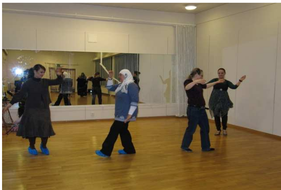
Kuva 7. Tanssituokio

sekä ryhmänä että jokaista henkilökohtaisesti. Annoimme ryhmäläisille kiitosruusut osallistumisesta järjestämäämme vertaistukiryhmätoimintaan.