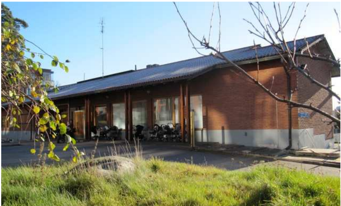
Kuva 1. Herttoniemenrannan Asukastalo Ankkuri

Jäsenenä voi olla yhdistyksen toiminta-alueella toimiva tai vaikuttava yksityinen henkilö, oikeuskelpoinen yhtiö tai säätiö. ( Emt. 2010.)