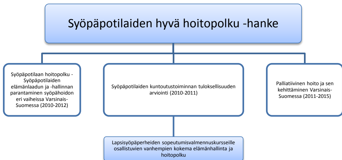
Kuvio 1. Kehittämiprojektin sijoittuminen hankkeeseen.

Lounais-Suomen Syöpäyhdistys (LSSY) ja Turun ammattikorkeakoulu ovat laa- tineet yhteistyösopimuksen, jonka tavoitteena on edistää yhteistyön eri muotoja ja saavuttaa molempia osapuolia hyödyttäviä toiminnallisia tavoitteita. Vuosille 2010 -2015 on laadittu Syöpäpotilaiden hyvä hoitopolku -hanke, jonka osapro- jektiin "Syöpäpotilaiden kuntoutustoiminnan tuloksellisuuden arviointi (2010- 2011)" Lapsisyöpäperheiden sopeutumisvalmennuskursseille osallistuvien van- hempien kokema elämänhallinta ja hoitopolku -projekti kuuluu (Kuvio 1).