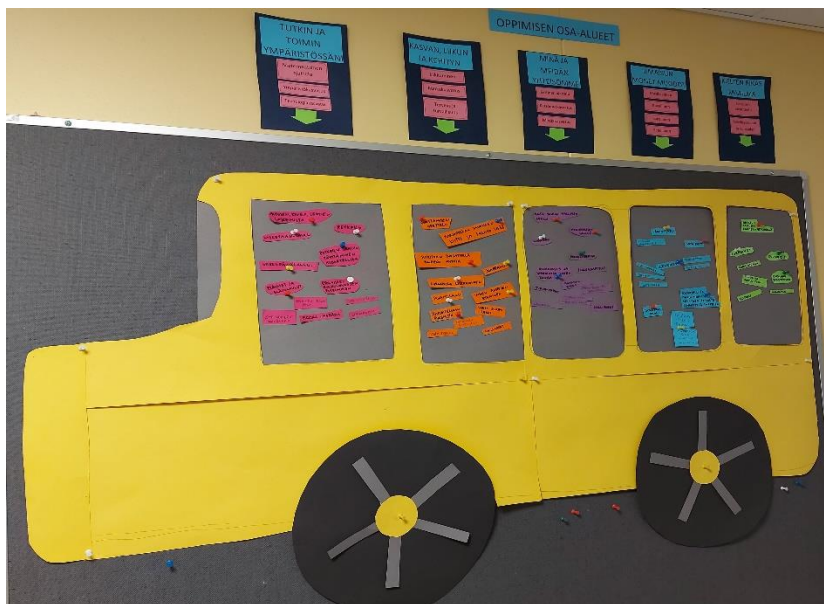
Kuvio 7: Vasuseinä

Olen erittäin aktiivinen kuvaaja ja otankin paljon videokuvaa ja kuvia lapsista, joita jaan vanhemmille viikoittain yhdessä kirjoituksen kanssa, jossa kerron viikkomme kulusta ja tapahtuneista asioista. Laitan kirjoituksiin myös yhdestä viikonaikana tehdystä tai huomioidusta asiasta pedagogista tietoa, jossa avaan toiminnan tarkoitusta vanhemmille. Olen myös jakanut soitto-listojamme ja kuvia ryhmämme uusista leikeistä ja sisustuksesta vanhemmille. Olemme pitäneet lasten kanssa Live-tuokion, jonka aikana olemme soittaneet vanhemmille musiikkia. Live-tuokiosta ilmoitimme vanhemmille käyttämällämme sivustolla, että vanhemmat saavat tulla median välityksellä seuraamaan tekemisiämme.