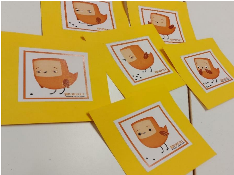
Kuvio 4: Pikkuli tunnekortit

Tämän päätteeksi leikimme yhdessä jonkun leikin, luemme kirjaa tai teemme jotain muuta, mikä liittyy sen päivän Pikkuli aiheeseen. Suunnitellessani Pikkuli toimintaa pohdin silloin, miten yhdistän toiminnan kielenkehittämiseen, kun toiminta painottuu sisällöllisesti muiden taitojen kehittämiseen. Kieli kehittyy lapselle kuuntelemalla, toistamalla, mallintamalla ja vuorovaikutustilanteissa, joten kaikki toiminta, jota teemme kerhossa vahvistaa kielenkehittämistä rohkaisemalla ja kannustamalla lapsia käyttämään kieltään.