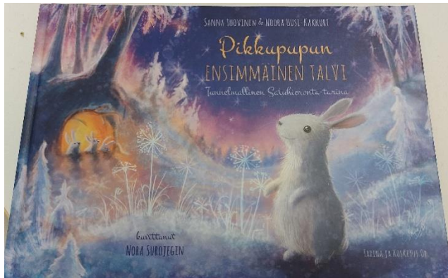
Kuvio 6: Pikku Pupun ensimmäinen talvi- tunnelmallinen satuhierontakirja

Satuhieronta on minulle uusi konsepti, josta olen kuullut, mutta en ollut toteuttanut sitä aikaisemmin. Satuhieronnalla voidaan tukea rentoutumista ja sosiaalisten taitojen oppimista. Tärkeimmät asiat, jotka koen meidän ryhmänä voivan saavuttavan satuhieronnalla on aikuisen läsnäolo ja jakamaton huomio lapselle satuhieronnassa. Tällä voimme tukea lasten turvallisuuden tunnetta, itsetuntoa ja stressinhallintaa. Tilasin tätä varten Pikkupupun ensimmäinen talvi-tunnelmallinen satuhierontakirjan.