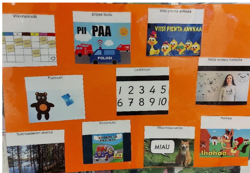
Kuvio 3: Laulutaulu

Tänään kokeilemme uuden laulutaulun käyttöä ja pohdimme sille mahdollisia lisäominaisuuksia ja toimintatapoja sekä sen toimivuutta lasten osallisuuden lisäämisessä. S2-lapset, jotka aiemmin ovat jääneet hieman syrjään laulujen valinnassa ymmärsivät laulutaulun idean heti. He innoissaan näyttivät laulun kuvaa, jonka halusivat kuulla. Huomasin lauluhetken aikana, että S2-lapset tuntuivat olevan enemmän mukana lauluissa ja osallistuivat enemmän, minkä voisin kuvitella johtuvan siitä, että he olivat päässeet myös vaikuttamaan laulettaviin lauluihin enemmän.