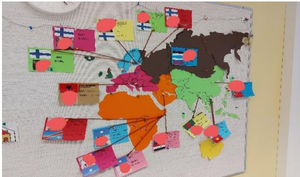
Kuvio 2: Maailmankartta

Olen tämän viikon aikana tutustunut lasten eri uskontoihin ja kulttuureihin perusteellisemmin. Ryhmäämme on valmistunut maailmankartta, jossa jokaisen lapsen uskonto, kieli ja kotimaa. Tämän lisäksi olen etsinyt tietoa katsomuksista ja kulttuureista Juhlakalenteri (2020) ja Kulttuurin vuosikello (2020) sivuilta. Näiden kautta löysin Espoon kaupungin tekemän kulttuurien juhlakalenteri julisteen, jossa on kerrottu kaikki meidän lasten uskontojen/kulttuurien tärkeät juhlat (Kulttuurien juhlakalenteri 2020). Otamme tämän käyttöömme ryhmämme seinälle ja voimme käyttää sitä hyödyksi toimintamme suunnittelussa.