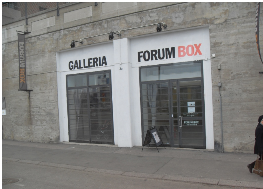
Forum Box fasad

(Intervju med Nina Toppila & Forum Box Internetsidor)