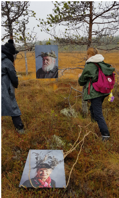
Kuva 1. Risukruunutaidetta Jättiläissaarella.

"Päivärytmi on parempi nykyään, jokapäiväiset askareet onnistuvat paremmin kuin ennen työpajajaksoa"