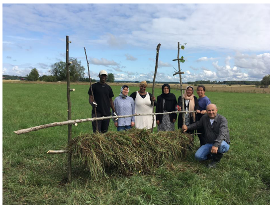
Kuva 2. Gröna Gångenin osallistujia maatilalla.

Maatilalla työskentelyn lisäksi Gröna Gången -hankkeessa tehtiin osallistujien kanssa metsäkä-