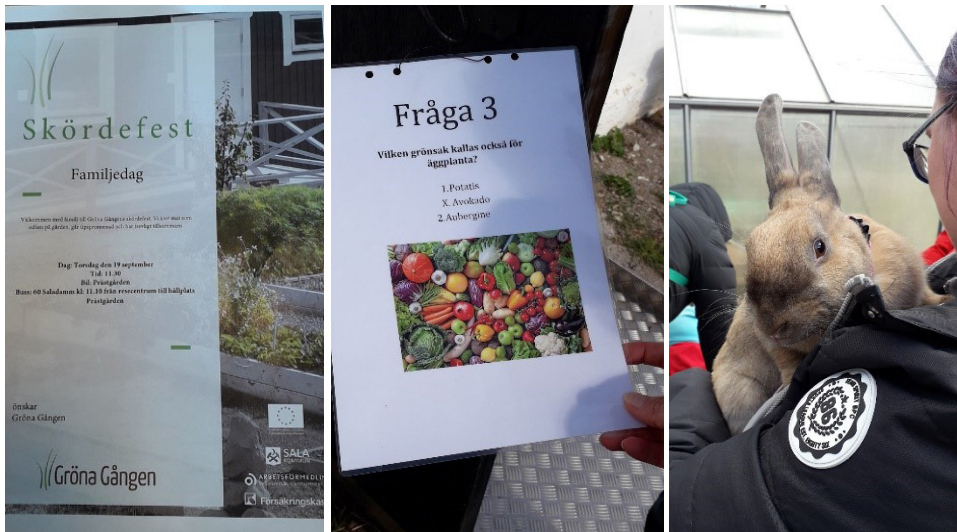
Kuvat 10-12. Sadenkorjuujuhlat Salan maatilalla (Johanna Rintala)

Osallistuimme maatilalla sadonkorjuujuhliin, jossa mukana oli hankkeen osallistujia ja hanketyöntekijöitä, kuntoutujien perheenjäseniä sekä kunnan virkamiehiä. Iltapäivän aikana ohjelmassa oli tietovisa maatilalla eläimiin ja eri viljelykasveihin liittyen. Saimme nauttia tilan tuotteista valmistettua juhlaruokaa ja käydä antoisia keskusteluita osallistujien kanssa välittömässä ja lämminhenkisessä ilmapiirissä.