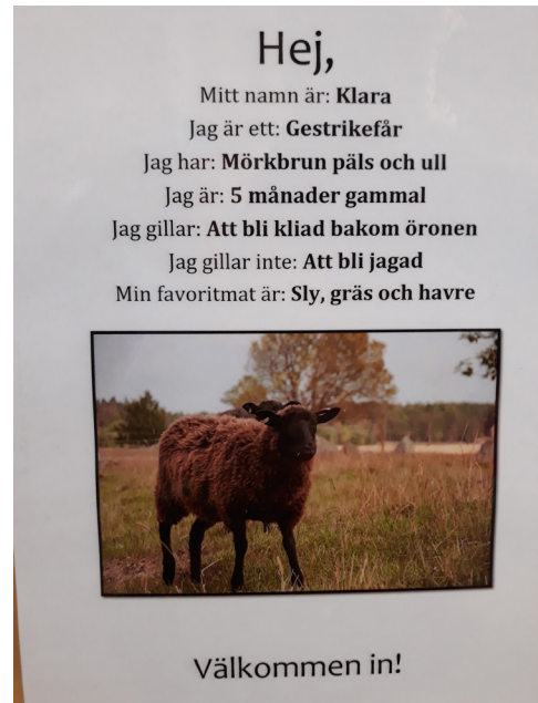
Kuva 4. Eläimen esittely (Arja Jääskeläinen)

Se, että Gröna Gången -hankkeen kuntoutustoiminnassa yhdistettiin luontoperustaista kuntoutustoimintaa sekä yhteiskunta- ja terveystietoutta sekä maahanmuuttajilla kielen opetusta, on hanketyöntekijöiden mielestä kokonaisuutena toimiva ja vaikuttava menetelmä. Tästä huolimatta tällainen kuntoutustoiminta ei tule jatkuamaan Salan kunnassa sen kalleuden vuoksi. Ainoastaan joitakin menetelmiä, kuten suggestopediaa, tullaan jatkossa käyttämään. Salan kunnassa etsitään kuitenkin ratkaisuja, miten luontoperustaista kuntoutustoimintaa voitaisiin jatkaa. Yhteistyö-