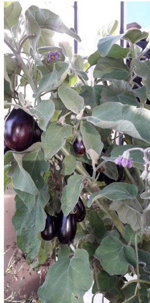
Kuvat 13-15. Maatilan elämää ja puutarhan satoa Salassa. (Johanna Rintala)