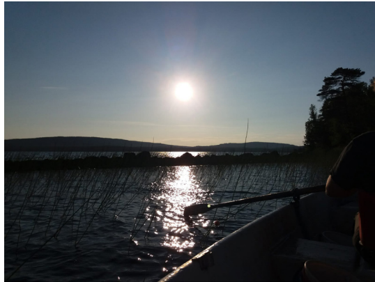
Kuva 18. Ravustusta Pellossa. (Kullervo Linna)

Asiat, jotka jäivät pohdituttamaan olivat, miten luonnon monimuotoisuuden varjeleminen näkyi heidän maatilatoiminnassa, sekä Salan kunnan ja hanketyöntekijöiden välisen yhteistyön organisoituminen hankkeessa.