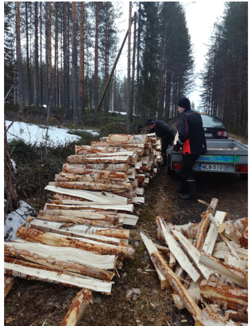
Kuva 19. Halonhakkuuhomia