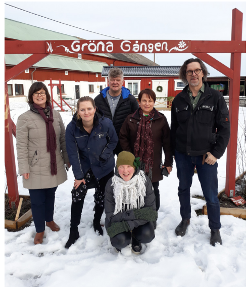
Kuva 6. Tutustumismatkalla Gröna Gångenin luona helmikuussa 2019

Tutustumismatkalla Pellon kunnan hanketyöntekijä esitteli tulevaa Pellon Orhinselässä pidettävää leiriä. Leirin tavoitteena oli koota kaikki Luontoa toimintaan -hankkeen osatoteuttajat ja yhteistyökumppanit, sekä hankkeen osallistujat yhteiseen luontoleiriin. Myös ruotsalaisten oli tarkoitus osallistua leiriin ja tutustumismatkalla tehtiinkin siihen liittyviä suunnitelmia. Yhteistyön tavoitteena oli, että molemmat hankkeet tekisivät kaksi benchmarkkausmatkaa toistensa luokse, jolloin pääsisimme konkreettisesti tutustumaan hankkeiden toimintaan ja tuloksiin sekä järjestämään kehittämistyöpajoja. Kevään 2019 tutustumismatkalla kerrottiin Luontoa elämään -hankkeessa kehitetystä yksilökeskeisestä luontotoiminnan suunnittelusta sekä osallisuutta vahvistavasta luontoon