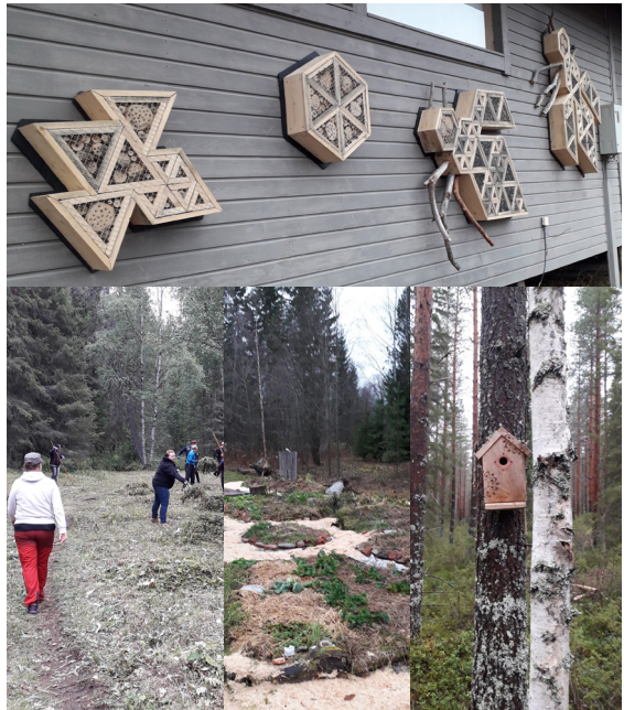
Kuvakollaasi 1. Luontoa toimintaan kuntouttavaa toimintaa.