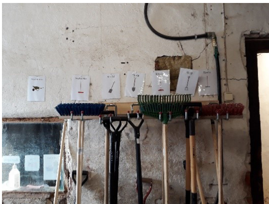
Kuva 3. Työkaluja nimikyltein. (Gröna Gången -hanke) (Pia Rajaniemi)