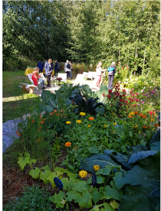
Kuva 17. Oulun nuorten työpajan permapuutarha.

Pajatoimintaan osallistuu myös nuoria, jotka ovat opiskelemassa toisella asteella, mutta tarvitsevat opintojensa yksilöllisempää tukea. Työpajatoiminnassa vahvistetaan valmennuksen ja merkityksellisten tekemisten kautta osallistujien elämänhallintaa sekä opiskelu- ja työelämävalmiuksia. Työpajatoiminta on kokonaisvaltaista tukea, ohjausta ja valmennusta, joka tapahtuu pienissä eri ammattialaa edustavissa toimintayksiköissä. Yhteistyötä tehdään muiden Oulun kaupungin toimijoiden ja alueen palvelutuottajien (Esim. Hyve, Työllisyys, Te-palvelut, Byströmin Ohjaamo, Kela) ja koulutuksen järjestäjien kanssa. Yhteistyötä tehdään myös muiden työnantajien kanssa. Nuorten kanssa tehtävässä työssä yhteistyö muiden nuoren verkostojen kanssa on keskeistä.