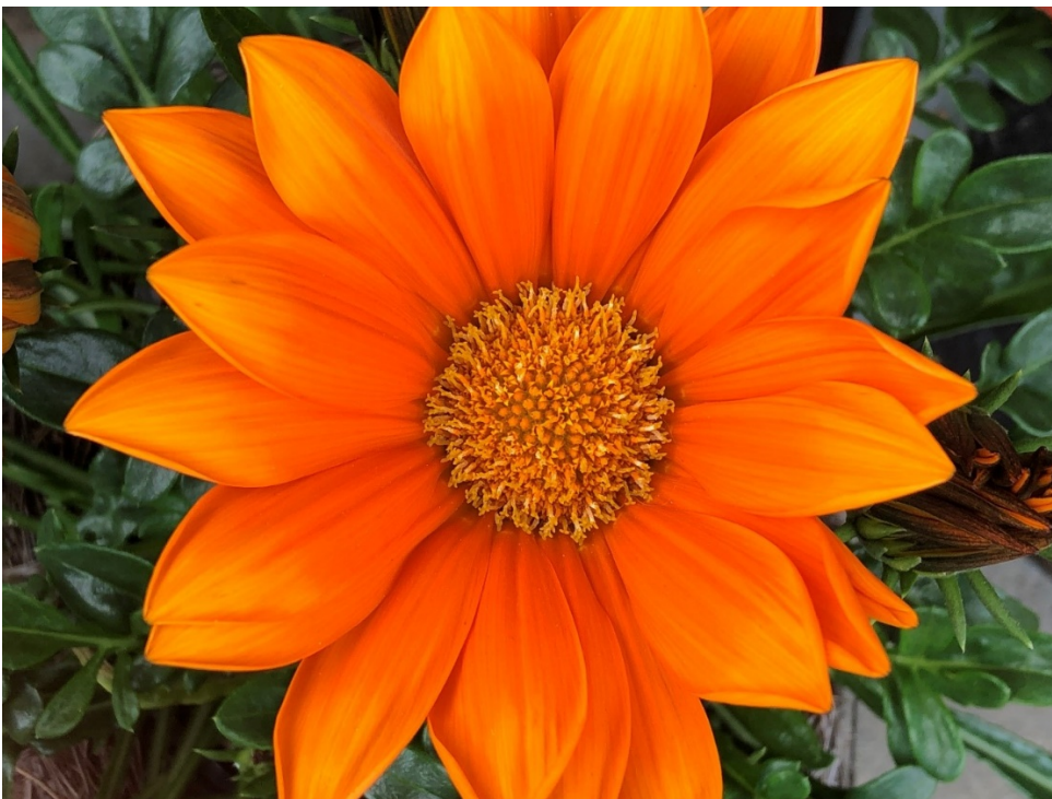
KUVA 1. Timanttista

Valtakunnallisessa UOMA – Uraa ja osaamista korkeasti koulutetuille maahanmuuttajille - hankkeessa tarjottiin suomea toisena kielenä puhuville sosiaalialan lisäkoulutusta, jossa suomen kielen oppiminen integroitiin sosiaalialan sisältöihin. Oulun ammattikorkeakoulussa sosiaalialan lisäkoulutus toteutui opintojen aikaisen työn ja opintojen yhdistämisenä eli työn opinnollistamisena. Sosiaalialan työ tai harjoittelu ja suomen kielen kehittäminen sulautuivat sosiaalialan opintoihin. Lisäkoulutus on kiinnitetty sosiaalialan tutkinto-ohjelman opetussuunnitelmaan.