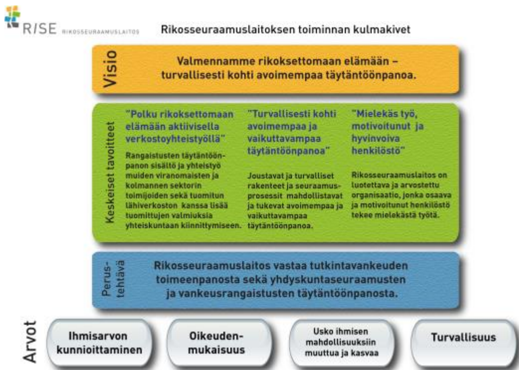
Kuva 1 Rikosseuraamuslaitoksen toiminnan kulmakivet (Rikosseuraamuslaitos 2019).

Rikosseuraamuslaitoksen yksi strategioista (Kuva 1) vuodelle 2020-2023 on yhteiskunnallinen vaikuttavuustavoite, jossa valmennetaan kohti rikoksettomampaa elämää ja näin kohti avoimempaa täytöntöönpanoa. Rikosseuraamuslaitoksen strategia on laadittu neljälle vuodelle, joiden aikana pyritään muun muassa valmentamaan kohti aiemmin mainittua rikoksetonta elämää, huolehtimaan turvallisuudesta rangaistusten täytöntöönpanoissa sekä edistämään yhteiskunnan turvallisuutta ja toteuttamaan toiminnassa oikeusturvaa ja yhdenmukaista kohtelua. (Rikosseuraamuslaitos 2019a) Rikosseuraamuslaitos on luonut toimenpide listauksen saavuttaakseen tämän yhteiskunnallisen tavoitteen vuosien 2020-2023 aikana. Toimenpiteisiin kuuluu muun muassa väkivaltaisen radikalisoitumisen sekä jengirikollisuuden ehkäiseminen, oikeudellisen ohjauksen ja laillisuusvalvonnan tehostus, sekä asiakkaiden tarpeita vastaavien palveluiden ja jatkumoiden kehittäminen.