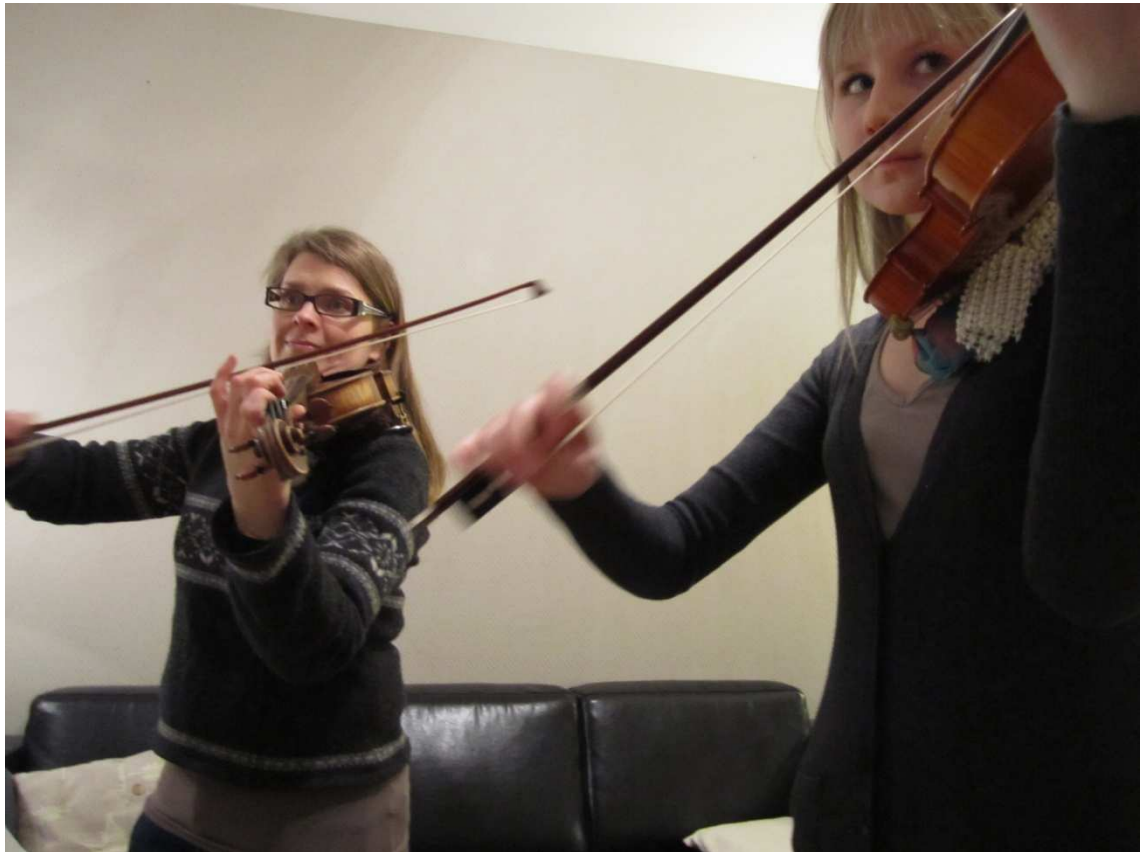
Kuva 3: Opettaja ja oppilas.

samassa kodissa tai edes samassa kaupungissa asuvia isovanhempia. Onkin tärkeää, että suomalaista kansallisperinnettä siirretään muilla keinoin nuorten ja lasten tietoisuuteen. Samalla, kun soitamme vanhuksille heille tuttuja kappaleita, oppivat 11-18-vuotiaat viuluoppilaat vanhoja lastenlauluja ja koululauluja. Oli tietoinen valinta ottaa mukaan vain suomalaista musiikkia. Moni suomalainen pieni viulisti tuntee paremmin vaikkapa ukrainalaiset tai unkarilaiset kansantanssit ja melodiat, kuin vastaavat suomalaiset. Ja syy tähän on yksinkertainen: useimmissa viulukouluissa on käytetty muita, kuin suomalaisia kappaleita. Tähän täytyy kyllä todeta, että uusimmissa viulukouluissa on onneksi alettu ottaa tämäkin asia jo huomioon ja niistä löytyy myös suomalaista musiikkia. Olen ilokseni löytänyt myös lapsille suunnattuja uusia laulukirjoja, joissa keskitytään ennenkaikkea ”isoäidin aikaiseen” musiikkiin. Hyvänä esimerkkinä tällaisesta laulukirjasta käy Mauri Kunnaksen Koiramäen laulukirja (2010).