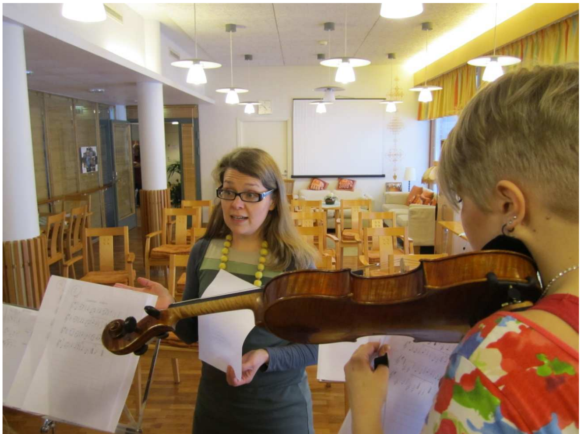
Kuva 6: Harjoitus ennen viimeistä musiikkihetkeä.

7.3. olimme siis Hanna-kodissa viimeistä kertaa ainakin tämän projektin puitteissa. Oppilaita oli tällä kertaa mukana vain kaksi, mutta he olivat hyvin harjoitelleita ja innostuneella mielellä. Olimme paikalla hyvissä ajoin, noin puoli tuntia ennen tilaisuuden alkua. Viritimme viulut ja järjestimme nuotit, telineet ym. paikalleen. Kokeilimme vielä kappaleiden alkuja ja sain jälleen kerran rohkaista tyttöjä soittamaan isommalla äänellä, olihan tila nyt paljon suurempi kuin normaali luokkatila.