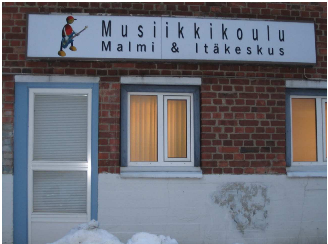
Kuva 1: Musiikkikoulu Malmi-Itäkeskus Viljatiellä Malmin aseman kupeessa.

Kaikki projektissa mukana olevat viuluoppilaani opiskelevat Malmi-Itäkeskus-musiikkikoulussa. Musiikkikoulu on yksityinen, Musiikkikasvatuskeskus ry:n ylläpitämä koulu, jonne ei järjestetä pääsykokeita, vaan kaikki halukkaat pääsevät harrastamaan ilmoittautumisjärjestyksessä. Musiikkikoulu antaa taiteen perusopetusta. (Musiikkikoulu Malmi-Itäkeskuksen nettisivut, 2011) Malmi-Itäkeskus-musiikkikoulussa ei ole pakko tehdä kurssitutkintoja tai osallistua teoriaopetukseen. Viuluyhtyeessä soittaa viisi iältään 11-18-vuotiasta tyttöä. Harrastuksessaan pisimmällä oleva on soittanut viulua jo lähes kymmenen vuotta ja nuorinkin jo kolme vuotta. Tytöt ovat taidoiltaan hyvinkin eritasoisia, mutta se ei ole ollut este tutustumiselle ja yhteissoitolle. Vanhin oppilaista on suorittanut pt 2 -tutkinnon ja yksi nuoremmista tytöistä on tehnyt pt 1 -tutkinnon. Muut soittajat eivät joko ole halunneet tehdä tutkintoja tai eivät vielä ole sillä tasolla, että tutkinnon suorittaminen olisi ollut ajankohtaista.