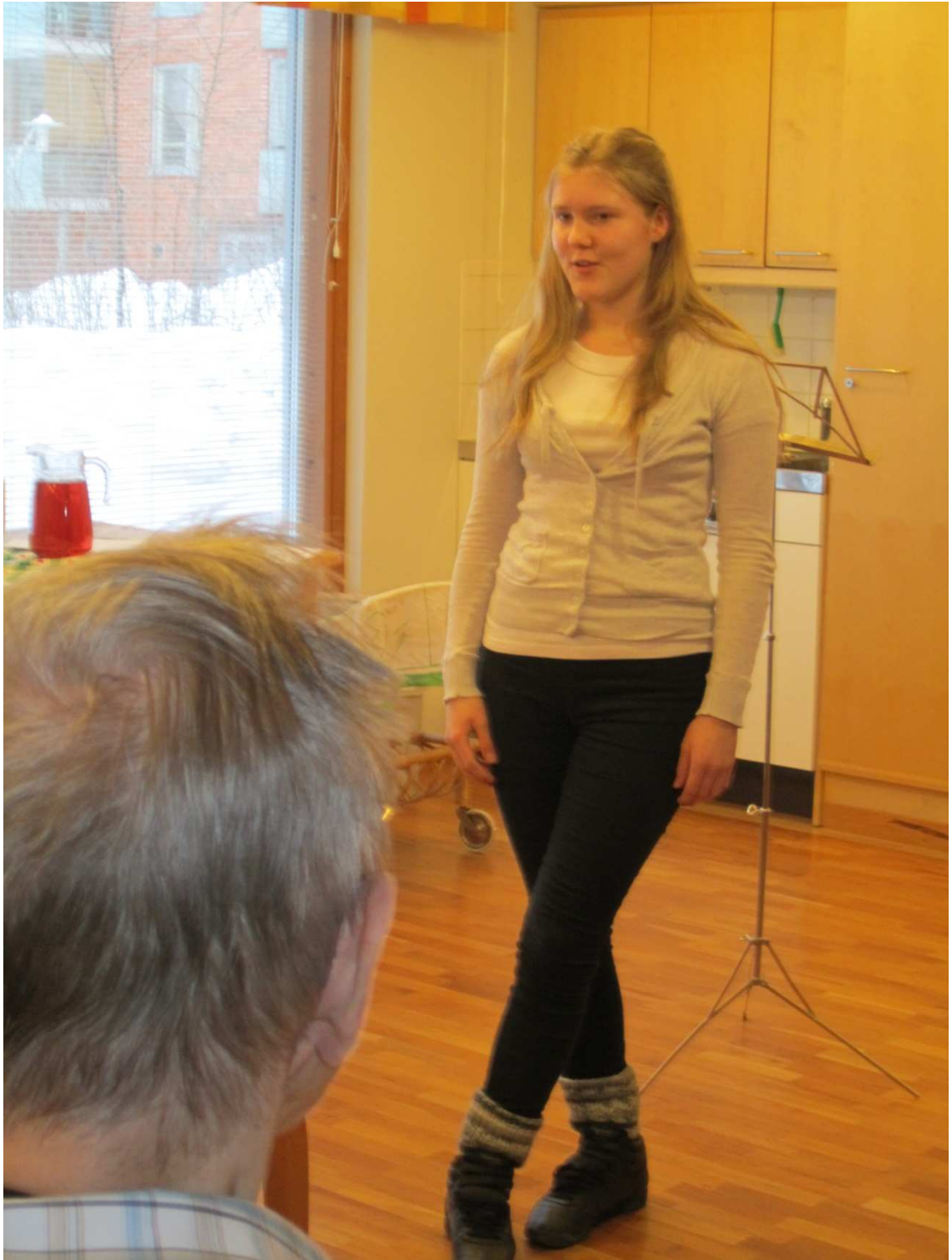
Kuva 7: Nuoret kyselivät ikäihmisiltä menneistä ajoista.