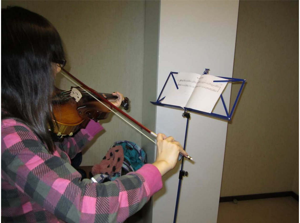
Kuva 5: Soittotunnilla.

ihan kohtuullisesti, vaikkakin hitaasti. Soitin kaikkien oppilaitteni kanssa stemmoja heti myös kaksiäänisesti, vaihdellen omaa stemmaani. Hiukan minua jännitti, kuinka porukka pysyy yhdessä, kun yhteissoiton aika koittaa, koska toisille harjoittelu oli ollu niin hankalaa ja soitto sujui vasta hitaassa tempossa.