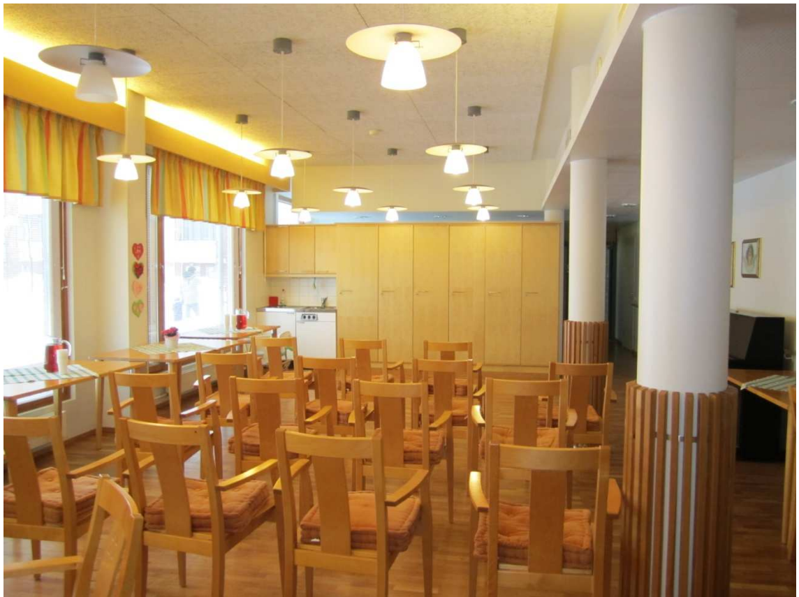
Kuva 2: Hanna-kodin pieni sali

osallistuvat vanhukset ovat olleet osin hyvin pirkeitä, aktiivisia ja omatoimisia. Mukana on ollut muutamia vanhuksia myös muistisairaitten nk. suljetulta osastolta eli ryhmäkodista. Muistisairaitten vanhusten saaminen alakerran saliin on osoittautunut haasteelliseksi, koska se vaatii hoitajilta ylimääräistä työtä ja ylipäätään musiikkihetken huomioimista. Muiden osastojen vanhukset tulevat musiikkihetken omin avuin ja he ovat myös itse huomanneet maisnoslappuset seinillä.