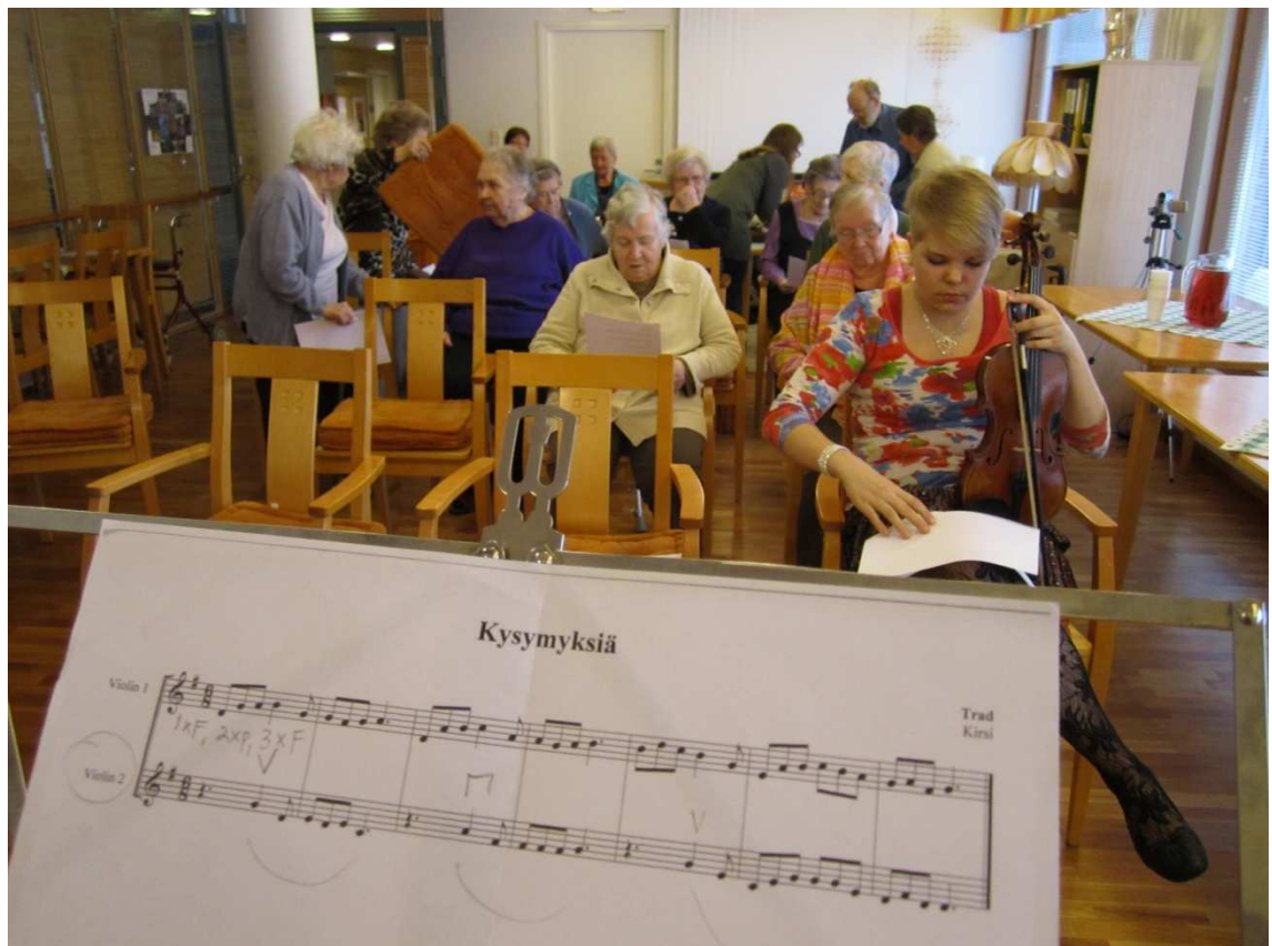
Kuva 8: Pultin takaa.