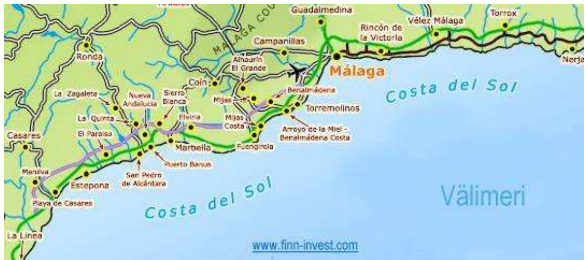
KUVIO 1. Costa del Sol eli Aurinkorannikko

Tultaessa 2010-luvulle Aurinkorannikon väestörakenne on muuttunut. Informaatio, ilmasto ja helppo matkustaminen ovat tuoneet eläkeläisten lisäksi nuoria suomalaisia, yrittäjiä ja nuoria perheitä Aurinkorannikolle. (Hakulinen 2010.) Aurinkorannikko, (Beck 1999, KUVIO 1) käsittää alueen Marbellasta Nerjaan. (Korpela 2008,10.)