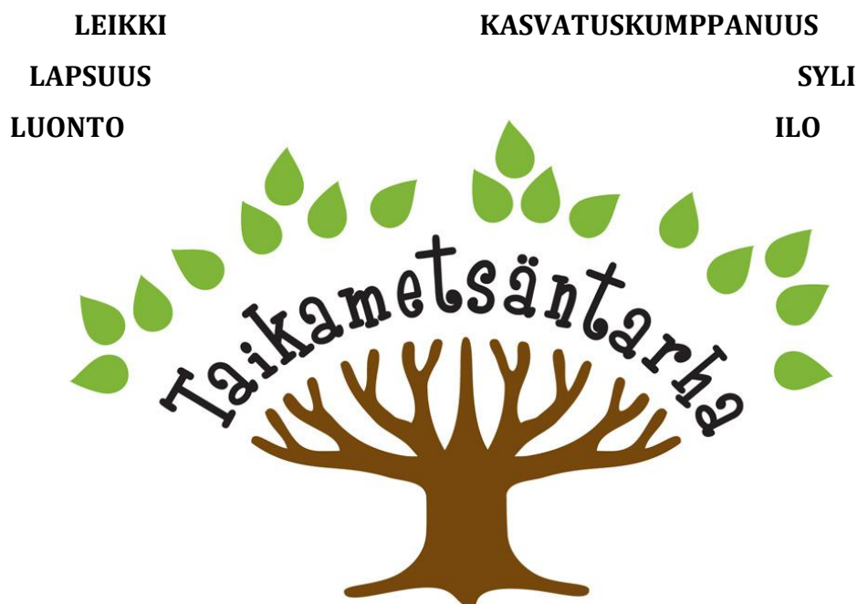
KUVIO 1. Taikametsäntarhan arvopuu

Pidämme vanhempia lastensa parhaina asiantuntijoina, tuemme heitä kasvatus-työssä ja annamme kuuntelevan korvamme koko perheelle. Perheiden kanssa tehtävän avoimen yhteistyön tavoitteena on lapsen hyvä ja turvallinen olo päiväkodissa niin, että päivähoito on saumaton osa lapsen arkea.