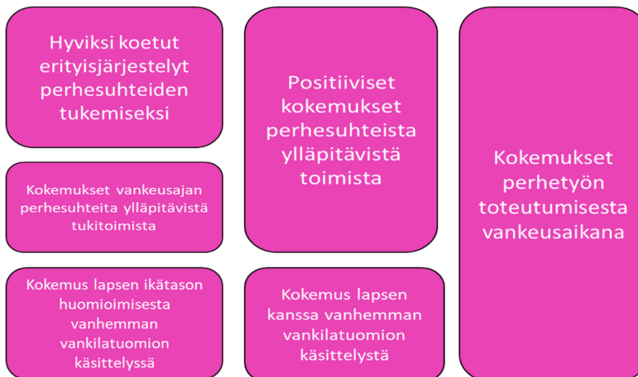
Kuvio 3: Alaluokista pääluokkiin - Esimerkkitaulukko sisällönanalyysistä