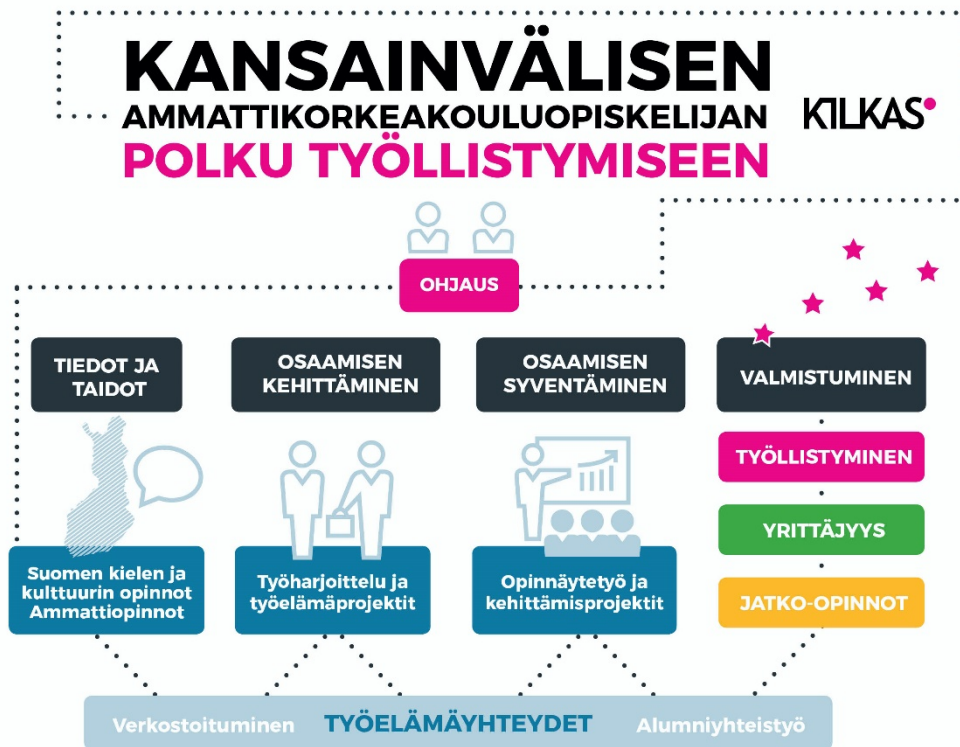
Kuvio 2. Suomenkielinen KILKAS-toimintamalli opetus- ja ohjaushenkilöstön tueksi.

Toimintamalliin kuuluvissa ketterissä kokeiluissa on kuvattu paikallisia työllistymistä edistäviä toimenpiteitä, joita ammattikorkeakouluissa tehtiin hankkeen aikana. Onnistunut kokeilu oli esimerkiksi Career path – kansainvälisen opiskelijan polku työllistymiseen Suomessa, jossa paikalliset asiantuntijat TE-toimistosta, Uusyrityskeskuksesta, kehittämissyhtiöstä ja yrityksistä pitivät tietoiskuja työnhakemisesta, yrityksen perustamisesta, yrityksen rekrytointiprosesseista sekä alueen yritysraakenteesta ja suhdanteista ( www.xamk.fi/kilkas ).