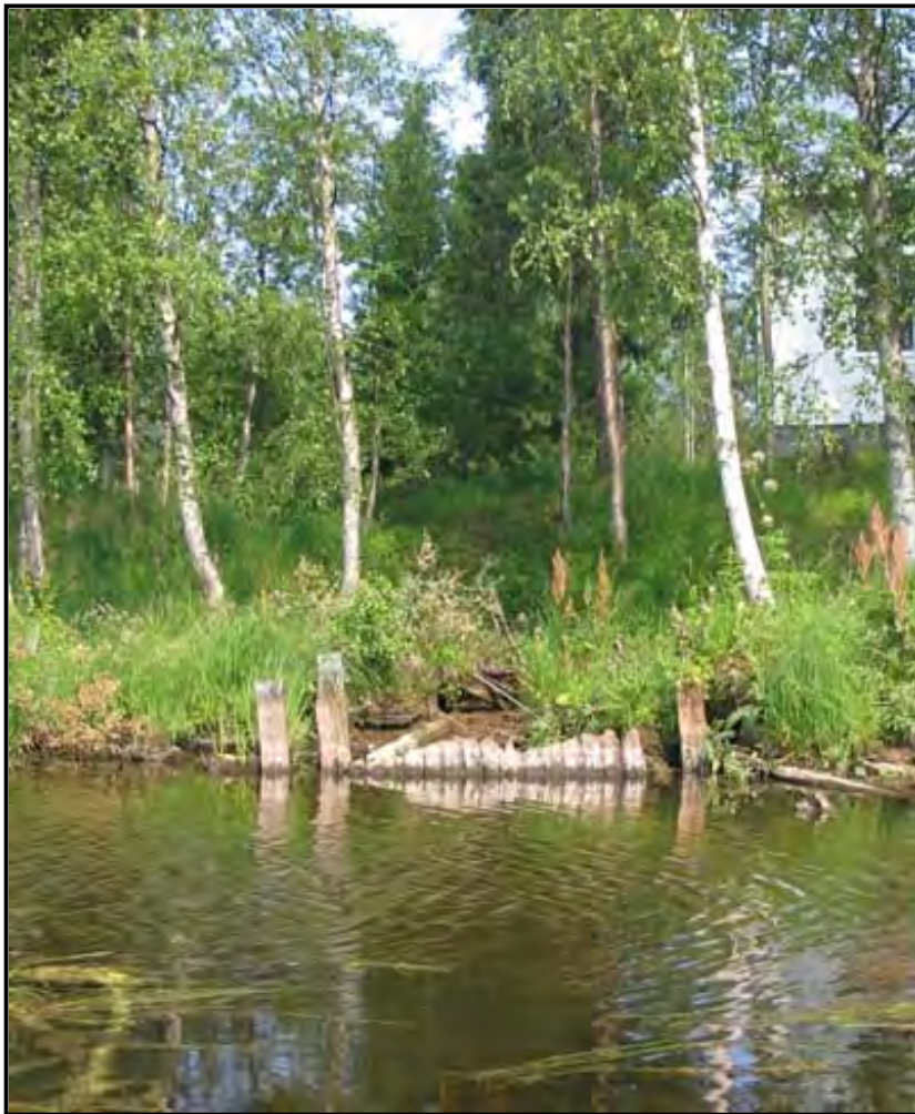
KUVIO 3 Tyynelän vesirajassa on saksalaisten oleskelun ajalta jäänteitä rakennelmasta, joka jatkuu saunan takana kaivantona Ruunapuroa kohden.