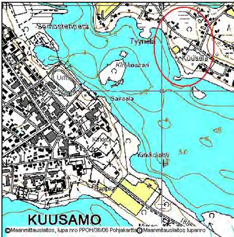
KUVIO 1. Suunnittelukohteen sijainti

Kuusela ja Tyynelä sijaitsevat Kuusamon kaupungin keskustan välittömässä läheisyydessä Kuusamojärven pohjoispuolella ns. Lahdentauksen alueella, keskustasta noin 1,3 km.