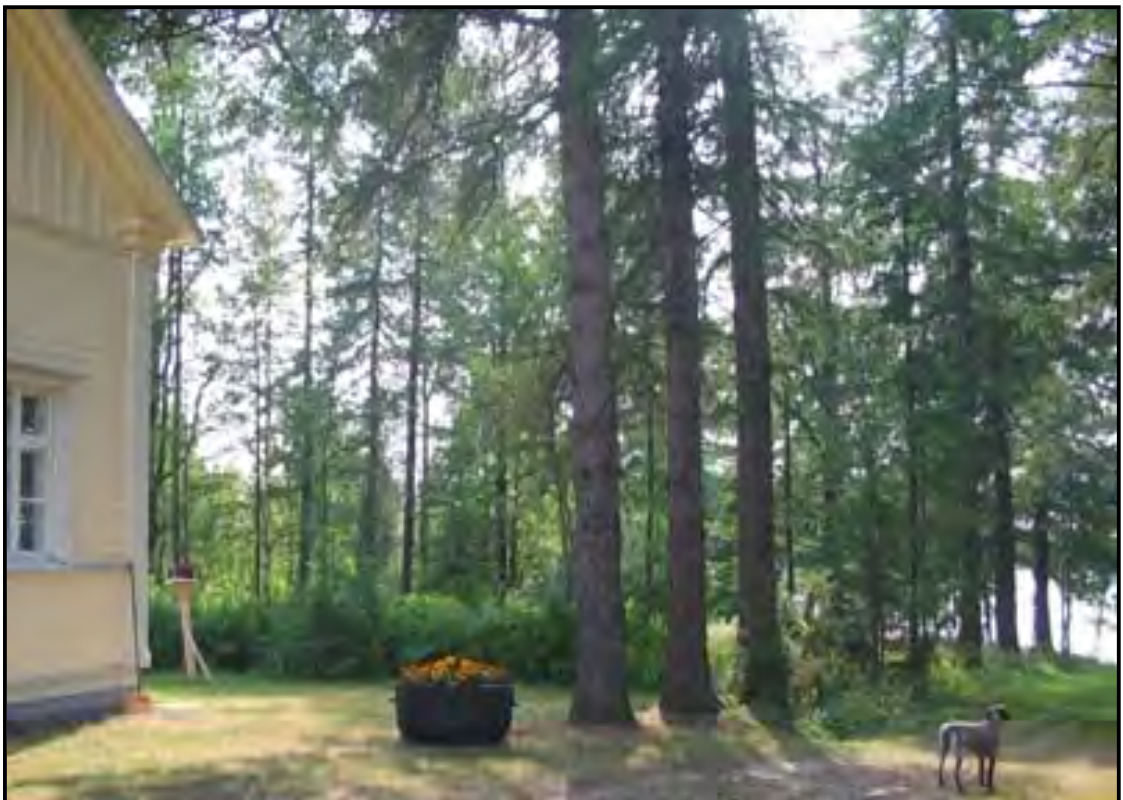
KUVIO 6 Päärakennuksen päädyistä näkymä ns. ruusutarhalle ja rantavyöhykkeelle.

Varusteista pihan keskellä ovat lipputanko ja pihavalaisimet uuden liittymän yhteydessä. Rannassa on uusi nykyaikainen laituri. Kesän 2007 aikana pihapiiriin on rakennettu perheen koirille oma tarha, joka sijaitsee navetan päädyssä.