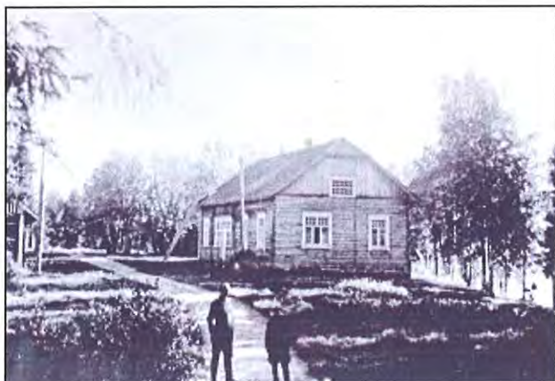
Tyynelän pihapiiriä ( )