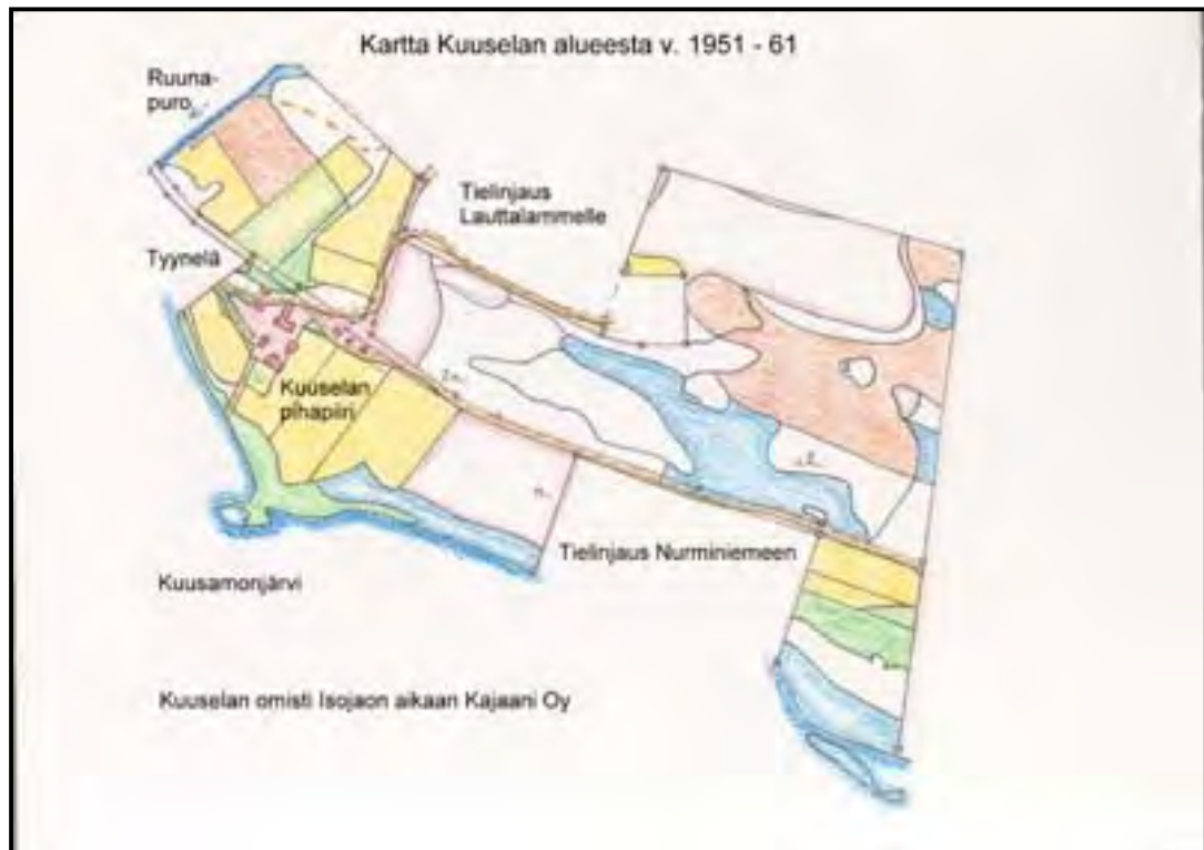
KUVIO 4 Kuuselan tilan isojakokartta vuodet 1951 – 61.