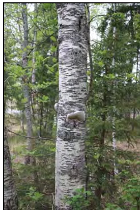
KUVIO 9 ja 10 Kuvassa koivun lahonneita runkoja ja kääpäesiintymiä.