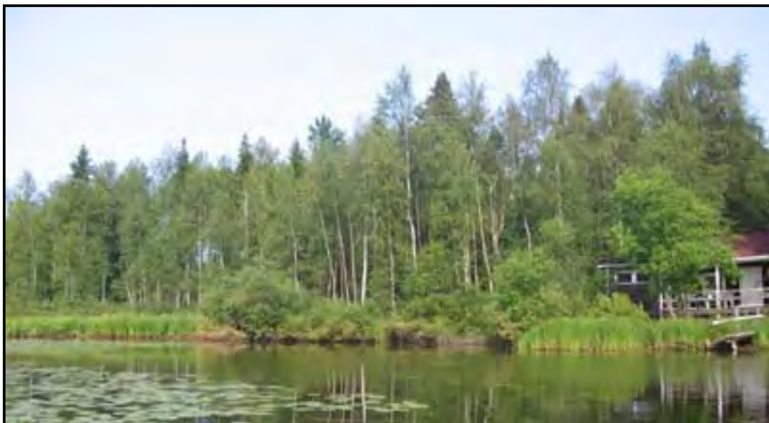
KUVIO 11 Vasemmalla on Ruunapuron suistoa ruoho- ja sarakasvillisuuksineen sekä näkymä rantapensastosta Tyynelän rantasaunan läheisyydessä. Taustalla näkyy myös yksittäisiä metsä- ja siperianlehtikuusia.

Tyynelän puolella Kirkkolahden, Ruunapuron ja Nurminiemen tien väliin jäävällä kuviolla esiintyy laajasti muinaismuistolain piiriin kuuluvaa esiintymää. Tällä alueella metsänhoitotoimenpiteet tulee suorittaa museoviraston antamien suositusten mukaan. Muutoin alue esitetään säilytettäväksi luonnon monimuotoisuuden ja tärkeän elinympäristön vuoksi.