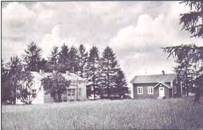
Kuuselankartano pihapiirineen Kajaani Oy:n aikana n. 1950 -luvulla. (Ei tiedossa. Kuvattu 1950 -luvulla.)