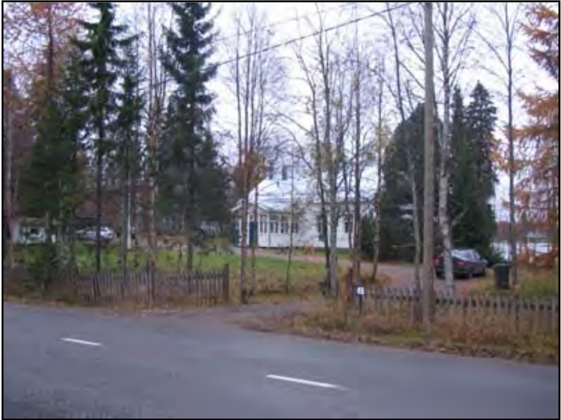
KUVIO 7 Tyynelän pihapiiri kuvattuna Nurminiementieltä vuonna 2007.