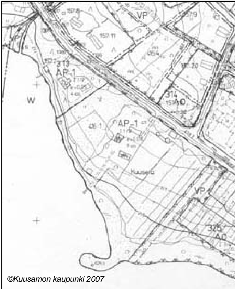
KUVIO 2. Suunnittelukohteen asemakaava

kitty istutettavaksi alueeksi. (Kaavaselostus 1990, 3.)