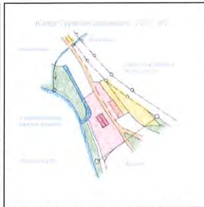
Piirros Tyynelän alueesta v. 1951 - 61 ( )