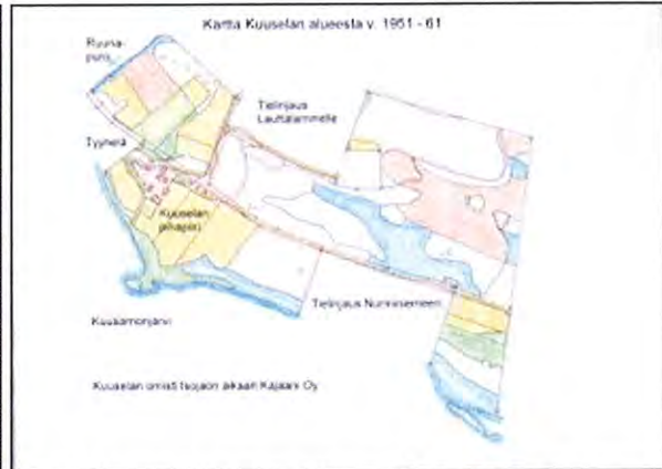
Kartta Kuuselankartanosta v. 1951 - 61