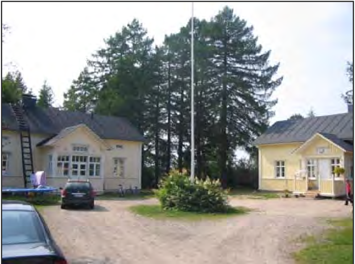
KUVIO 8 Näkymä Kuuselankartanon pihaa hallitsevista kulkuväylistä. Vasemalla on päärakennus ja oikealla Pikkupuoli sekä taustalla rantaan johtava lehtikuusikuja.

Varsinaisia pysäköintialueita suunnittelukohteissa ei ole ollut. Suunnitelmassa Kuuselankartanon tilapäisiksi pysäköintialueeksi esitetään sisääntuloväylän läheisyyttä ja pikkupuolen päätyä, samalla pinnoitteella ja rajauksella kuin muu piha-alue. Suunnitelmassa Tyynelän paikoitusalue esitetään pihan etualalle nykyisen huoltorakennuksen eteen vastaavin pinnoittein ja rajauksin kuin muulla piha-alueella.