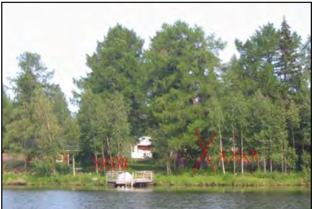
KUVIO 13 Ehdotus näkymän avaamisesta ja poistettavasta puustosta.