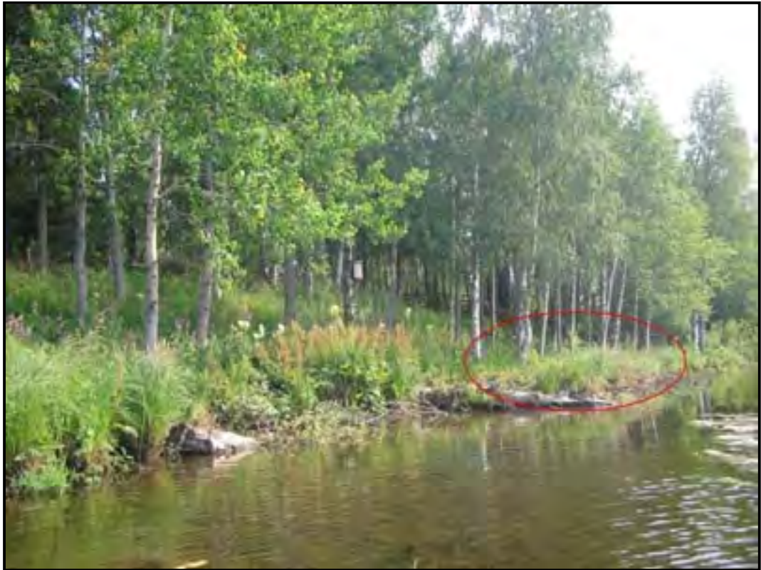
KUVIO 12 Ehdotus luontaisen pensasryhmän paikaksi.