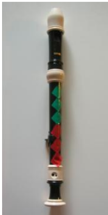
Kuva 1 Vasta-alkajan teipattu nokkahuilu

Eniten Suzuki-nokkahuilunsoitonopetus eroaa perinteisestä nokkahuilunopetuksesta aloitussävelessä. Kun perinteisessä soitonopetuksessa aloitetaan usein h^1 - tai f^1 – sävelistä, aloitetaan Suzuki-opetuksessa d^1 – sävelestä.