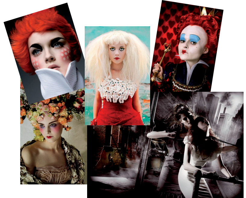
Referenssikuvitusta maskeeraajaa ja tyylittelyä varten.

Lavastamaton, dogvillemainen tyyli suuntautui erinomaiseksi päätökseksi, nähtyämme ensimmäisen päivän kuvamateriaalit. Hahmojen vahva visuaalisuus tasapainotti riisuttua kuvausympäristöä juuri halutulla tavalla.