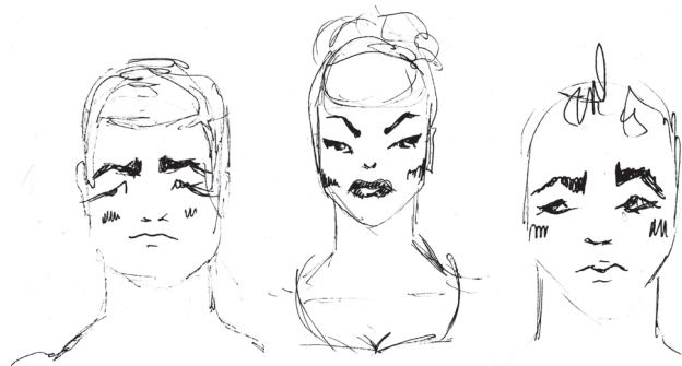
Maskeeraajan tekemiä luonnoksia.