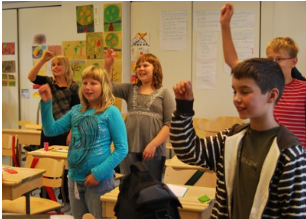
Nilsbyn koulun radiotunnilla harjoitellaan äänenkäyttöä. Tässä kokeillaan, miten äänenkorkeus vaihtuu kädenliikkeen mukana.