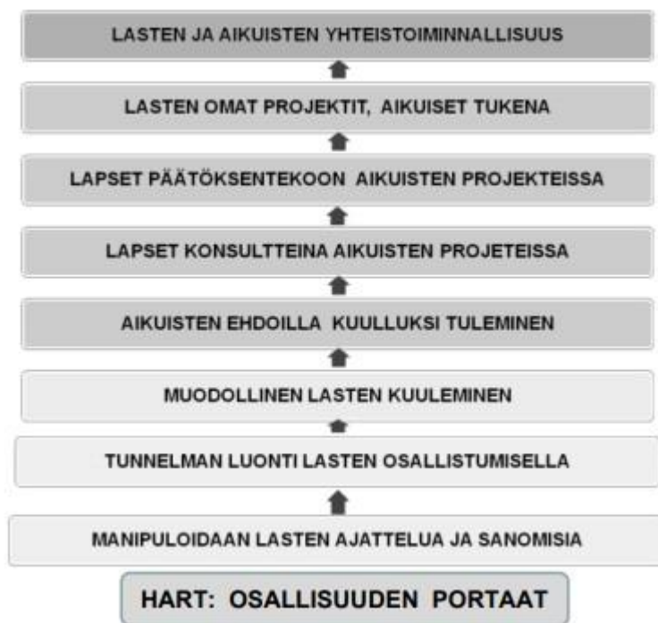
Kuva 1 Lasten osallisuuden portaatt Hartin (1992) mallin mukaan (suomennos Turja 2010, 27.)

Itse pidän osallisuutta kuvaavia taulukoita hyvinä apuvälineinä, jotka auttavat karkeasti hahmottamaan osallisuutta. Niitä ei tule kuitenkaan orjallisesti noudattaa, sillä ne eivät mielestäni sisällä arjen osallisuutta tai sosiaalisen osallisuuden tunteita. Osallisuus on muutakin kuin poliittista vaikuttamista tai projekteissa mukana olemista. Osallisuutta ei mielestäni saa mahduttaa tiettyyn muottiin, sillä se rajaa liikaa. On hyvä tiedostaa erilaisia malleja ja toimintatapoja. Niistä yhdistelemällä voi saada jokseenkin kattavan näkemyksen osallisuudesta.