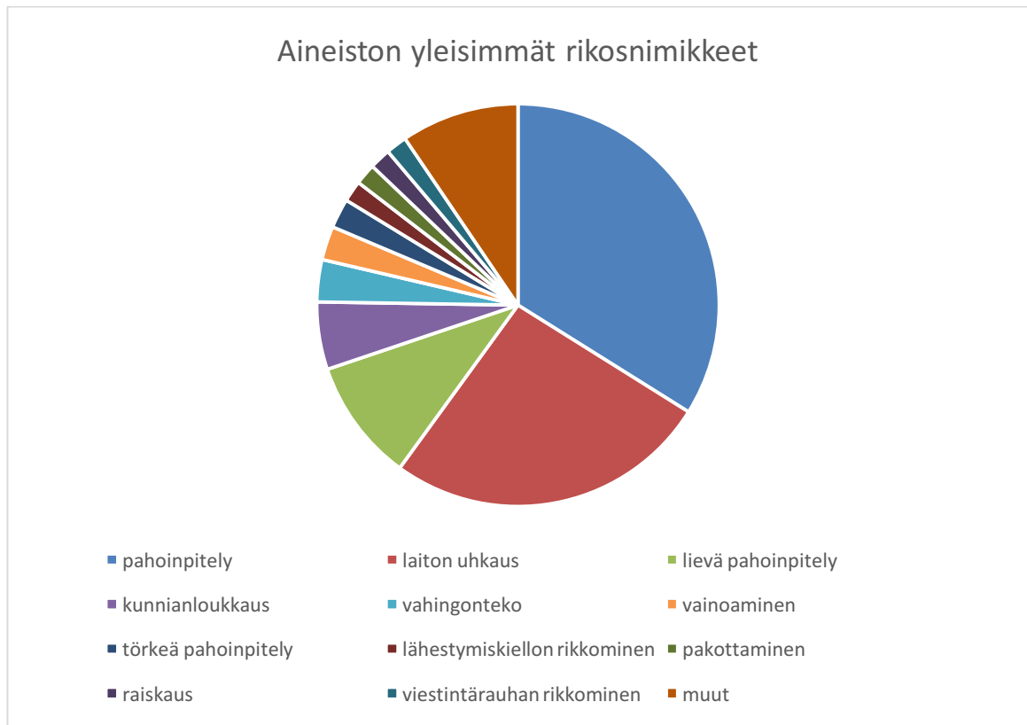
Kuvio 2. Aineiston yleisimmät rikosnimikkeet

Raaka-aineiston käsittelyn jälkeen itse tutkimusaineisto koostui 164 rikosilmoituksesta, joissa oli yhteensä 245 asianomistajaa, 125 epäiltyä ja 312 kpl 45 eri rikosnimikettä. Aineiston yleisimmät rikosnimikkeet olivat perusmuotoinen pahoinpitely (100), laitton uhkaus (77) ja lievä pahoinpitely (29). Lisäksi yleisiä olivat kunnianloukkaus (16), vahingonteko (10), vainoaminen (8), törkeä pahoinpitely (7) sekä lähestymiskiellon rikkominen, pakottaminen, raiskaus ja viestintärauhan rikkominen, joita kutakin oli viidessä ilmoituksessa. Yleisimmät rikosnimikkeet käyvät ilmi kuviosta 2.