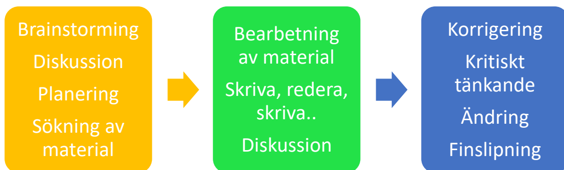
Figur 2. Vår arbets fas

En utmaning med examensarbetet var diagrammen och hur de skulle se ut. Vi uppmunttrade varandra att orka vidare med arbetet. Tack vare vårt effektiva sätt att skriva tillsammans, lyckades vi slutföra detta examensarbete ( se figur 2 ).