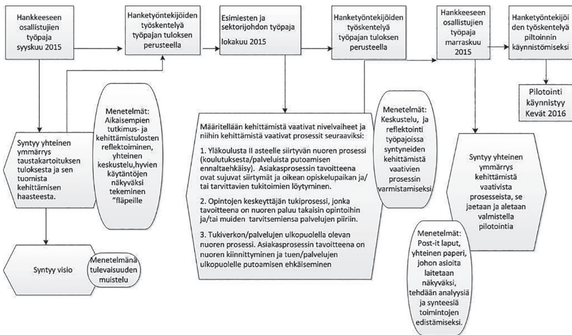
KUVIO 1. Työpajaprosessi (Pätynen, Vuokila-Oikkonen & Norontaus 2016, 132).

Edellä kuvatun kokonaisuuden perusteella siis tapahtui nuorten palveluihin liittyvän toimintatavan kehittäminen. Sinänsä mitään uutta palvelua ei luotu. Tässä raportissa uuden toimintatavan kuvaaminen (mallinnus) perustuu vahvasti hankkeen aikana jo tehtyihin kuvauksiin, joiden tekemisessä tämän arviointiraportin tekijät ovat olleet vain löyhästi mukana. 1