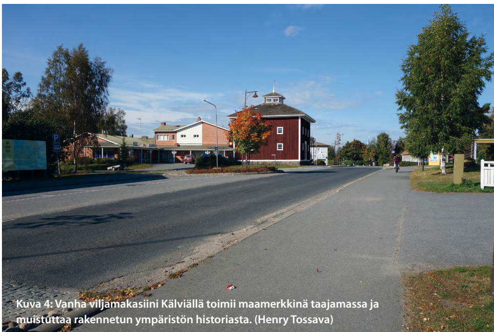
Kuva 4: Vanha viljamakasiini Kälviällä toimii maamerkinä taajamassa ja muistuttaa rakennetun ympäristön historiasta. (Henry Tossava)

väestöltään supistuvissa kunnissa resursseihin nähden erittäin mittavia. Haastavasta yhtälöstä muodostuu suuri vaara toistaa vanhoja virheitä, ja toteuttaa pakottavat uudisrakentamisinvestoinnit kestävän kehityksen vastaisella tavalla halvasti ja huonolaatuisesti.