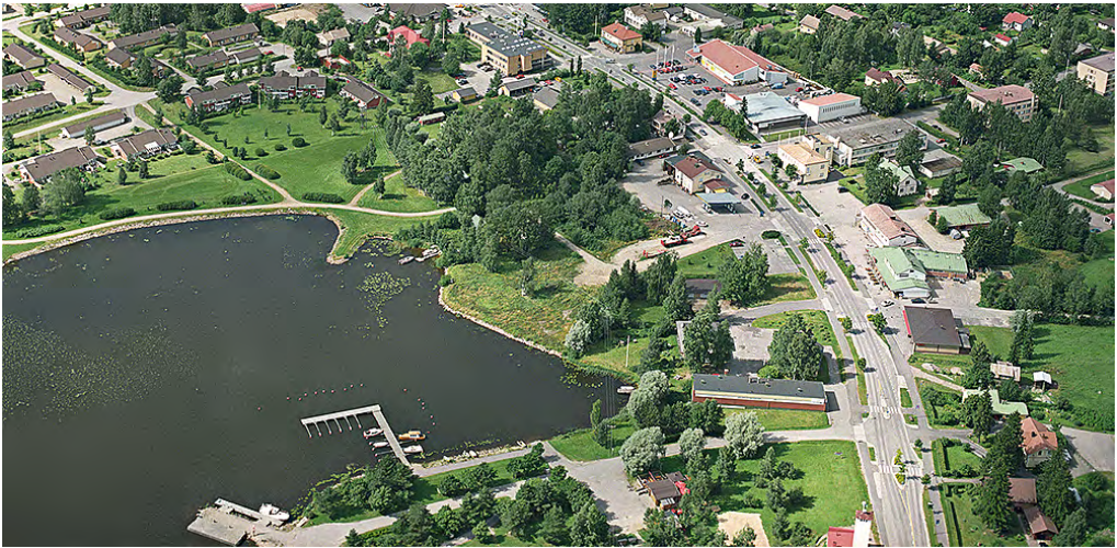
Kuva 1: Esimerkki Sysmän taajamasta, jossa liikekeskustan tiealue on ensin laajentunut asfalttikentäksi ja myöhemmin tiealuetta on jaettu osiin liikenneturvallisuuden parantamiseksi rakentamalla erilliset kevyen liikenteen väylät ja lisäämällä istutuksia.

ennuste ja siihen perustuneet kaavat, joiden mukaisesti lähes kaikki vanhat rakennukset oli tarkoitus purkaa ja korvata uudisrakentamisella (vrt. Kukkonen & Rautamäki 1982). Maaseutu-taajamat alkoivat muistuttaa toisiaan ja samat kaupungistumisen ihanteen mukaiset ilmiöt alkoivat toistua: tällaisia olivat esimerkiksi teiden oikaisu ja taajaman ohittavat tiet, hallimaiset liikerakennukset ja vanhojen rakennusten purkaminen uusien tieltä, sekä mittakaavan kasvaminen tiiviisti rajautuneesta raittimiljööstä aukeisiin asfalttikenttiin, kuten ylläoleva viistokuva (kuva 1) osoittaa.