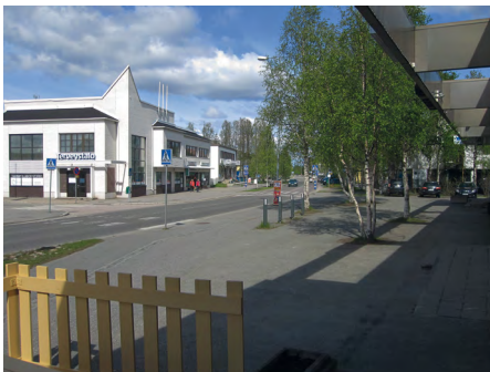
Kuva 5: Sodankylän keskusraittia. (Esko Härkönen)

Yleisenä pitkän aikavälin tavoitteena tuleekin olla maaseudun maankäytön suunnittelun ja siihen perustuvien ratkaisujen laadun parantaminen. Tulevaisuudessa elinympäristön laadulliset tekijät kuten viihtyvyys sekä hyvinvointiin ja terveyteen liittyvät arvot tulevat korostumaan. Sen vuoksi tarvitaan paikallisiin olosuhteisiin, rakennusperintöön ja aluehistoriaan ankkuroituvaa ja siitä ponnistavaa maankäytön suunnittelua, jonka avulla edistetään asukkaiden ja muiden maaseutu-toimijoiden hyvinvointia ja arjen sujuvuutta. Yhdyskuntasuunnittelun tutkimuksen fokusta onkin suunnattu muun muassa Oulun yliopistossa kohti rakennetun ympäristön ja maankäytön suunnittelun mahdollisuuksia edistää yhtäaikaista kulttuuri- ja luonnonperinnön säilymistä ja asukkaitten hyvinvointia. Meneillään on uusia