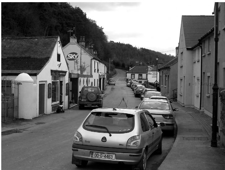
Kuva 2: Irlantilaisista kyläraittia leimaa vahva kulttuuriperintö, toisaalta myös autoitumisen haasteet näkyvät. (Emilia Rönkkö)

Suomalaisissa maaseututaajamissa muutoksia on määrittänyt se, onko taajaman keskipiste pysynyt paikoillaan vai vaeltanut kauemmas. Taajamien keskustat alkoivat 1960–1970-luvulla muuttua, kun ohitusteitä ja uudenlaisia päivittäistavarakauppoja alettiin rakentaa. Tilanteessa, jossa taajaman keskipiste on siirtynyt selkeästi etäämmälle, vanhempi rakennettu miljö on voinut jäädä rauhaan muospaineilta ja rakennusperinnön säilymisen edellytykset ovat olleet paremmat. Havainnollinen esimerkki tästä kehityskulusta on Hauhon kirkonkylä Hämeessä (kuva 3). Keski-ikäisen kirkonkylämiljöön säilymisen on mahdollistanut uusi taajaman ohittanut läpikulkutie, jonka varteen kaupalliset palvelut