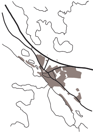
Kuva 3: Hauhon taajaman alue ja päätiet vuonna 2014. Nykyinen Lahti–Tampere -tie ohittaa taajaman sen pohjoispuolelta ja vanhempi tie kulkee taajaman nykyisen keskustan läpi. Vanha kirkonkylä jää vesistön rannan puolelle. (Anni-Maija Fincke 2015)

ovat siirtyneet. Myöhemmin on vielä rakennettu uusin Lahti–Tampere -valtatie, joka ohittaa taajaman merkittävästi kauempaa. (Ks. Fincke 2015.)