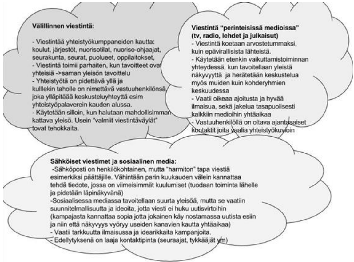
Kuva 7. Nuorisovaltuuston viestinnän pilvet (Meiju Hiitola)

Mikäli tavoitellaan kontaktia päättäjiin ja viranhaltijoihin, tulisi säännöllisesti tarjota kiinnostuneille tietoa ja kuulumisia toiminnan läpinäkyvyyden takia, muistutetaan olemassaolosta, jotta nuorten mielipidettä muistetaan kysyä, sekä osoitetaan toiminnan tärkeys myös toimintaa rahoittavalle taholle. Kun tavoitteellisesti viedään eteenpäin hanketta tai ideaa, voi perinteinen henkilökohtainen puhelinsoitto asiasta päättävälle henkilölle olla tehokkain viestintätapa. Tällöin viestin perille meno voidaan taata. Tärkeää on tuntea ja perustella asia, sekä kyetä vastaamaan vasta-argumentointiin. Näkyvyys perinteisissä medioissa noteerataan tässä kohderyhmässä, sillä myös heidän äänestäjänsä ja taustatahonsa seuraavat usein keskustelua perinteisissä medioissa. Sosiaalisen median seuraamien (Facebook, Instagram, Twitter) on usein kohderyhmän hallussa, vaikei näkyvää kommentointia ja osallistumista olisikaan.