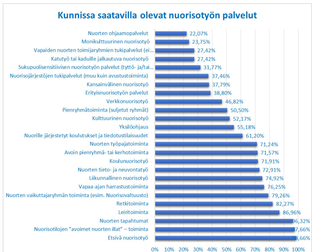
Kuva 5: Kunnissa saatavilla olevat nuorisotyön palvelut.