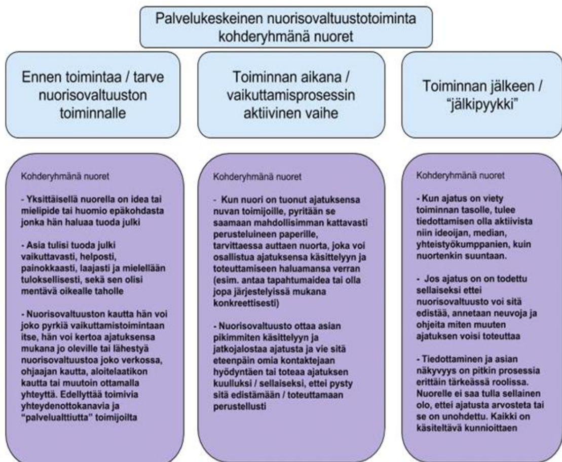
Kuva 7 Palvelukeskeinen nuorisovaltuustotoiminta, kohderyhmänä nuoret (Meiju Hiitola)

Näkemykseni nuorisovaltuustosta on sen toiminta kunnallisen palveluna nuorten vaikuttamismahdollisuuksien laaja-alaisena kehittäjänä ja nuorten äänitorvena eri instansseissa. Valtakunnallisesti nuorten vaikuttamiskanavia vaivaa yksipuolinen edustuksellisuus, jolloin vaikuttajanuoret eivät edusta tarpeeksi kattavasti nuorten mielipidettä kunnassa. Nuoret ovat pitkälti myös liian kiinnostuneita tuottamaan tapahtumia nuorille, mikä vie tärkeitä resursseja usein muissakin yhteyksissä aktiivisilta toimijoilta. Nuorten vaikuttaminen heitä koskeviin asioihin ja nuorten mielipiteiden välittäminen kunnalliseen päätöksentekoon on kuitenkin tehtävistä tärkein. Muun toiminnan tulisi olla tätä näkökulmaa tukevaa.