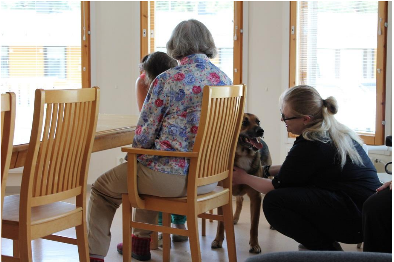
KUVA 9. Asukkaat antoivat makupaloja koirille