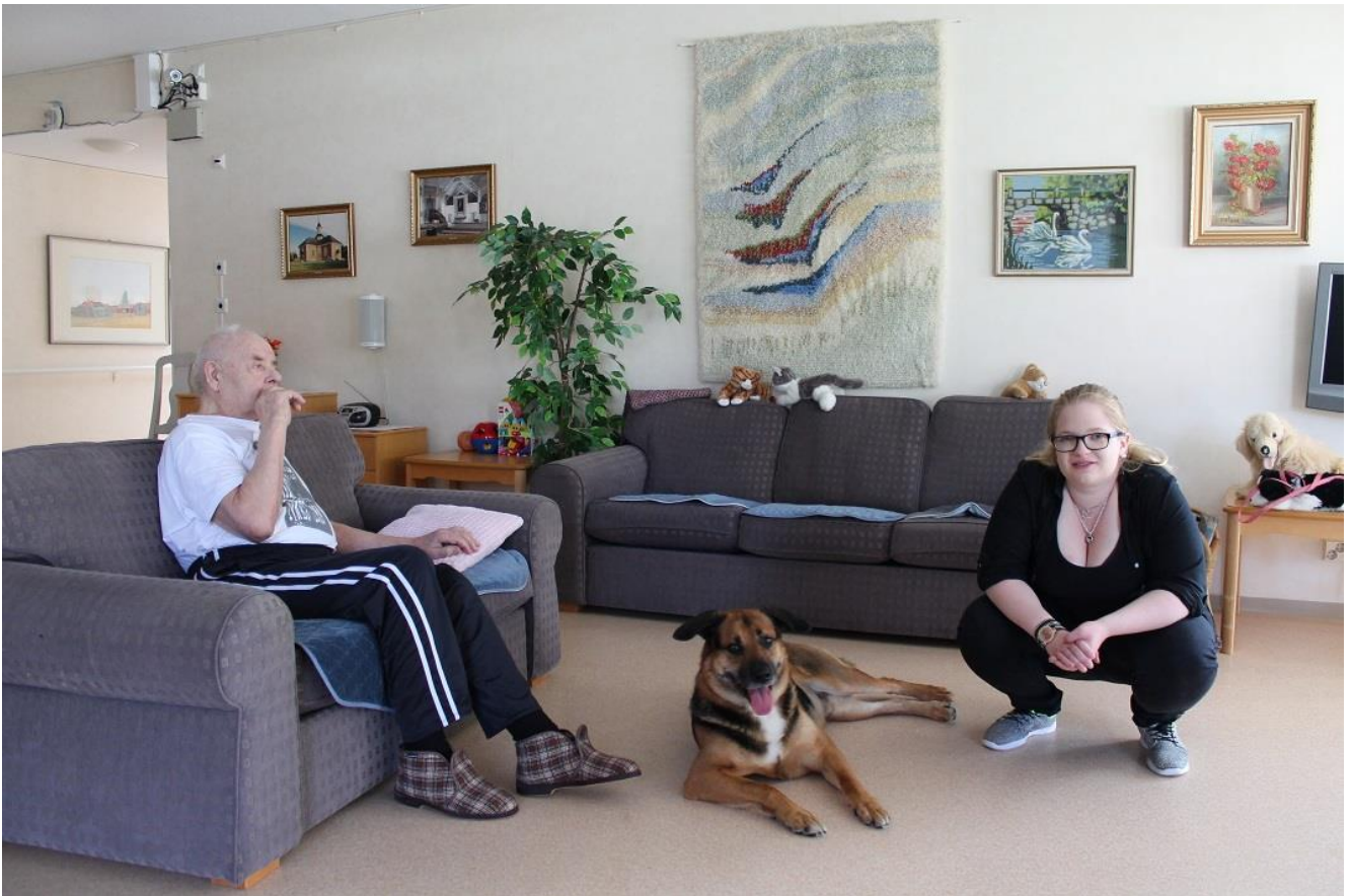
KUVA 6. Tutustumista muistisairaiden osastolla

Tutkimuksissa on todettu, että palvelukodeissa asuvat vanhukset tykkäävät silittelä ja jutella eläinten kanssa. Toisinaan vanhus saattaa jopa lähteä liikkeelle ja aktivoitua entisestään piristyessään eläimen seurasta. Tämä myös aktivoi vanhuksia kanssakäymiseen toisten ihmisten kanssa, ja näin ollen mahdollistaa erilaisiin viriketuokioihin osallistumisen ja niistä nauttimisen ja hyötymisen. Lemmikkieläimen läsnäolo rauhoittaa muistisairasta ihmistä ja tätä havaintoa onkin pyritty hyödyntämään useissa eri laitoksissa ympäri maailmaan. (Vartiovaara 2006.)