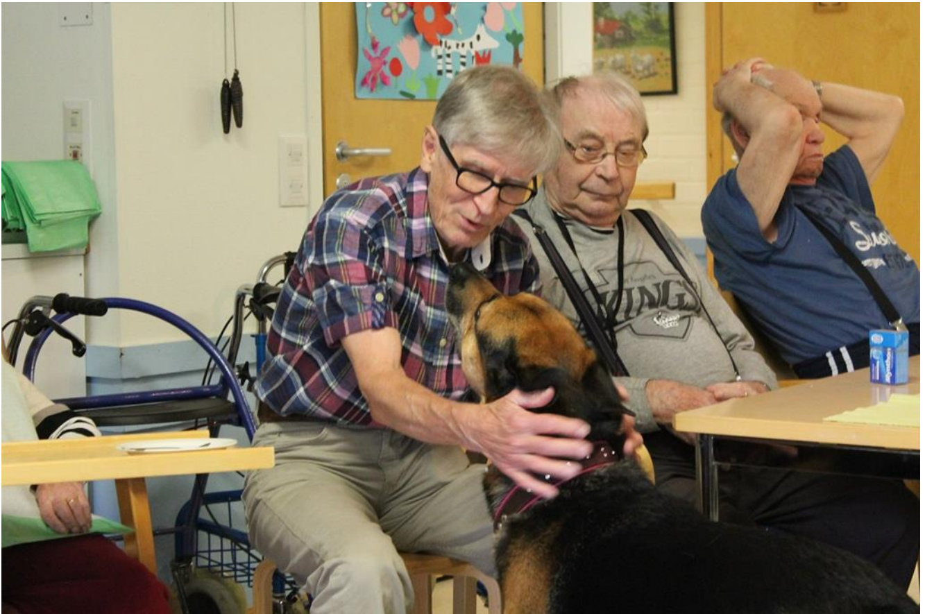
KUVA 3. Luottamussuhteen rakentamista