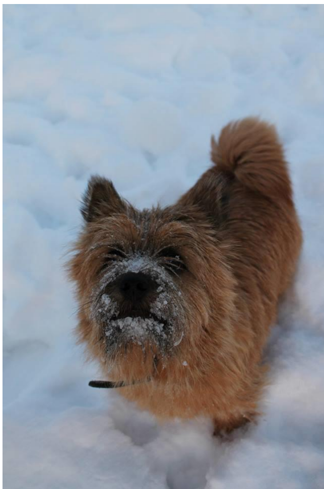
KUVA 5. Lily