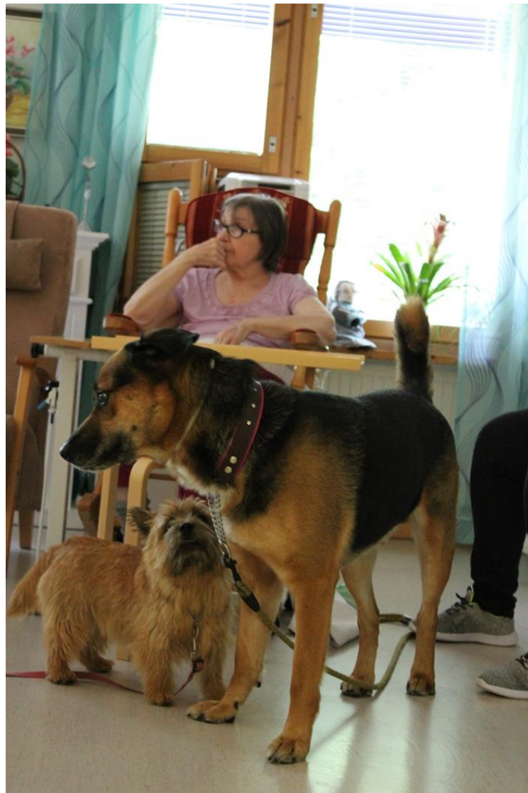
KUVA 10. Asukkaat seuraavat koirien leikkiä

Palvelukodin työntekijä nykyisin tullessaan töihin ottaa tietyin aikavälein koiransa mukaan ja antaa sen viettää työvuoron asukkaiden kanssa. Toiminnasta on tullut vakiintunutta ja koko palvelukodin väki kokee tämän olevan mukavaa, mielekästä ja antoisaa.