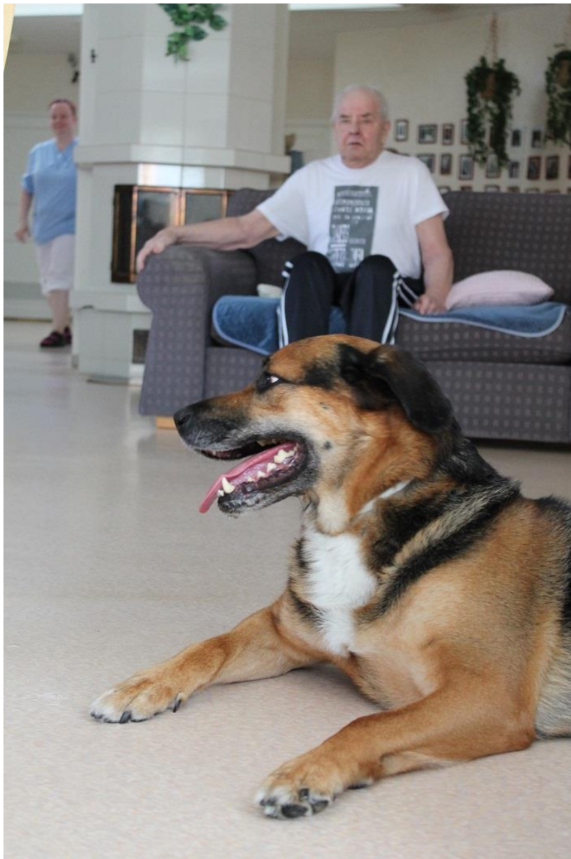
KUVA 8. Poju odottelee leikittäjää

Muistelu auttaa hahmottamaan ihmisen elämänkaaren. Sen avulla on mahdollista solmia uusia ihmissuhteita ja muutenkin sosialisoitua. Koska ihmiselämä on prosessi, muistelun avulla on hyvä tutkia prosessin vaiheita ja näihin liittyviä syy-seuraussuhteita. Muistelun avulla on mahdollista siirtää tietoa sukupolvelta toiselle, koskien erilaisia historian vaiheita. Näiden historian vaiheiden ymmärtämisen myötä ihminen pystyy peilaamaan omaan tilanteeseensa vaikuttaneita seikkoja ja nykytilannetta. Hoitotyössä muistelu on tärkeä osa asiakkaan yksilöllisten tarpeiden hahmottamista ja asiakkaan ymmärtämistä, esimerkiksi miksi asiakas mahdollisesti reagoi joihinkin asioihin odottamattomalla tavalla. Ketään ei voi kuitenkaan pakottaa muistelemaan, vaan muistelun täytyy olla asiakkaalle mielekästä ja vapaaehtoista. (Airila 2009.)