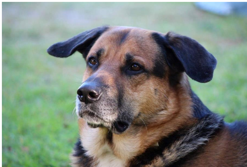
KUVA 4. Poju

Poju on todella ihmisrakas ja helposti makupaloilla motivoitavissa. Koska Poju on suurikokoinen, sen kanssa voi toimia myös heikommilla motorisilla taidoilla satuttamatta koira. Poju on rauhallinen ja antaa ihmisen lähestyä itseään, ennen kuin itse lähestyy ihmistä. Pojun olemus on turvallinen ja usein maataloissa asuneilla vanhuksilla oli ollut suurikokoinen koira, joka toi myös tuttuuden tunnetta. (KUVA 4.)