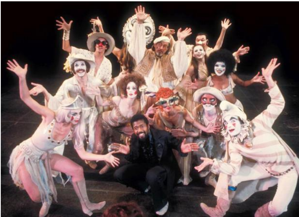
Kuva 5. Ben Vereen (Leading Player) ja hänen ryhmänsä (Players).

Lopuksi haluan kiittää kaikkia ihmisiä, jotka ovat tukeneet minua kirjallisen opinnäytetyöni kanssa: kiitos opettajilleni, perheelleni sekä opiskelijatovereilleni!