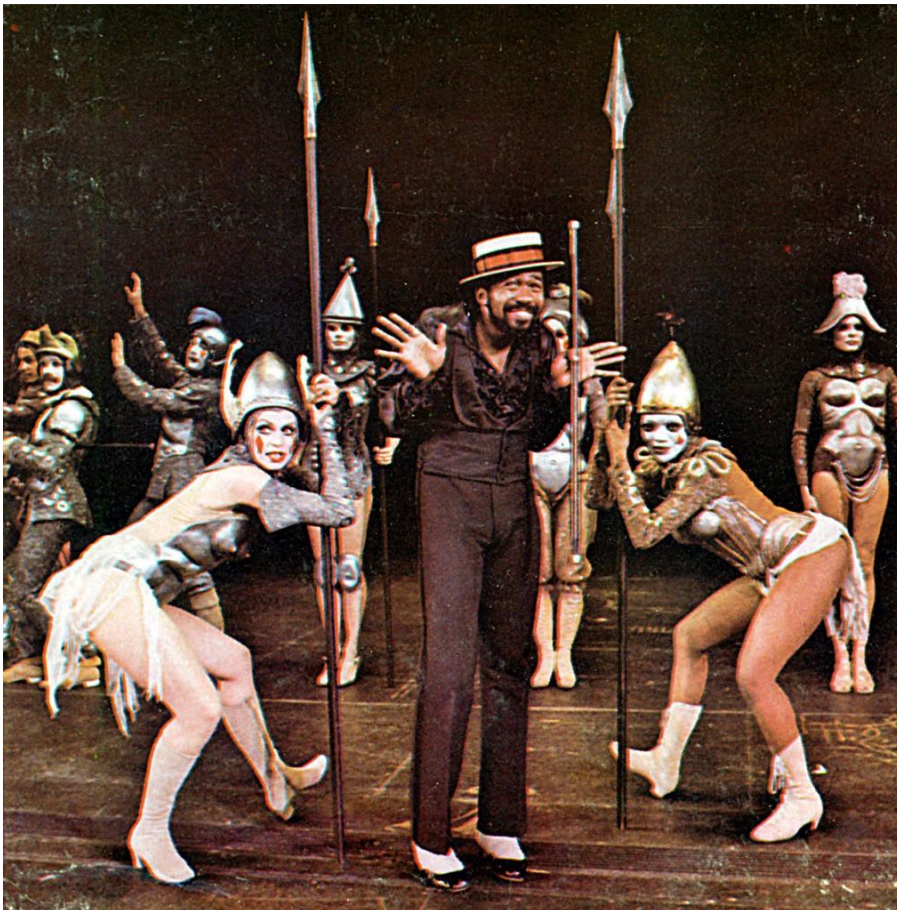
Kuva 4. Ben Vereen (Leading Player) kahden ryhmäläisen (Player) ympäröimänä.

Fosse halusi kuitenkin käsitellä väkivaltaa komedian ja naurun kautta: Kun kohtauksen lopussa lava täyttyy irtonaisista raajoista ja ruumiinosista, taustalla soi hilpeä ja nopea-tempoinen musiikki, jonka jälkeen Leading Player kommentoi yleisölle vitsikkäästi: "You ain't seen nothing yet folks!", antaen lavalla nähdylle karulle väkivallalle loppukevennyksen.