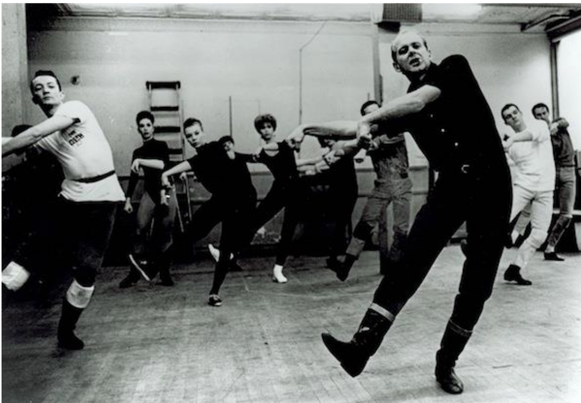
Kuva 1. Bob Fosse (edessä oikealla) opetustilanteessa