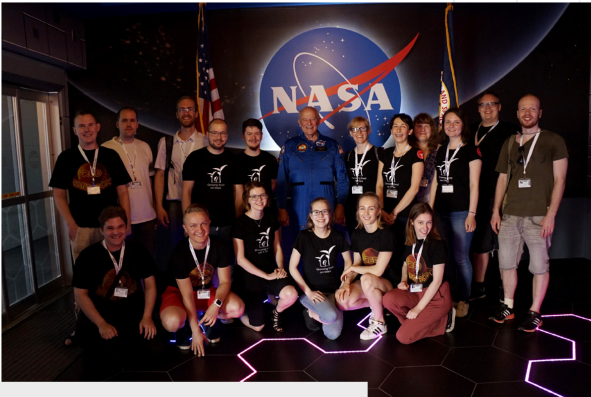
↑ Epic Challenge –opiskelijat toukokuussa 2016 Floridan Kennedy Space Center:ssä NASA:n vieraana.

Valtakunnallista mediahuomiota Karelia-ammattikorkeakoulu sai mm. voittamalla kansallisen KÄRJET -palkinnon hankkeella NASA Epic Challenge, jossa tarjottiin eri alojen ja koulutusasteiden opiskelijatiimeille mahdollisuus opiskella Yhdysvaltain avaruushallinto NASA:n käyttämiä innovaatiomenetelmiä ja kehittää ratkaisuja Marsin asuttamiseen liittyviin haasteisiin.