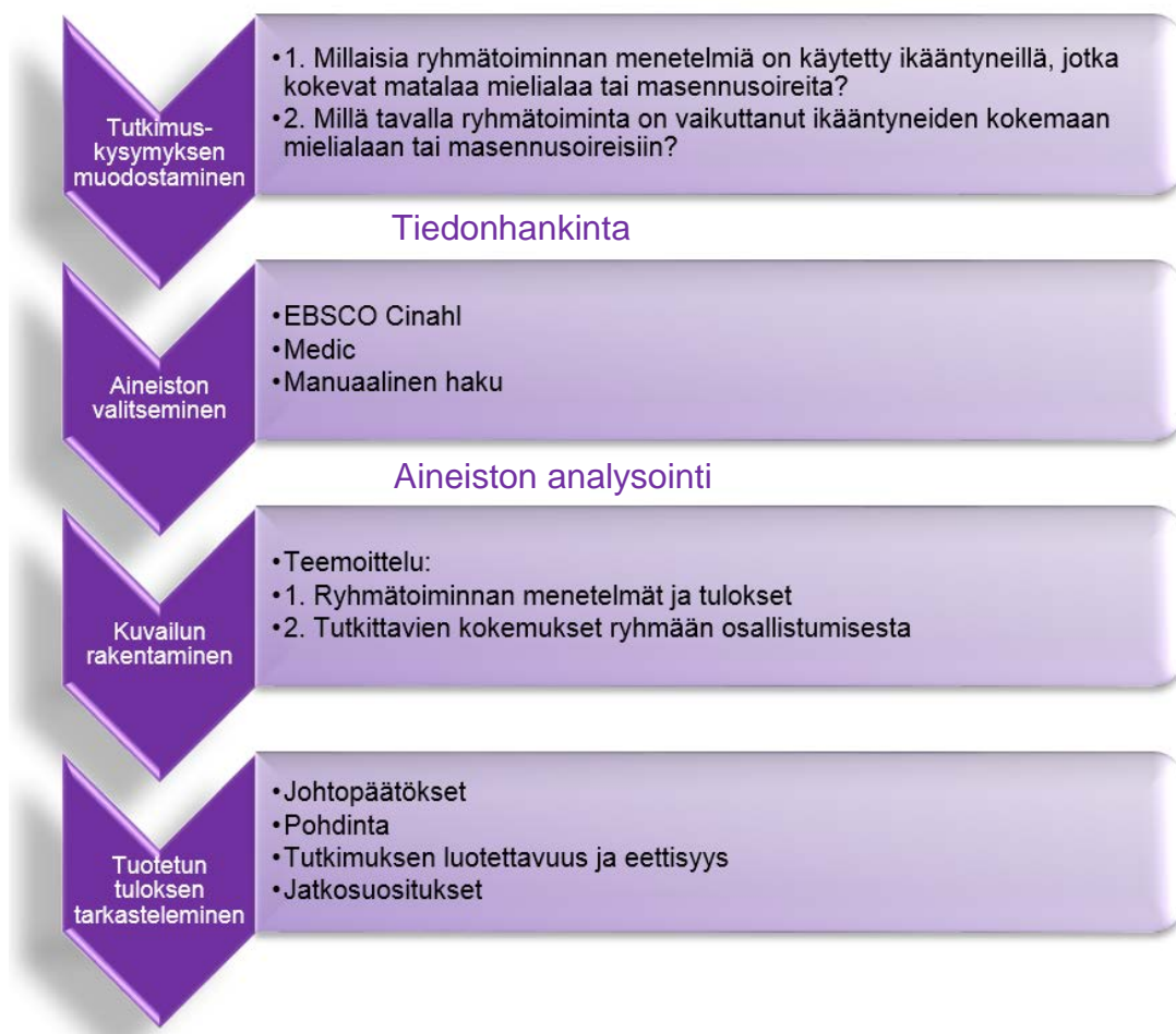
Kuvio 6. Opinnäytetyön kirjallisuuskatsauksen prosessi (Kangasniemi ym. 2013, 294, mukaillen)