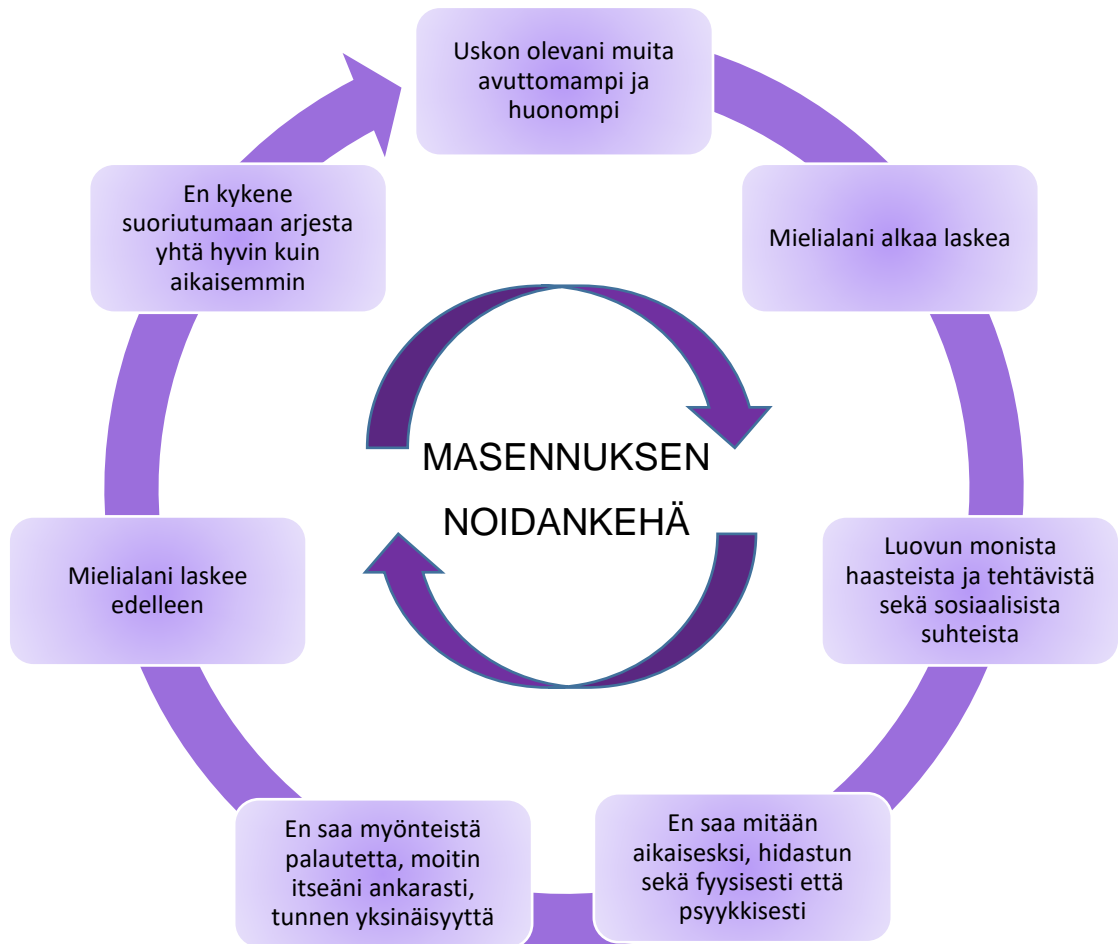
Kuvio 1. Masennuksen noidankehä (Saarenheimo ym. 2011, 45, mukailten)

Masennus ei ainoastaan vaikuta mielialaan, vaan se voi muuttaa myös aivojen toimintaa ja rakennetta, sillä aivot ja mieli ovat yhteydessä toisiinsa. Jo pitkään on tiedetty aivojen välittäjäaineiden kuten serotoniinin ja noradrenaliinin pitoisuuksien vähenemisen liittyvän masennukseen. Masennustilassa hormonitasapaino häiriintyy ja näiden välittäjäaineiden tuotantoon voidaan pyrkiä vaikuttamaan lääkityksellä. (Masennus vaikuttaa aivojen toimintaan ja rakenteeseen 2016.) Myös kortisolihormonin erityksessä tapahtuu usein muutoksia, mikä voi vaikuttaa vuorokausirytmiiin sekä häiritä muistin toimintoja (Hansson 2012). Hermoverkkoteorian mukaan masennuksessa hermokasvutekijöiden toiminta vähenee, hermosolujen välinen viestintä hiipuu ja tapahtuu hermoverkon lamaannusta. Kyseessä olevan teorian mukaan masennus syntyy, kun stressihormonitasojen nousun seurauksena mielialan säätelyyn vaikuttavat aivojen hermoverkot harvenevat ja lamaantuvat. Puolestaan aivokuoren ja limbisen