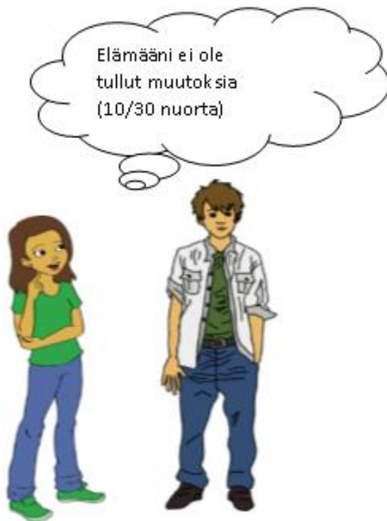
Kuvio 8. Nuoret, joiden elämään ei ole tullut muutoksia.

Alla olevassa kuviossa näkyy (kuvio 8) niiden nuorten lukumäärä, jotka kokevat, että elämään ei ole tullut muutoksia.