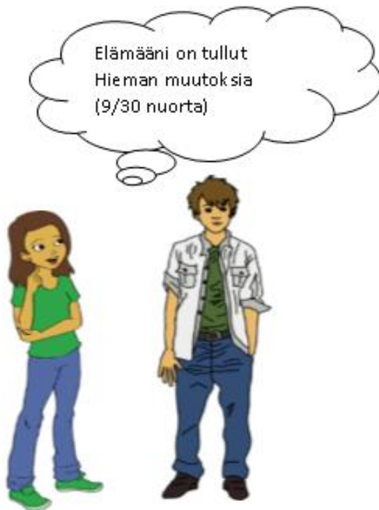
Kuvio 7. Nuoret, joiden elämään on tullut hieman muutoksia.

Alla olevassa kuviossa näkyy (kuvio 7) niiden nuorten lukumäärä, jotka kokevat elämänsä tulleen hieman muutoksia turvapaikanhakijoiden myötä.