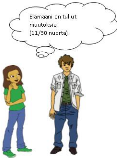
Kuvio 6. Nuoret, joiden elämään on tullut muutoksia.

Alla olevassa kuviossa (kuvio 6) niiden nuorten lukumäärä, jotka kokevat elämäänsä tulleen muutoksia turvapaikanhakijoiden myötä.