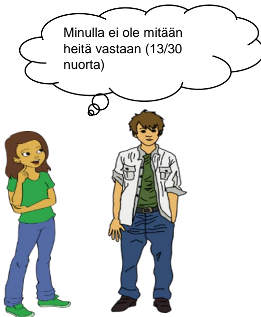
Kuvio 2. Nuorten myönteinen suhtautuminen turvapaikanhakijoihin.

Alla olevassa kuviossa (kuvio 2) näkyy turvapaikanhakijoihin myönteisesti suhtautuvien nuorten lukumäärä.