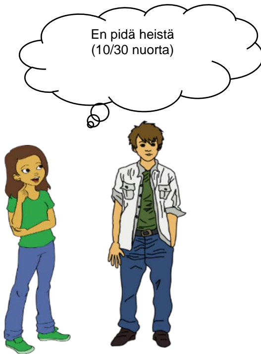
Kuvio 4. Nuorten kielteinen suhtautuminen turvapaikanhakijoihin.

Alla olevassa kuviossa (kuvio 4) näkyy turvapaikanhakijoihin kielteisesti suhtautuvien nuorten lukumäärä.