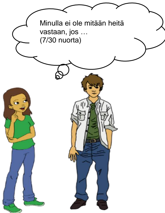
Kuvio 3. Nuorten myönteinen, mutta ehtoja asettava suhtautuminen turvapaikanhakijoihin.

Alla olevassa kuviossa (kuvio 3) näkyy myönteisesti, mutta ehtoja asettavasti turvapaikanhakijoihin suhtautuvien nuorten lukumäärä.