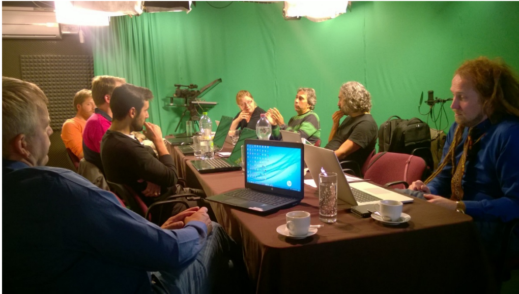
Kuva 2. Kansainvälinen verkosto kehittää yhdessä digiteknologiaa, SmartSet-projekti.

Elinkeinorakenteiden ja työn uudistuminen edellyttävät yrityksiltä aloitteita ja toimia, jotka vaativat uudenlaista näkemystä, rohkeita valintoja ja tekoja yli toimialarajojen. Aiemmin yksittäinen yritys on voinut toimia menestyksekkäästi omalla alallaan, mutta tämä pätee vain harvoin nykyisessä avoimessa ja globaalissa taloudessa. Resurssitehokkuus tulee olemaan teknologisen, sosiaalisen ja taloudellisen muutoksen ajurina. Avainaloja ovat ympäristö-, nano ja bioteknologiat sekä terveydenhuolto, joiden ympärille kuudes aalto kehittyy uudenlaisen teknologialustan ympärille luoden uusia tuotteita ja palveluita.