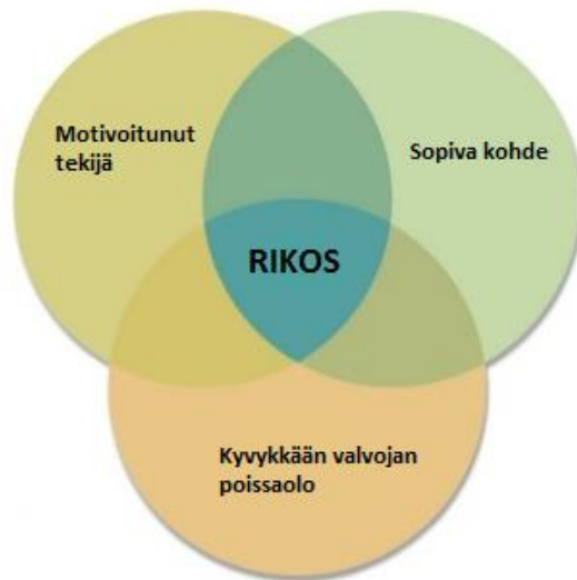
Kuva 1. Rutiinotoimintojen teoria.

Mikään näistä edellytyksistä ei yksin riitä tuottamaan rikosta, ja toisaalta yhdenkin puuttuminen ehkäisee rikoksen syntymisen (Laine 2007, 141). Motivoituneet tekijät ovat yksilöitä, jotka ovat sekä kykeneviä että taipuvaisia tekemään rikoksia. Sopivat kohteet ovat henkilöitä tai esineitä, jotka näyttäytyvät rikosentekijöille haavoittuvaisina tai erityisen houkuttelevina. On rikostyyppistä riippuvaa ja tapauskohtaista, mitkä tekijät saavat kohteen vaikuttamaan houkuttelevalta. Rikos siis tapahtuu motivoituneen tekijän kohdatessa sopivan kohteen valvomattomassa tilassa (ks. kuva 1). Teorian mukaan ihmisten rikosmotivaatioihin on hankala vaikuttaa, joten huomio kannattaa kiinnittää rikosentekomahdollisuuksien vaikeuttamiseen. Tähän keinoja ovat esimerkiksi valvonnan lisääminen ja rikosyllykkeiden poistaminen. (Niemi, luettu 10.3.2017.) On hyvä huomioida, että kyseessä on kuitenkin vain yksi rikollisuutta selittävästä malleista muiden joukossa.