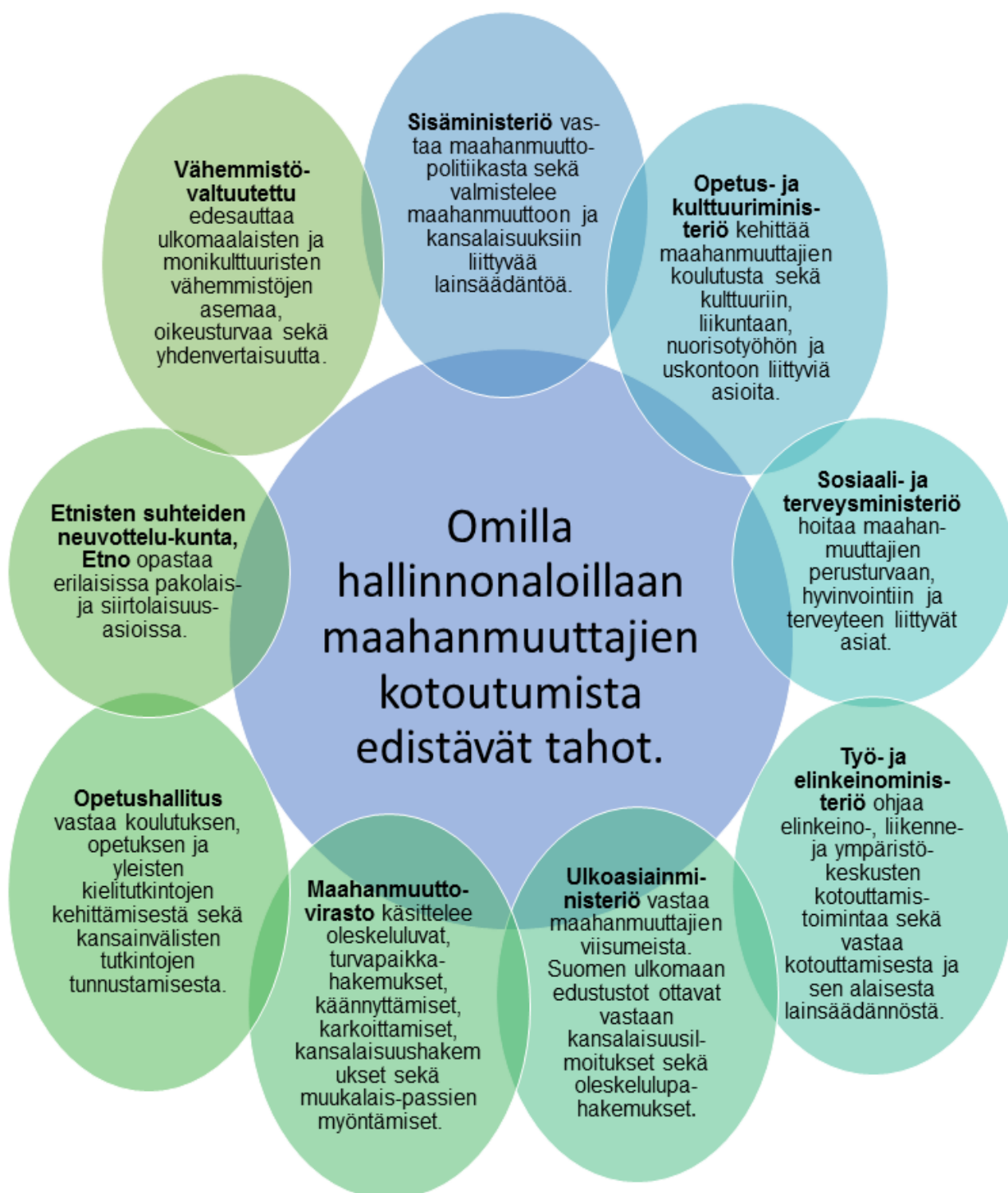
KUVIO 2. Omilla hallinnonaloillaan maahanmuuttajien kotoutumista edistävät tahot. (Työ- ja elinkeinoministeriö 2014.)