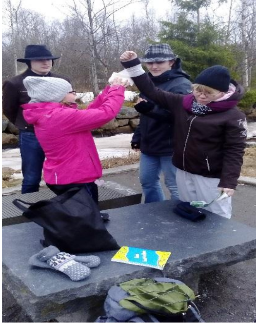
Kuva 2. Painesiteen harjoittelua.

Kun olimme saaneet perustiedot asioista käytyä läpi, siirryimme seuraavilla kerroilla ulos, jossa harjoittelimme asioita käytännössä: tulen tekemistä, laavujen pystyttämistä, ruoan laittamista avotulella ja retkikeittimellä sekä suunnistamista kartan avulla kaupungissa ja kompassin ja kartan avulla metsässä. Näiden lisäksi kävimme useilla kerroilla läpi hätäensiaputaitoja, jotta nuorille jäisi useiden toistojen kautta mieleen, kuinka haaverin sattuessa on mahdollista auttaa kaveria (kuva 2).