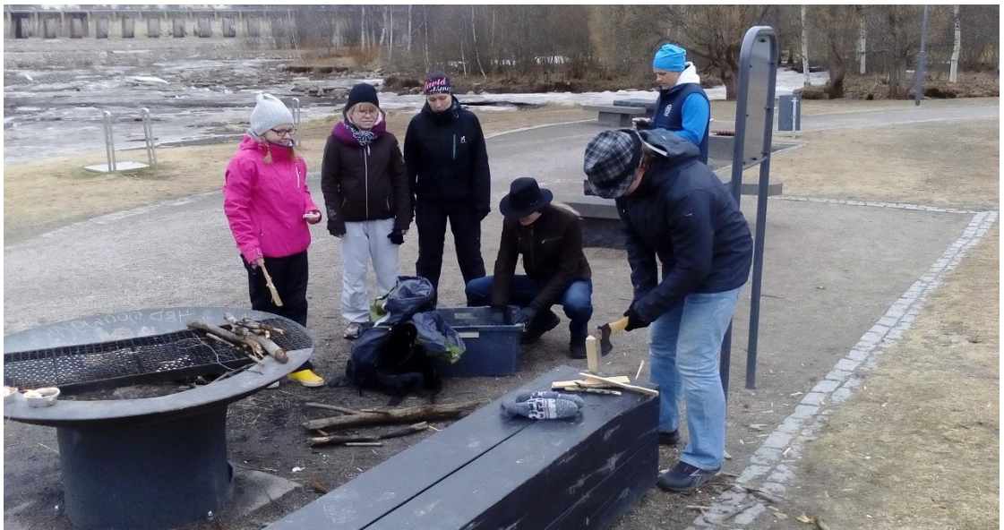
Kuva 3. Nuotion tekemisen opettelua Ainolan puistossa

Kun olimme saaneet perustiedot asioista käytyä läpi, siirryimme seuraavilla kerroilla ulos, jossa harjoittelimme asioita käytännössä: tulen tekemistä, laavujen pystyttämistä, ruoan laittamista avotulella ja retkikeittimellä sekä suunnistamista kartan avulla kaupungissa ja kompassin ja kartan avulla metsässä. Näiden lisäksi kävimme useilla kerroilla läpi hätäensiaputaitoja, jotta nuorille jäisi useiden toistojen kautta mieleen, kuinka haaverin sattuessa on mahdollista auttaa kaveria (kuva 2).