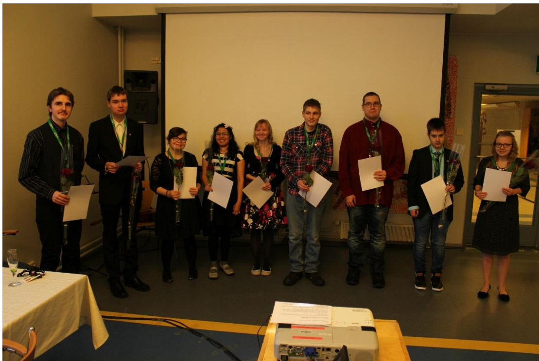
Kuva 4. Oulun, Limingan ja Muhoksen palkitut avarttilaiset

Tammikuussa aloitimme Avartti-ohjelman tehdyn ohjelman mukaisesti siten, että meillä oli paikalla aina kaksi ohjaajaa nuorten kanssa toimiessa. Ohjelma jaettiin osallistujille ensimmäisellä tapaamiskerralla, jolloin he näkisivät siitä, että mitä milloinkin tehdään. Tämä myös helpotti heidän varustautumistaan tapaamisiin, sillä kokoontumisten paikat olivat heille tuttuja ja koulun ympäristössä. Näin opiskelijat tiesivät, että esimerkiksi Kasarmin kentällä tapahtuva toiminta vaati ulkoiluvaatteet sään mukaan ja tarkempaa tietoa halutessaan, he voivat ottaa yhteyttä ohjelmaan merkittyihin ohjaajiin.