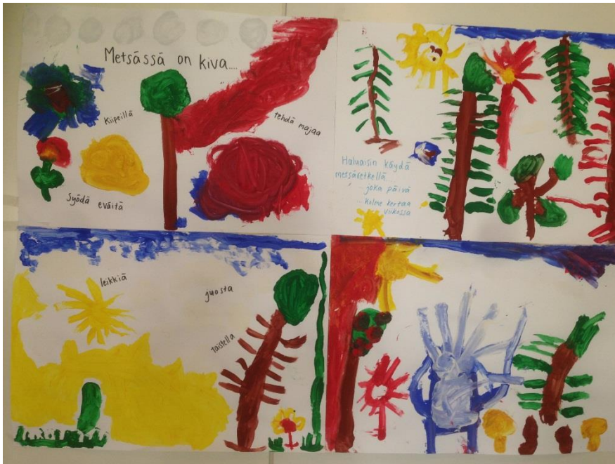
Tässä on kuva meidän maalauksesta

Keskustelussa kävi ilmi, että lapset tykkäsivät kovasti retkistä ja parasta retkillä oli majojen tekeminen sekä eväiden syöminen. Lasten kokouksissa tuli ilmi, että lasten mielestä metsäretket olivat kivointa päiväkodissa ja he toivoivat, että metsäretkiä tehtäisiin useammin. Lapset pitivät myös siitä, että otimme paljon kuvia metsäretkiltä. Heidän mielestä oli kivaa, että he saivat itse myös ottaa kuvia ja tehdä niistä metsäkirjan. Metsäkirjan tekeminen oli lapsista mieluisaa ja mielenkiintoista. Katsoimme metsäkirjan läpi monta kertaa ja se oli lapsille todella tärkeää. Luulen, että metsäkirjan teko oli lasten mielestä sen takia niin kiinnostavaa, kun se tehtiin Ipadilla. Ipadi kiehtoi lapsia, koska sitä ei käytetä joka päivä ja sen käyttöön tulee aina pyytää aikuisen lupa.