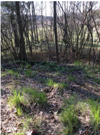
Kuvassa kevään merkkejä.