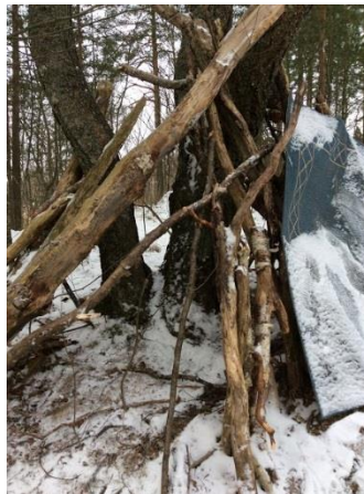
Tässä on kuva lasten rakentamasta majasta