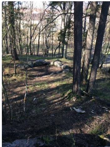
Kuvassa tyttöjen lempileikkipaikka.