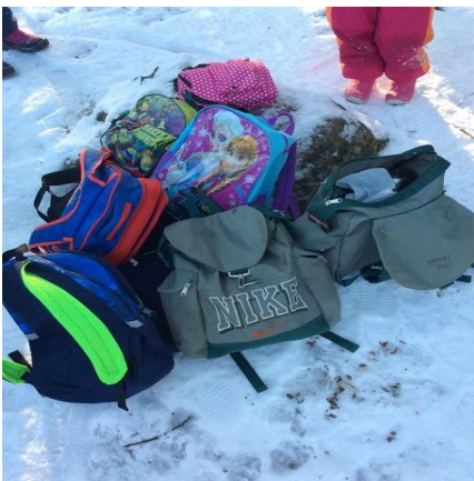
Tässä on kuva meidän reppurykelmästä

Lasten mielestä parasta metsässä olemisessa oli majan rakentaminen. Majaa rakentaessa leikit sujuivat todella hyvin ja aika meni nopeasti. Otin videokuvaa lasten majan rakennuksesta ja videossa näkyy lasten innostus majoja kohtaan. Lapset saivat myös itse ottaa kuvia majoista.