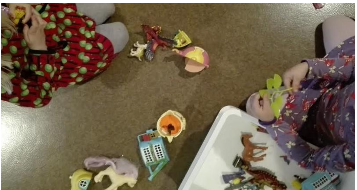
Kuva 3. Tyttöjen kooperatiivinen leikki.

Havaitsimme, että tyttöjen leikit rakentuivat useimmiten rinnakkaisleikeiksi. Rinnakkaisleikeissä lapset leikkivät lähestulkoon saman aiheisia leikkejä sekä samoilla leikkivälineillä, mutta siitä huolimatta he eivät olleet aktiivisessa vuorovaikutuksessa toistensa kanssa. Leikkiessään lapset saattoivat seurata toistensa toimintaa ja näin ollen voivat olla hiljaa, kommentoida tai tehdä aloitteita rinnalla leikkivää kaveria kohtaan. Lasten leikeissä oli havaittavissa myös toisten lasten leikkien jäljittelyä, jota voidaan pitää tehokkaimpana oppimisen keinona lasten keskuudessa. Useimmiten lapset osoittivat kiinnostusta samasta leikkivälineestä, mutta siitä huolimatta lapset kykenivät taidokkaasti vuorottelemaan ja vaihtamaan leikkivälineistä keskenään leikkien aikana. Tällaista toimintaa Kronqvist ja Pulkkinen (2007, 120) kutsuvat kooperatiiviseksi leikiksi. Kooperatiivista leikkiä voimme tarkastella kuvasta kolme.