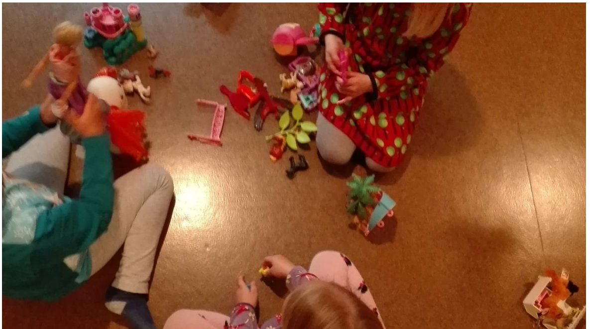
Kuva 2. Tyttöjen leikkejä Tenavakodilla.

Lapset, jotka leikkivät omaehtoisesti ja keskittyneesti aina fyysiseen väsymiseen asti, kehittyivät heistä kyvykkäitä yksilöitä, jotka oppivat uhrautumaan muiden yksilöiden sekä oman itsensä vuoksi. Tutkimustuloksista oli havaittavissa, että osa lapsista toteutti omaehtoista leikkiä hyvin sinnikkäästi ja keskittyneesti. Nämä lapset hallitsivat itse omia leikkejään ja säilyttivät sen itselle mielekkäänä alusta loppuun asti. (Kalliala 2008, 184.) Lisäksi havaitsimme, että jotkut lapset olivat ajoittain valmiita tinkimään parhaiden ystävien leikkiseurasta, kunhan he saivat leikin säilymään itselle mielekkäänä. Seuraavaksi kuvasta kaksi on havaittavissa, miten keskittyneesti tytöt leikkivät omia leikkejään omilla leikkivälineillään.