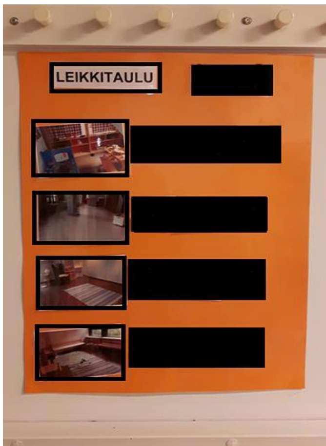
Kuva 6. Leikkitaulu Tenavakodille työvälineeksi.

Tutkimuksen myötä meille heräsi ajatus siitä, voisimmeko helpottaa aikuisten ja lasten välistä toimintaa jonkin työvälineen avulla, missä lapset saisivat vaikuttaa valitsemiinsa leikkeihin muullakin tavoin kuin neuvottelemalla asiasta aikuisen kanssa. Kuvassa kuusi on leikkitaulu, jonka kehitimme molempiin tutkimuskentän lapsiryhmiin. Leikkitaulun avulla pyrimme edistämään lasten valinnan vapautta omassa lapsiryhmässä. Näin ollen lapsille tarjoutuu mahdollisuus valita itse, missä leikkutilassa ja kenen kanssa he haluavat leikkiin ryhtyä. Toivomme, että pystymme leikkitaulujen avulla helpottamaan myös aikuisten työmäärää. Näin ollen lapset eivät aina tarvitsisi aikuista leikin valinnan vaiheeseen, vaan opittuaan leikkitaulun käytön, lapset osaisivat itsenäisesti tehdä valintoja leikkien suhteen oman nimilapun avulla. Lapsilla on mahdollisuus leikkitaulun avulla valita leikkutila, leikkivälineet ja leikit. Näiden valintojen myötä lapset pystyvät luomaan keskinäisiä suhteita ja jokainen lapsi olisi leikin valintaa tehdessä tasavertaisessa asemassa toisiinsa verrattuna.