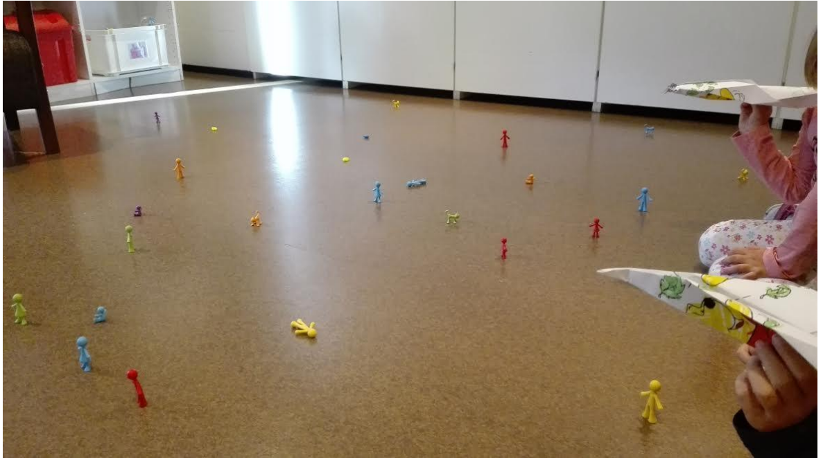
Kuva 5. Lasten leijaleikki.

Kuvassa viisi lapset keilaavat leijoilla vuoron perään lattialle itse asettamiaan ukkeleita. Jokaisella lapsella oli oma lennokki, jonka hän oli valmistanut yhdessä aikuisen kanssa. Lennokkien avulla keilaus tapahtui. Lapset keilasivat vuoron perään ja jokaisen keilauksen jälkeen he laskivat yhdessä kaatuneiden keilojen määrän. Leikki kesti noin 20 minuutin ajan. Myöhemmin saman päivän aikana lapset kyselivät ryhmän aikuisilta missä omat lennokit olivat, mikä oli osoitus siitä, että lennokkileikki oli lapsille mielekäästä.