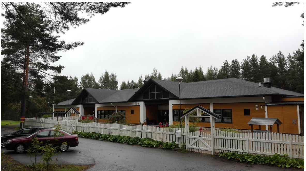
Kuva 1. Tenavakodin päiväkotikoti.

Kuvassa yksi on Tenavakodin päiväkotikoti, joka tuottaa varhaiskasvatuspalveluita Seinäjoen kaupungin alueella. Tenavakodin päiväkodin toimintaidea perustuu koulutetun henkilökunnan tarjoamaan turvalliseen ja laadukkaaseen hoitoon, kasvatukseen sekä opetukseen alle kouluikäisille lapsille. Heidän toimintaansa ohjaavia arvoja ovat turvallisuus, rakkaus ja läheisyys. (Seinäjoen kaupunki 2016.)