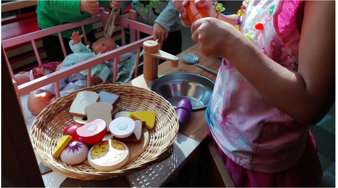
Kuva 4. Roolileikkien antia.

Aluksi kotileikiksi muodostunut leikki muuntui ajan myötä kodiksi, jonka yhteydessä oli sairaala, tutkimushuone sekä leikkaussali. Tämä osoitti erinomaista mielikuvituksen käyttöä ja se sai aikaan pitkäkestoisemman ja monipuolisemman leikin. Tähän mennessä olimme havainneet lasten leikkien kestävän vain minuutista muutamiin minuutteihin. Tämä oli ensimmäinen leikki, joka kesti 30 minuutin ajan. Jäimme miettimään, vaikuttiko leikin kesto se, että aikuinen oli jakamassa ulkoilun jälkeen lapset eri leikkitaloihin, eikä tästä syystä samassa leikkitalissa ollut niin montaa lasta leikkimässä samanaikaisesti.