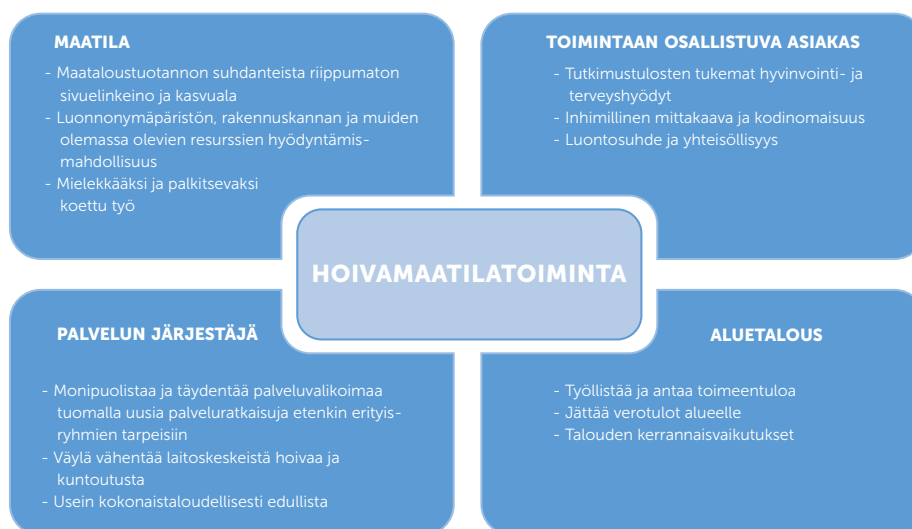
Kuva 2. Hoivamaatilatoiminnan hyötyjä -nelikenttä.

Hoivamaatilatoiminnan hyötyjä voikin jäsentää toimintaan osallistuvan asiakkaan lisäksi maatalan, palvelunjärjestäjän ja koko aluetalouden näkökulmasta. (Kuva 2)