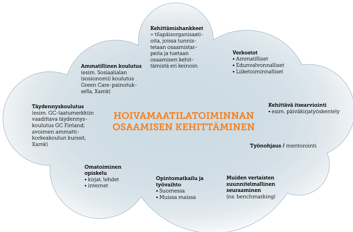
Kuva 4. Hoivamaatilatoiminnan osaamisen kehittäminen

Alasta kiinnostuneen yksittäisen maatilatoimijan kannalta kehittäminen edellyttää hakeutumista yhteyksiin, missä osaaminen voi rakentua ja vahvistua. (Kuva 4).