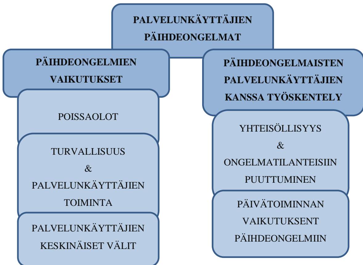
KUVIO 2. Opinnäytetyön tulokset

Opinnäytetyön tulosten (kuvio 2) mukaan työntekijät kokivat palvelunkäyttäjien päihdeongelmilla olevan moninaisia vaikutuksia sekä palvelunkäyttäjien elämään että päiväpalveluiden toimintaan osallistumiseen. Päiväpalveluissa päihdeongelmien vaikutukset näkyivät selkeimmin poissaoloina ja vaikeutena sitoutua toimintaan. Päihdeongelmilla oli vaikutuksia myös työntekijöiden ja palvelunkäyttäjien turvallisuuteen sekä palvelunkäyttäjien toimintaan ja heidän keskinäisiin väleihinsä. Päihdeongelmaisten palvelunkäyttäjien kanssa työskentelyyn liittyvistä asioista työntekijät nostivat esiin erityisesti yhteisöllisyyden merkityksen, jota käytettiin hyväksi myös mahdollisiin ongelmatilanteisiin puuttuttaessa. Päivätoimintaan osallistumisella koettiin olevan usein vaikutuksia palvelunkäyttäjien päihteiden käyttöön ja päihdeongelmiin.