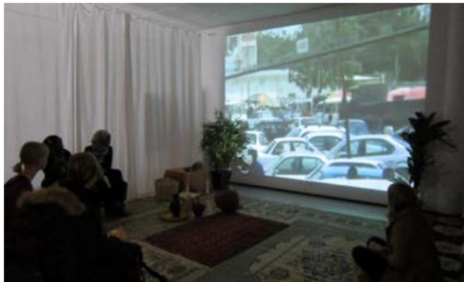
Laurean moniaistinen tila

Hankkeen ydintä, moniaistista tilaa, oli kokeiltu ja kehitetty Laurea-ammattikorkeakoulussa jo vuodesta 2007. Ensimmäinen moniaistinen tila oli rakennettu Laureaan vuonna