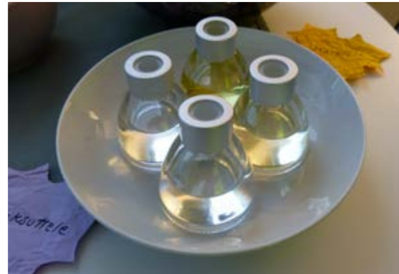
Tuoksuja hyödynnettiin Heinolan asukastuvilla kiertäneissä rentoutustiloissa.

Jyränkölässä toimii nuoria työllistävä työyksikkö, Media-paja, jossa ohjaajien lisäksi työskentelee kerrallaan noin 20 alle 30 -vuotiaasta nuorta. Nuorten ohjaaminen on kokonaisvaltaista ja haastavaa, ja ryhmäprosesseihin on kiinnitettävä erityistä huomiota. Mediapajalaiset ovat olleet tärkeitä hankkeen käytännön toteutuksen kannalta. Heillä on ollut mahdollisuus suunnitella ja toteuttaa myös omiin kiinnostuksen kohteisiinsa liittyviä moniaistisia tiloja (esim. luonto-, sadutus- ja joulutila). Tilan toteutus on kokonaisvaltainen prosessi, jossa tekijät ovat mukana alusta loppuun. He osallistuvat suunnitteluun, materiaalien hankintaan, ääni- ja kuvamaailman tuottamiseen ja toteuttamiseen, tilan kokoamiseen, markkinointiin, valvontaan ja asiakasohjaukseen sekä tilan purkuun. Toteutus on toiminut itselle tärkeiden asioiden esille tuomisen välineenä, sekä tuottanut onnistumisen kokemuksia. Vastuu oman osa-alueen hoitamisesta osana kokonaisuutta lisää luottamusta omiin kykyihin ja tiivistää ryhmäläisten yhteishenkeä. Asiakkailta saadut palautteet sekä lopuksi käytävät palautekeskustelut antavat nuorelle kokonaiskuvan siitä, miten prosessi onnistui kokonaisuudessaan, ja mikä vaikutus omilla tekemisillä oli onnistumisen kannalta.