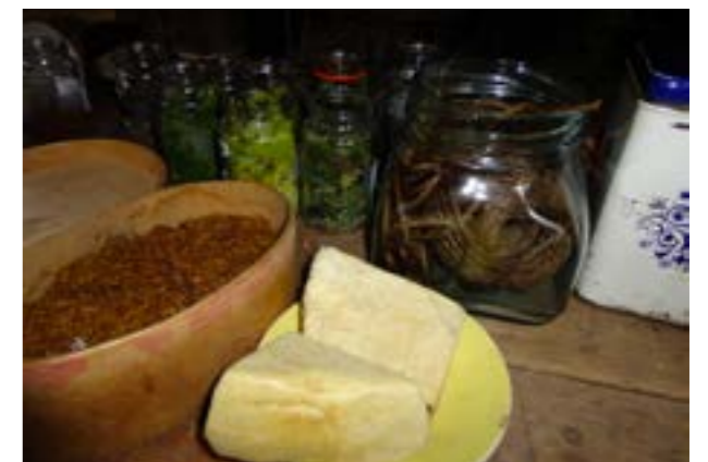
Vanha palasaippua osoittautui vaikeaksi arvattavaksi oppilasryhmille.

Mielenpainuvan hauholaisuutta juhlistavan päivän jälkeen Aistien-tilaa on hyödynnetty myös muissa seuran tapahtumissa. Joulukuksi 2012 rakentui Joulupukin paja keräten kansalta kirjeitä joulupukille – ideoita pitäjän kirkonkylän kehittämiseksi. Seuraavana vuonna osana Hauho-päivää Halpparin talossa vietettiin moniaistista, lapsille ja lapsenmielisille suunnattua kummitustarinailtaa. Aistien maailma asettui Hauholle, jäädäkseen. ■