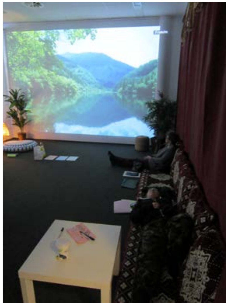
Aistien-luokkatila muuntautuu helposti