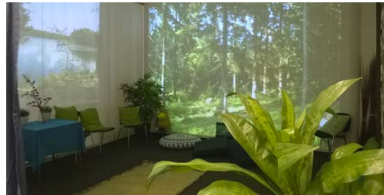
Aistien-tilassa voi myös hengähtää hetken