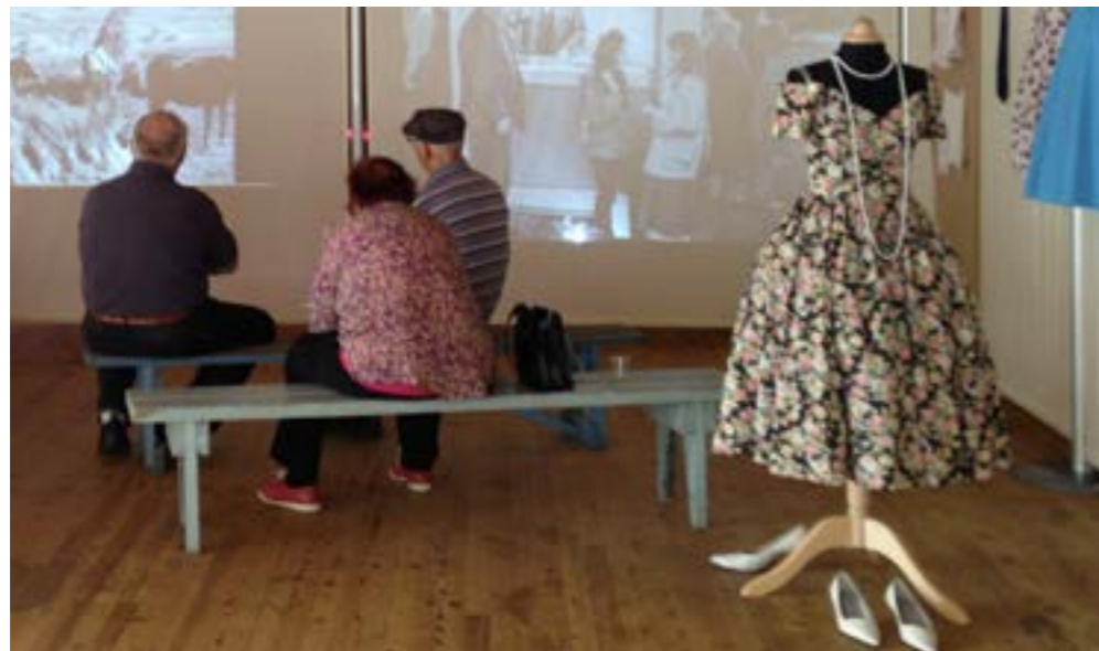
Tanssit Untulassa Aistien-tilassa muisteltiin lavan vaiheita ja nuoruuden kesä.

Aistien-tilan seiiniin heijastimme valokuvia tansseista sekä Lammi-Seuran valmistaman kotiseutuelokuvan, jossa näkyi myös tuokiokuva tanssilavasta ja tanssijoista 1960-luvulta. Taustalla soi Olavi Virran, Dallapen ja Annikki Tähtien tanssimusiikkia. Tilan seinille suurensimme tanssijoiden lähettämät kertomukset tanssien tunnelmista ja tapahtumista kuunsillasta alushameen putoamiseen kesken tanssin. Seinällä oli myös paikallislehdessä julkaistuja tanssi-ilmoituksia, jotka kertoivat viikoittain lavan esiintyjät toukokuusta syyskuuhun. Ilmoituksissa oli mainittu myös linja-autokuljetukset lähikaupungeista ja Lammin kylistä Untulaan. ”Parkkipaikka oli täynnä linja-autoja. Yksityisautoja oli vielä vähän. Monet tulivat tansseihin pyörällä kymmenienkin kilometrien takaa. Maanantaiaamuksi oli ehdittävä töihin, joten polkemista riitti.”