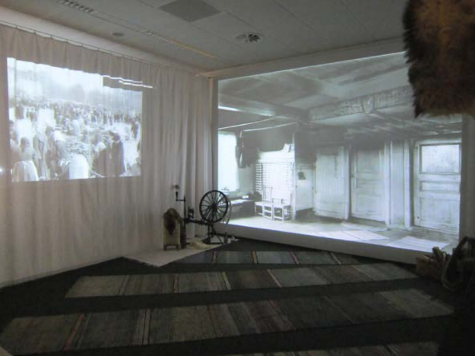
Syksyllä 2013 Laurean moniaistiseen tilaan toteutettu sisällissota-aiheinen tila. Taustan kuva: Museoviraston kuvakokoelmat, KK1107:69, Emil Rasinperän tuvan sisustus Kuortaneen kylässä.

ja ryhmien historiallisen toimijuuden lähtökohdasta käsin ilman determinismimiä. Tapahtumien ja muutosten takana on aina vastuullinen toimija eikä kasvoton kehityssuunta. Toimijaan voi samastua, mutta se tehdään kun on tutustuttu toimijan tarkoitukseen sekä vastatoimijoiden pyrkimykseen. Historiallinen identiteetti on tällöin kriittisesti rakennettu ja sisältää ainekset ymmärtää toisten ihmisten erilainen samaistuminen. (Ahonen 2002, 72.)