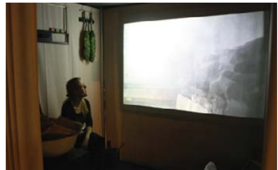
Lapin maakuntamuseon liikuteltava Aistien-tila

Pääaineistona käytettiin Helsingin Sanomia, jonka uutis- ja kuvavirrasta poimittiin sekä Korsoon liittyvää