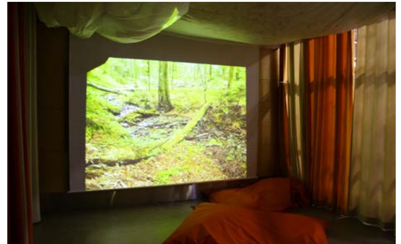
Lumon kirjaston Aistien-tila