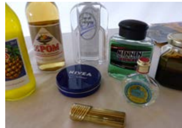
Tilasta rakentui tunnelmaltaan viihtyisä ja nostalginen tanssimusiikin, hajuvesien ja esineiden kautta.

Untulassa on vietetty vapaata sunnuntai-iltaa raskaan päivätyön vastapainoksi, opittu tanssimaan, tavattu suomalaisia laulajakuuluisuuksia ja ihmetelty ulkomaisia esiintyjä. Moni Aistien-tilassa kävijä kertoi kohdanneensa tansseissa tulevan elämänkumppaninsa. Aistien-tilan käyttö sopi hyvin aiheeseen ja tarjosi kävijöille paikan muistella nuoruutta. Mieleen palasi paljon onnellisia muistoja,