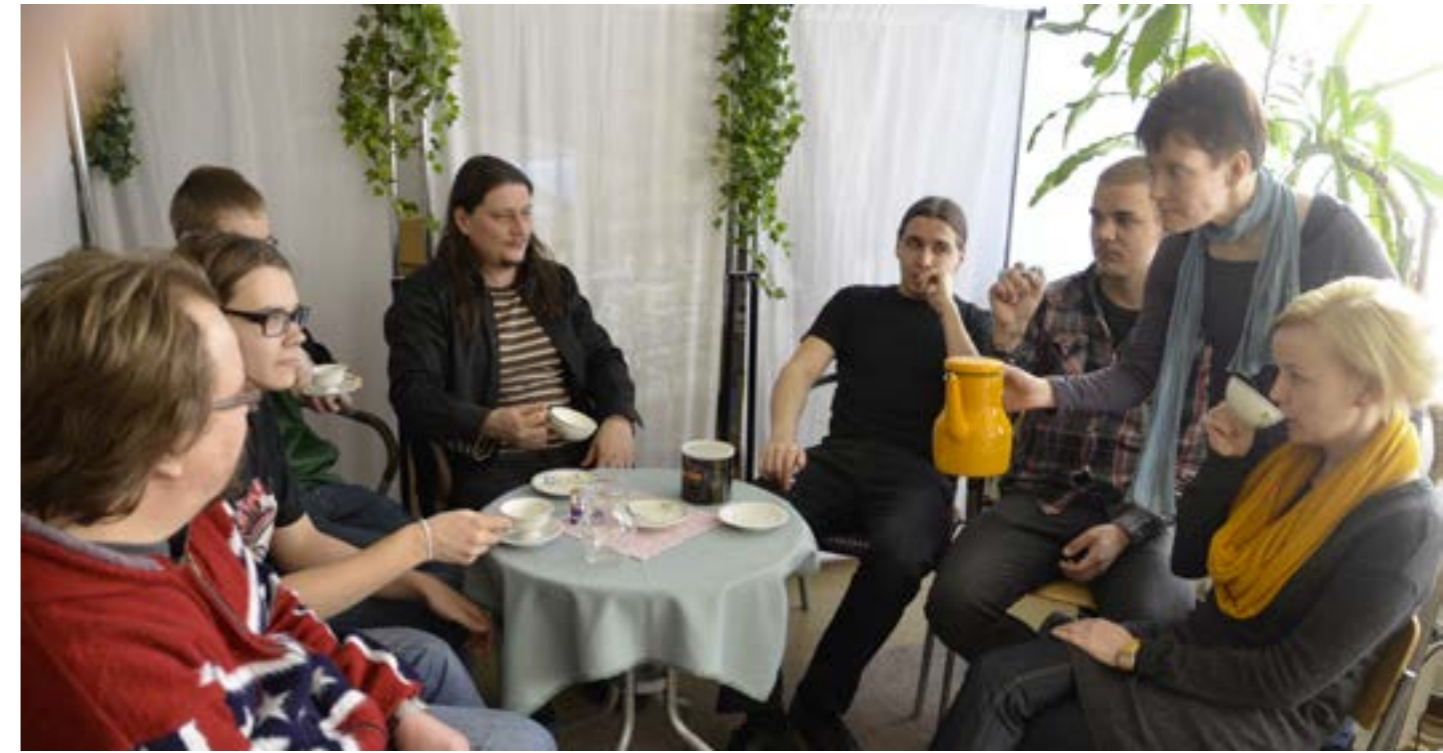
Kielikahvilassa keskustelua ja oppimista tuettiin viihtyisällä ympäristöllä.

”Tämä oli vaikuttavaa! Kiire oli taas päällimmäisenä - ei ole enää. Taas lähempänä maata!”