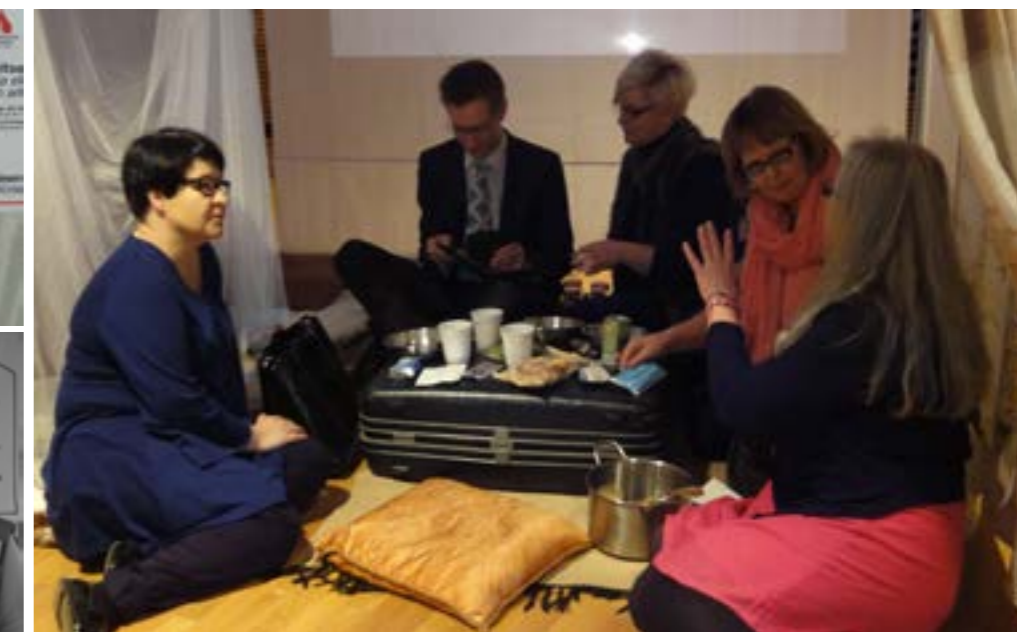
Pakolaisteltoa oli esillä erilaisissa tapahtumissa