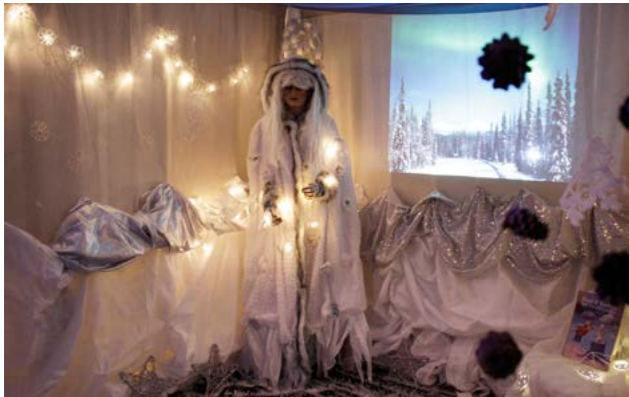
Sadunhohtoisessa teltassa kerrottiin satuja