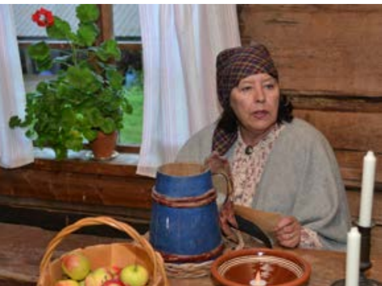
Suunnitteluryhmän jäsenet emännöivät Halpparin taloon tehdyssä Aistien-tilassa.

Samaan aikaan posteihin kiiri tieto Aistien-hankkeen pilottihausta, kuin tilauksesta. Idea löysi Hauho-Seurasta kannattajansa – haettiin ja päästiin pilotiksi Aistien-hankkeeseen tuomaan kotiseututyöhön moniaistisia mahdollisuuksia Hämeen Kylät ry:n johdolla.