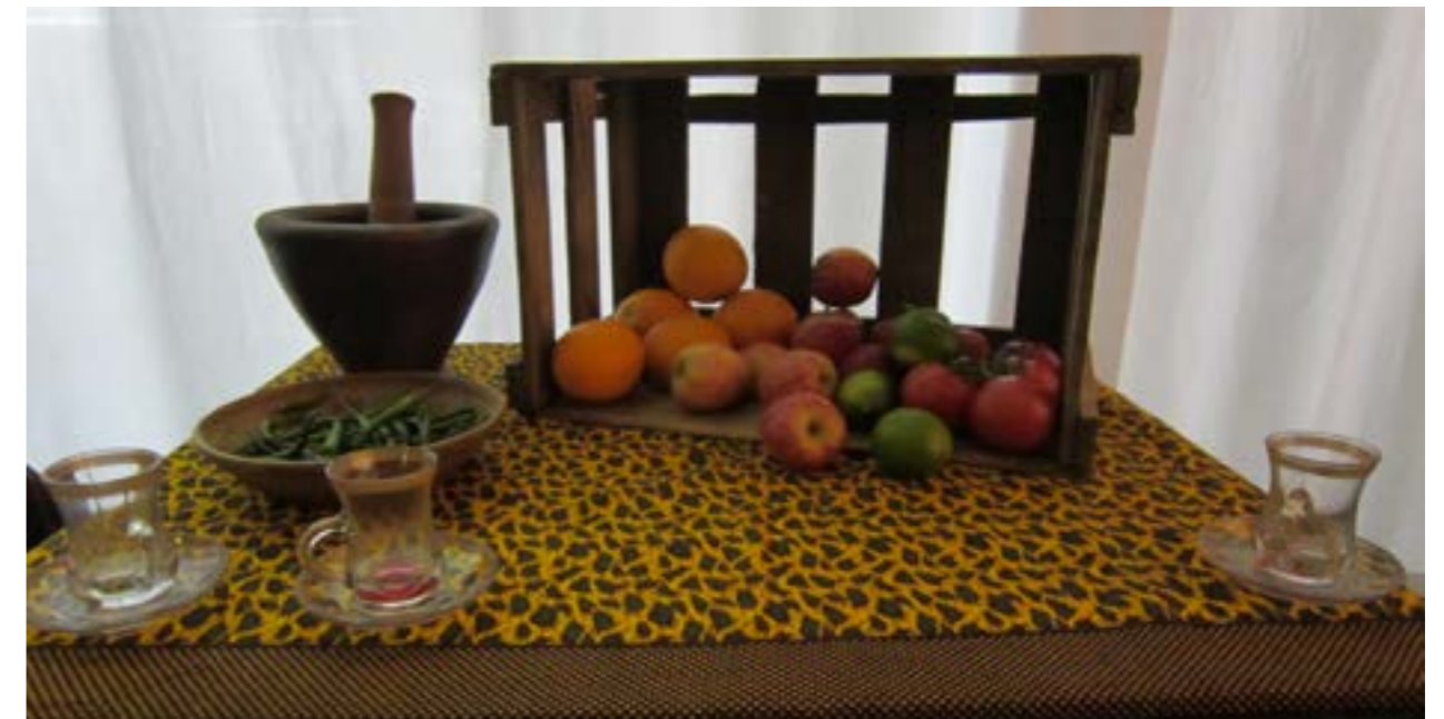
Tuoksut ja maut johdattelivat eri kulttuureihin

Laurean Tikkurilassa on käytössä oma Aistien-tila, jonne on ollut teknisesti helppoa rakentaa kohderyhmän tila. Tilassa on ollut mm. valmiit verhotangot ja tarvittavat audiovisuaaliset laitteet. Lisäksi lainattavissa on ollut kannettavia audiovisuaalisia laitteita, sekä liikuteltavia teltoja, joiden avulla Aistien-tilan on voinut rakentaa Laurean muihin tiloihin tai yhteistyökumppaneiden omiin tiloihin. Käytännön