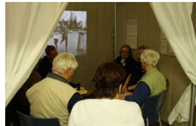
Aistien-tilassa keskustellaan ja kohdataan

Kirjastot mielellään tarjoavat tilojaan avoimille tapahtumille, mutta on hyvä muistaa, että kirjastojen mahdollisuudet toteuttaa hyviä ideoita yksinään ovat rajalliset. Yhteistyön tavoitteena onkin usein tarjota ihmisille ja yhteisöille tilaa ja näkyvyyttä. Itse tapahtumien toteuttaminen olisi mielellään yhteistyökumppaneiden tehtävänä, ellei toisin sovi.