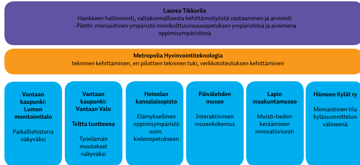
Kuvio 1. Aistien-hankkeen toimijat ja tavoitteet

Pilottien myötä nousi yhä selkeämmin esiin, että Aistien-menetelmässä elämyksellisen valmiin tilan rinnalla yhtä tärkeää on sen rakentamisen prosessi. Tekijöiden on itse määriteltävä sekä prosessin tavoitteet, kohderyhmä että toimintatavat. Aistien-tilan rinnalle syntyi Aistien-menetelmä, joka väljästi määriteltiin siten, että se on menetelmä, jossa hyödynnetään moniaistisuutta, korostetaan yhdessä