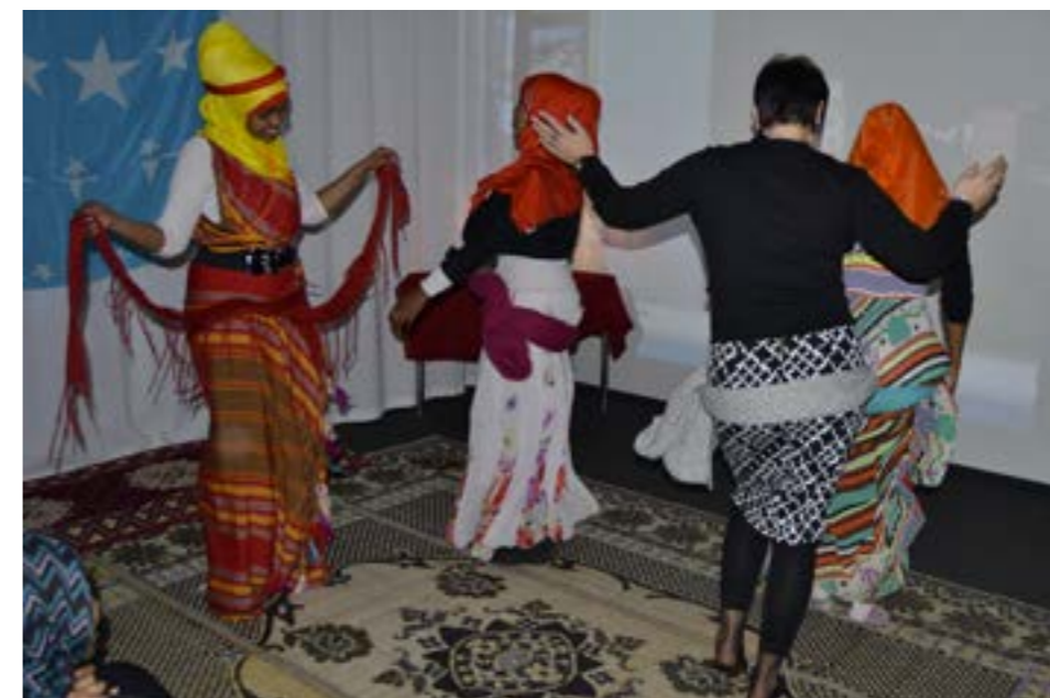
Aistien tilassa kohdataan myös esimerkiksi tanssien

Tyypillinen alkuvaiheen opintojen tehtävä oli rakentaa päiväksi Aistien-tila yhteistyössä maahanmuuttajien kanssa. Projektin edetessä alettiin tehdä säännöllistä yhteistyötä Aikuisopiston kotouttamiskoulutuksen kanssa, jolloin opiskelijat rakensivat Aistien-tiloja pienryhmissä, ryhmässä 4-6 sosionomiopiskelijaa ja 1-5 maahanmuuttajaa. Tämä melko nopeasti tehdyn harjoituksen tarkoituksena oli esitellä menetelmä opiskelijoille, ja antaa heille kokemusta yhteistyöstä.