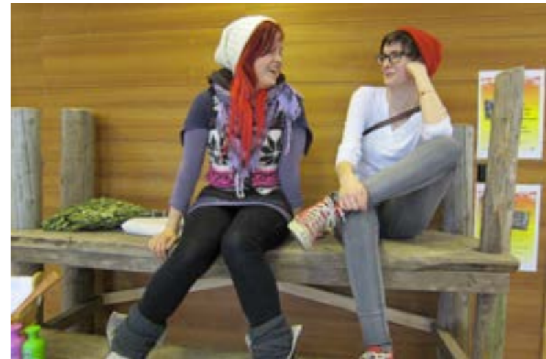
”Häkyn saunalauteiden kanssa on säädetty” oli yhden projektiryhmäläisen kommentti

AC-huoneen lisäksi yhdessä työstämisen työvälineinä käytettiin mm. Laurean hallinnoimaa virtuaalista Optima-oppimislustaa sekä Google Drive -työtilaa. Niiden välityksellä tehtiin yhdessä esimerkiksi menetelmäopasta, erilaisia tilan mallinnuksia sekä nettisivuja.