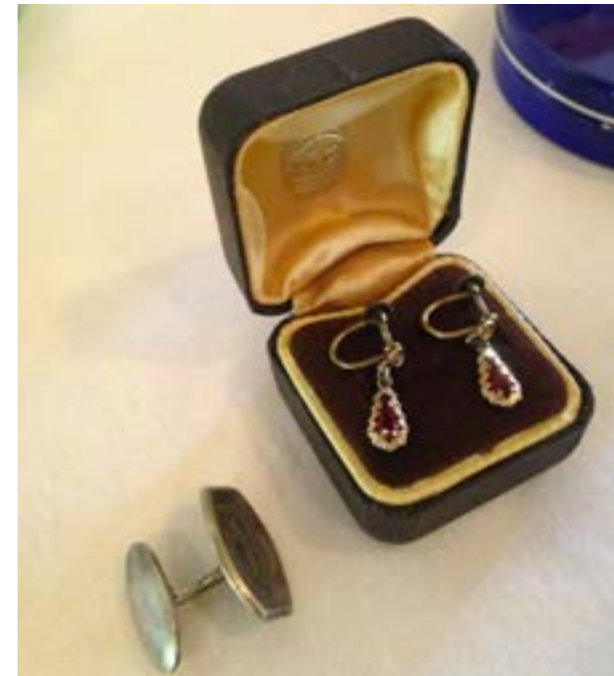
Esineitä saatiin lainaan niin tilan tekijöiltä kuin heidän tuttavilta.

Leningit, entisajan alusvaatteet ja tanssikenkien herättivät muistoja ja kertoivat ajan pukeutumistyylistä. Asuja ja tavaroita hankittiin kirpputoreilta, kyläyhdistyksen väeltä ja pukuvuokraamosta. Vanhoja levyjä saatiin lainaksi Hakkan koululta. Maisteltavaksi valittiin entisajan virvokkeita, Sitruunasoodaa ja Pommacia. Lavalla tuoksuivat aikakauden haju- ja partavedet. ”Kaikki me tytöt tuoksuimme samalle kielohajuvetelle.”