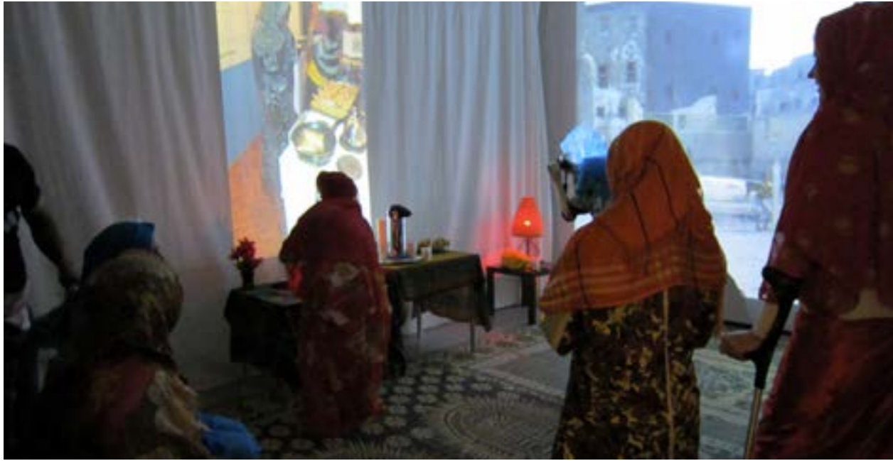
Tiloja toteutettiin kotouttamiskoulutuksessa olevien maahanmuuttajien kanssa

merkityksestä vuorovaikutukseen ja ympäristön voimaannuttavasta vaikutuksesta.