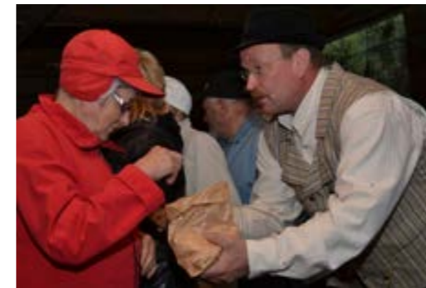
Kulkukauppias tarjosi maistiaisina pastilleja vieraille. (kuvaaja: Jouni Lehtonen)

Kapaasiensa kanssa ennen vanhaan kulkeneet kulkukauppiat tapasivat koota ihmisiä rempeillä luonteillaan ja erityislaatuilla tuotteillaan. Niinpä yhtenä ohjelmanumerona saapui aistien äärelle myös hauholainen pastilleja ja hameenreunuspitsiä kaupitellut huumoriveikko, joka erityisesti naisväen keskuudessa nostatti suunpielet kohti tuvan komeaa kattoa.