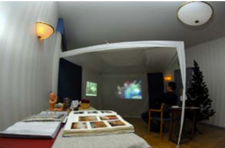
Aistien -tila Heinolan kansalaisopiston 80 -vuotisesta historiasta

Kulttuuriperinnön siirtämiseen soveltuvat mainiosti erilaiset historiatilat, joihin on aisteille kohdistettujen elementtien avulla pyritty lisäämään elävyyttä. Kaikki eivät innostu historian opiskelusta kirjan ja luentojen kautta - opiskelu voi olla tehotonta ja keskittyminen vaikeaa. Aistien-menetelmää hyödyntäen voidaan luokkaan rakentaa aiheeseen liittyvä oppimisympäristö, jossa on kuultavana kulloiseenkin teemaan liittyviä ääniä ja kosketeltavana vanhoja esineitä ja materiaaleja. Tilassa leijuu tuoksuja, jotka liittyvät opeteltavaan aikakauteen tai asiaan. Lisäksi maisteltavana on erilaisia makuja, jotka syventävät kokemusta.