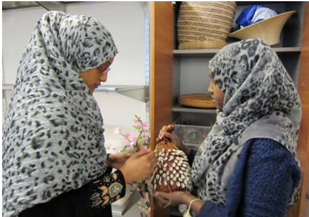
Aistien tilan rakentaminen on identiteettineuvottelua konkreettisen tekemisen kautta