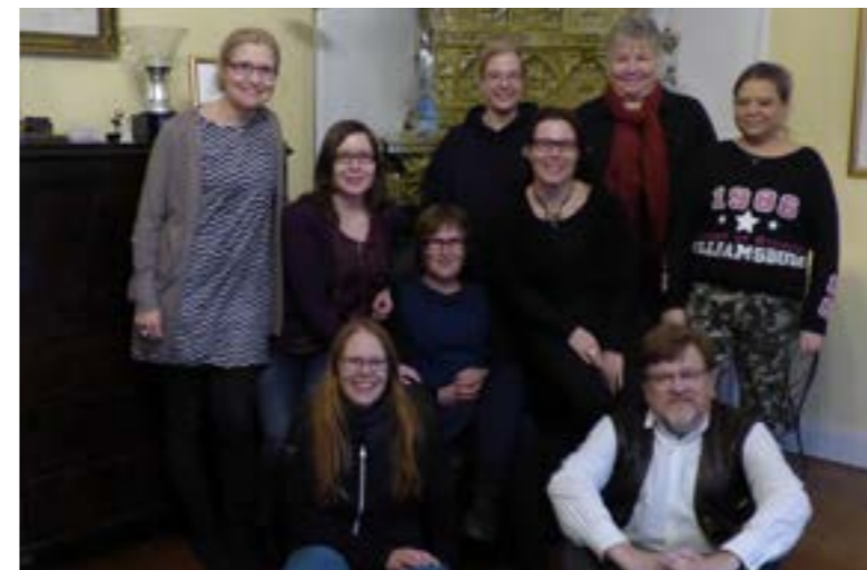
Projektiryhmä oli koko hankkeen aikana kehittämistoiminnan ydin. Projektiryhmä kokoontui viimeisen kerran lokakuussa 2014 arvioimaan hankkeen toimintaa ja tuloksia

Tämän jälkeen fyysisiä projektiryhmän tapaamisia oli vuosittain kolme ja ne järjestettiin vuorotellen eri osatoteuttajien luona. Tapaamiset ja kokoukset aloitettiin aina kierroksella, jossa jokainen kertoi kuulumisiaan. Joskus se tehtiin kuvin, joskus vuoropuheluna. Muutenkin tapaamiset olivat