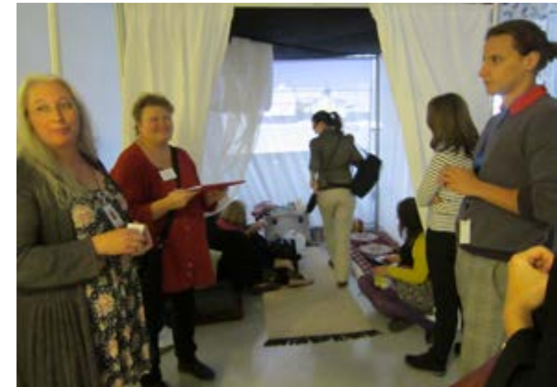
Pakolaisteltta oli esillä Aistien-hankkeen päättöjuhlassa

huomiota paikallisessa ja alueellisessa mediassa. Kesäkuussa SPR:n yleiskokous toteutuu Turussa ja kaksi telttaa tutustuttaa SPR:n omaa väkeä ja suurta yleisöä pakolaisasioihin.