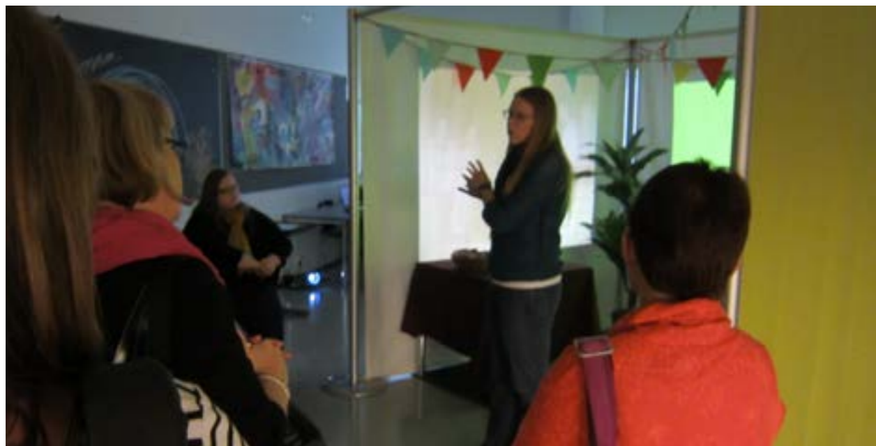
Erilaisia Aistien-tiloja oli aina esillä hankkeen seminaareissa

Siksi toivon, että Aistien-menetelmä jää elämään. ■