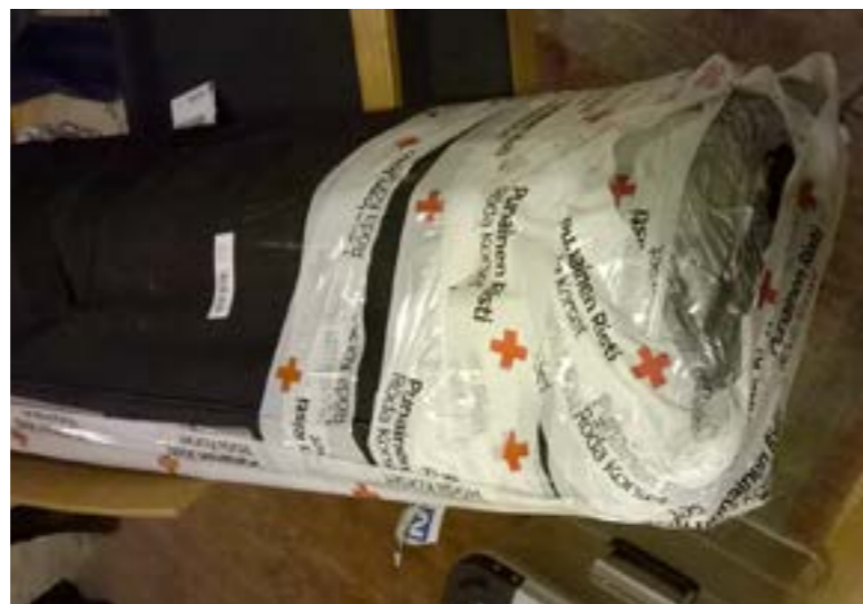
Pakolaisteltoa on kiertänyt ahkerasti - roudariteippiä tarvitaan

Aistien-tilan voi toteuttaa myös ei niin mukavana paikkana. Toivomme että onnistuimme herättämään myötätuntoa pakolaisia kohtaan, mutta kuvaamaan pakolaiset ja heidän tilanteensa arvostavasti ja realistisesti. ■