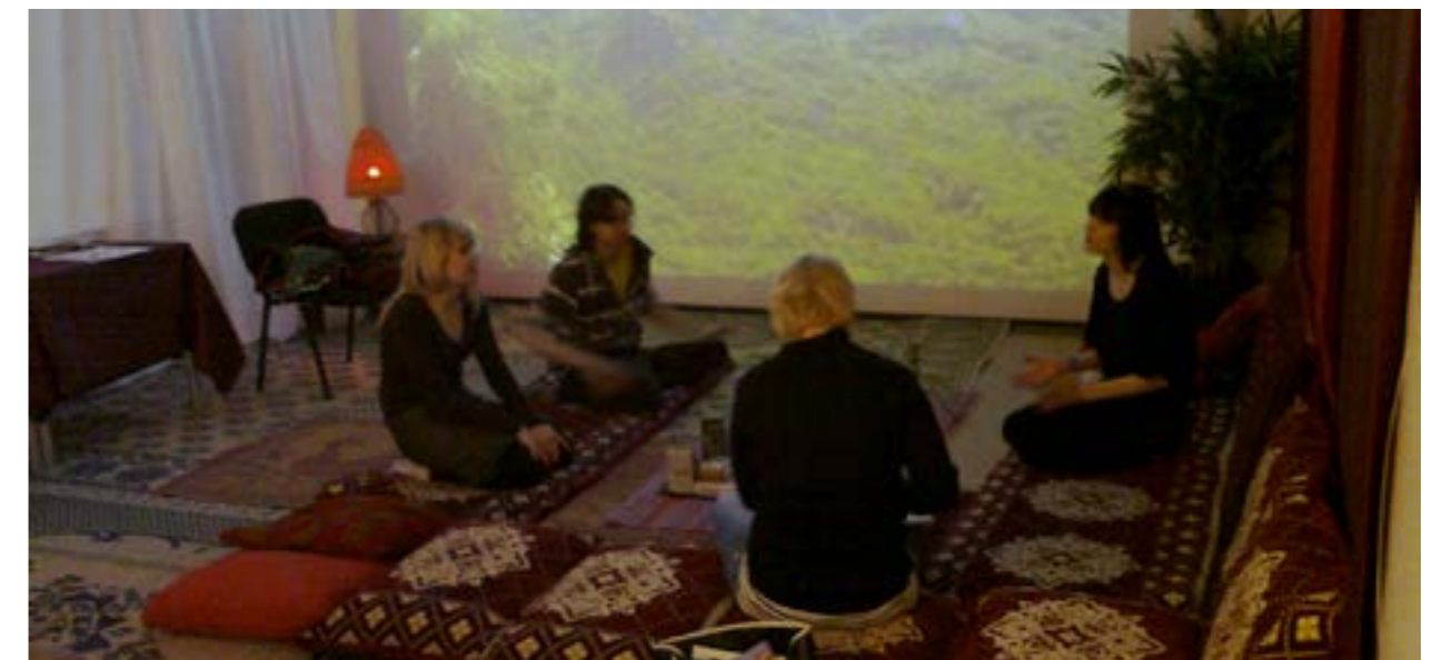
Aistien-tilaa käytettiin vuorovaikutuksen oppimisen välineenä

Laurean Tikkurilassa on toteutettu useiden vuosien aikana monenlaisia opintojaksoja, joihin on integroitu Aistien-menetelmällä oppimista. Opintojaksot, joissa itse olen opettajana ollut mukana, ja joihin Aistien-menetelmää on sovellettu, ovat liittyneet vuorovaikutustaitojen harjoittamiseen, ohjaamiseen ja monikulttuurisuuden ymmärtämiseen. Vuosina 2012 – 2014 opiskelijoita näissä opintojaksoissa on ollut noin 120 ja opinnot on suunnattu lähinnä ensimmäisen vuoden sosionomiopiskelijoille. Tärkeimpinä oppimisen tavoitteina on ollut näissä oppimistehtävissä toteuttaa pienimuotoista ammatillista kohtaamista ja vuorovaikutusta asiakkaan kanssa, sekä saada kokemusta ympäristön