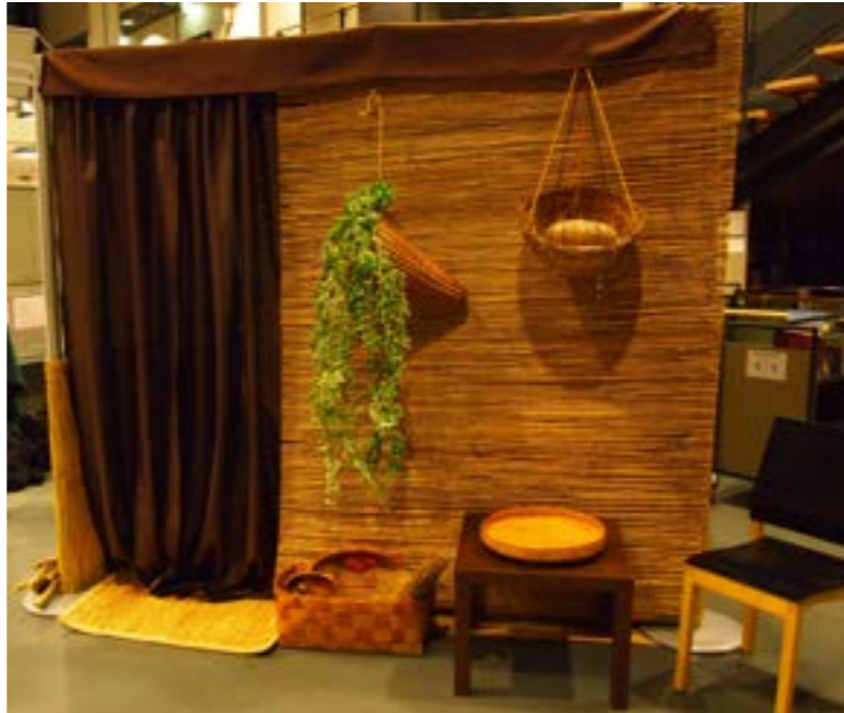
Maja-maja Porvoon kirjastolla

nuoren kanssa aina viikko, siten että joka päivä oli yhteistä työskentelyä yhdestä kahteen tuntiin. Perjantaina tila oli avoinna nuoren kutsumille vieraille: perheenjäsenille sekä yksikön muille nuorille ja työntekijöille.