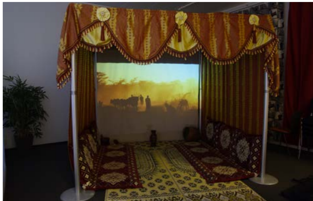
Liikuteltava tila mahdollisti Aistien-tilan toteuttamisen myös Laurean seinien ulkopuolella

Myös ohjaajan rooli puhututti. Milloin pitää ottaa päävastuuta siitä, miten esimerkiksi valmiiseen tilaan tulevia