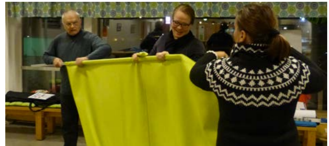
Tulevaisuustila rakennettiin yhdessä Tuuloksen yhdistysten kanssa liikuteltavaan Aistien-tilaan.

Ensimmäisessä työpajassa pureuduttiin Tuuloksen toimintaan ja vahvuuksiin sekä miten niitä tuotaisiin esille valokuvien avulla. Illassa saatiin oppia valokuvauksesta ja haastettiin yhdistykset ottamaan kuvia omasta toiminnasta tulevaisuustilaa varten. Toisessa työpajassa aiheena olivat tuuloslaisten tarpeet ja toiveet. Tulevaisuustilaa varten tehtiin tulevaisuuden uutisotsikoita, aivan kuin toiveet olisivat jo toteutuneet. Paikallislehden toimittaja oli mukana opastamassa tiedotteen tekemisestä ja otsikoinnissa. Valmiiseen tilaan saatiinkin hauskat lööpätkät Tuulos-Sanomiin ja Tuulos-lehteen. Kolmannessa työpajassa mietittiin tilan muita materiaaleja ja miten sitä hyödynnetään yhdistysten yhteistyön käynnistämiseen. Yhteisesti päätettiin, että järjestetään teemallisia tapaamisia tilassa ja hyödynnetään tilaa inspiroivana keskusteluympäristönä.